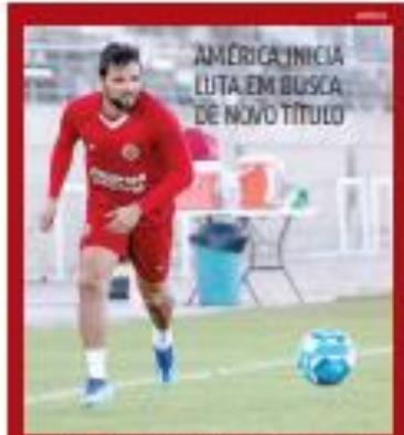
AMÉRICA INICIA LUTA EM BUSCA DE NOVO TÍTULO

« CORRUPÇÃO » O período de volta às aulas tem deixado comerciantes animados com vendas para o período de início de ano letivo. No Alcaçur, lojas esperam um incremento nas vendas de 30% a 35% em materiais escolares, como livros, mochilas, cadernos, lápis e canetas. « PÁGINA 1 »