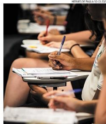
Prova. Governo estima ao menos 2 milhões de inscritos

O governo federal lançou o edital do Concurso Nacional Unificado, o chamado "Enem dos Concursos", destinado a contratar novos servidores para 6,6 mil vagas, quase todas com exigência de formação em nível superior, em 21 órgãos. Do total, 31% dos postos têm salário inicial maior que R$ 10 mil. O maior é para a vaga de auditor de trabalho (R$ 22,9 mil). As inscrições vão de 19 de janeiro a 9 de fevereiro e devem atrair mais de dois milhões. Impacto fiscal das contratações será de R$ 2 bilhões anuais no Orçamento. PÁGINAS 15