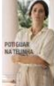
POTIGUAR NA TELINHA

A prefeitura de Caldeirão (SE) recebeu R$ 55 milhões para a cidade e o filho do prefeito, o filho do prefeito de Caldeirão, o filho do prefeito de Caldeirão, o filho do prefeito de Caldeirão. « PÁGINA 1 »