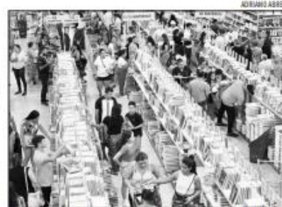
Lojas do Alecrim apresentam alta procura nos últimos dias

O Procon do Rio Grande do Norte (Procon RN) divulgou, na última terça-feira (9), uma nota técnica orientando os consumidores sobre a compra de material escolar para o ano letivo de 2024. O documento visa esclarecer dúvidas e fornecer diretrizes para que os consumidores possam fazer escolhas mais informadas e evitar possíveis abusos. A nota técnica destaca pontos fundamentais, incluindo a recomendação aos pais para solicitarem a lista de materiais escolares com antecedência, permitindo a pesquisa de preços e a escolha de estabelecimentos mais vantajosos. A nota alerta também sobre práticas de preços excessivos, incentivando os consumidores a denunciarem qualquer indício de elevação injustificada