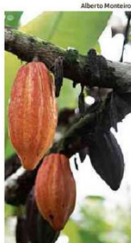
Cacaueiro da fazenda Dengo Origem, em Ilhéus (BA)

'Acho difícil interpretar alguém que seja fraco', afirma Jodie Foster