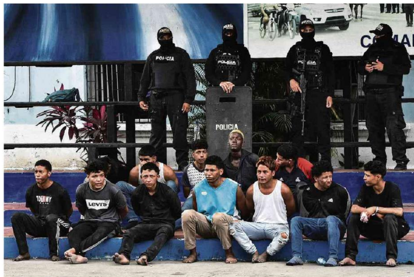
Policiais apresentam presos por invasão de emissora de TV em Guayaquil; mais de 130 agentes penitenciários seguem reféns no país ontem.

Jornalista da Al Jazeera que perdeu 3 filhos em Gaza tenta manter ofício A11