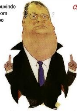
— Só para lembrar: estou pronto para o Supremo servir!