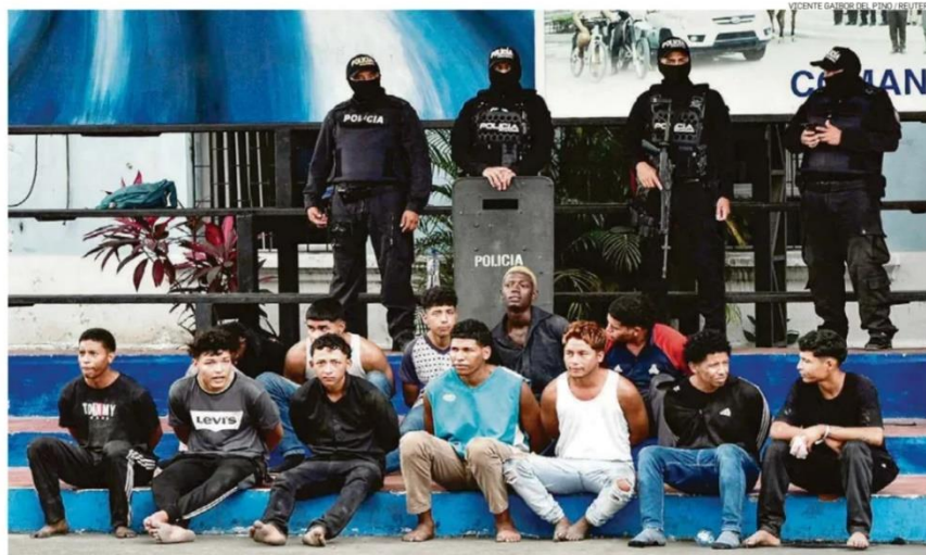
Polícia equatoriana apresenta homens que invadiram estúdio de TV na terça-feira em Guayaquil; episódio aumentou pânico entre a população

Governo equatoriano planeja deportar estrangeiros integrantes de facções do tráfico; Peru declara emergência em região fronteiriça