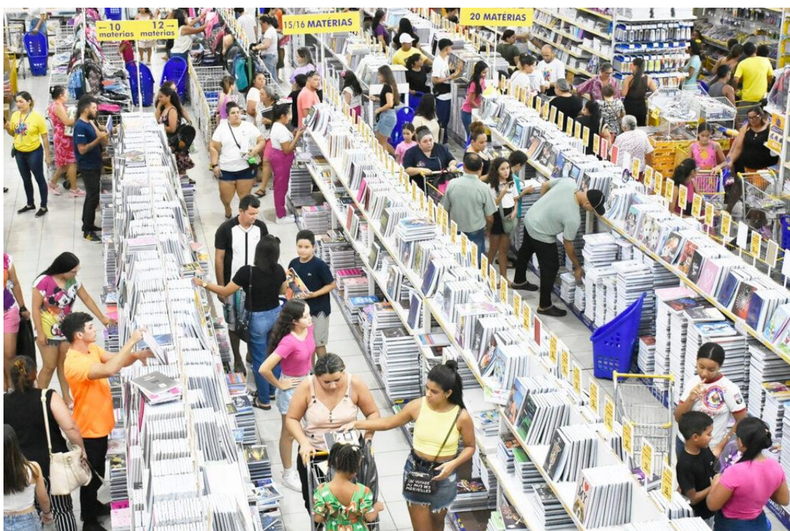
Lojas do Alecrim apresentam alta procura nos últimos dias