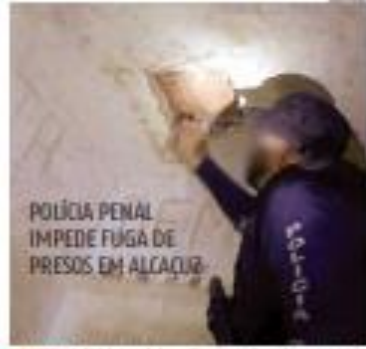
POLÍCIA PENAL IMPEDIR FUGA DE PRESOS EM ALCAÇUR

« SOB SUSPEITA » Críticas pelo presidente Lula da Silva na margem de 2024, o pagamento de emendas sem transparência continuará em 2024, em valores que somam quase R$ 25 bilhões. No Orçamento deste ano, a falta de transparência se dá nas emendas de combodo e nas transferências especiais, conhecidas como "emendas Pix". No primeiro caso, são cerca de R$ 16,7 bilhões onde os nomes dos autores das indicações são omitidos. Já nas emendas Pix, fixadas em R$ 8,1 bilhões, os autores são conhecidos, mas o uso do dinheiro se torna opaco. « PÁGINA 4 »