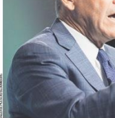
Sob intensa pressão de reguladores, do mercado e de clientes, o CEO da Boeing, Dave Calhoun, reconheceu a responsabilidade da empresa pelo incidente potencialmente fatal com avião da Alaska Airlines. Página D4