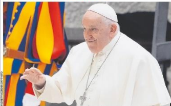
Em decisão histórica, o papa Francisco autorizou os sacerdotes da Igreja Católica a abençoarem a união de casais do mesmo sexo em "ablação irregular". A autorização, no entanto, deixa expresso que a bênção não se confunde com o sacramento do matrimônio. Página A13