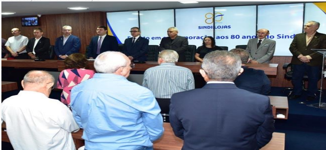
Sessão especial foi realizada nesta segunda-feira, 18

A Câmara Municipal de Mossoró sediou, hoje (18), solenidade de comemoração aos 80 anos do Sindicato do Comércio Varejista de Mossoró (Sindilojas). Com a participação de vereadores e de dirigentes empresariais, o evento reforçou a importância do comércio e reconheceu pessoas pela contribuição ao setor em Mossoró e região.