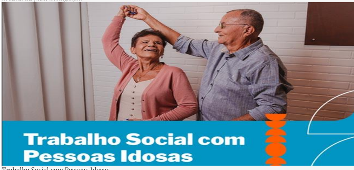
Trabalho Social com Pessoas Idosas

O Trabalho Social com Pessoas Idosas (TSPI), desenvolvido pelo Serviço Social do Comércio (Sesc RN), está com o período de renovação de matrículas para 2024 aberto até o dia 12 de janeiro, em Natal (Cidade Alta), Caicó e Mossoró. Já as matrículas para os novos inscritos acontecem a partir do dia 15/01. O projeto oferece oficinas de memorização, aulas de dança e de canto, alongamento e encontros temáticos como parte da programação, voltado para o público a partir dos 60 anos.