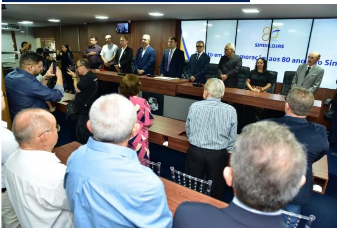
Solenidade aconteceu à manhã desta segunda-feira

A Câmara Municipal de Mossoró sediou na manhã desta segunda-feira (18), solenidade de comemoração dos 80 anos do Sindicato do Comércio Varejista de Mossoró (SINDILOJAS). Com a participação de vereadores e de dirigentes empresariais, o evento reforçou a importância dessa entidade classista e reconheceu pessoas pela contribuição ao setor em Mossoró, região e estado.