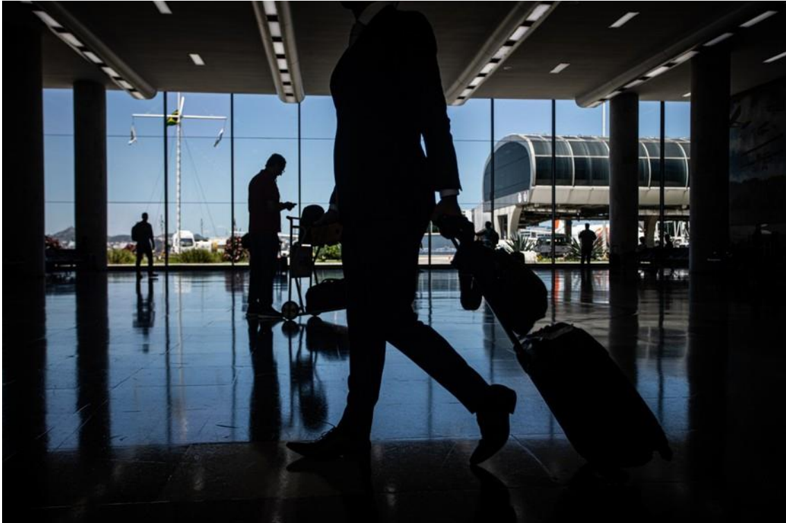
Aeroporto Santos Dumont. Governo tenta reduzir preço das passagens aéreas

O governo lançou nesta segunda-feira a primeira etapa do Plano de Universalização do Transporte Aéreo com o objetivo de reduzir o preço das passagens aéreas. A estratégia costurada entre o governo e as companhias prevê a oferta de uma cota de passagens a preços mais acessíveis.