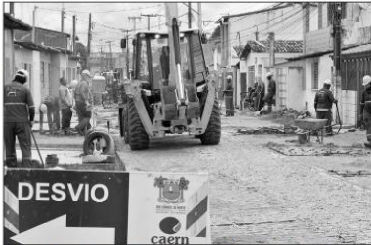
Caern espera atrair, até 2023, R$ 5 bilhões em investimentos para a implantação de abastecimento de água e esgotamento sanitário

Nessa segunda-feira (18), a Coordenação Executiva de Relações Institucionais e Mercado da Federação das Indústrias do RN (Fiemr) participou de reunião na Secretaria de Planejamento para conhecer os detalhes da regulamentação dessa legislação, a chamada Lei das PPPs.