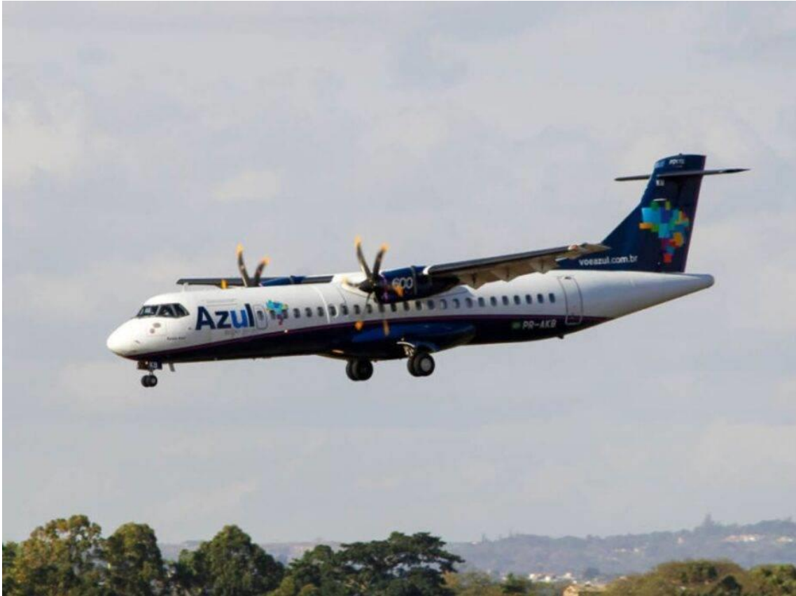
Empresas lançarão ofertas para 2024

O Ministério de Portos e Aeroportos (Mpor) e as maiores companhias aéreas do País anunciaram nesta segunda-feira (18) as primeiras medidas para redução dos preços das passagens aéreas. O anúncio foi focado na promessa de maior volume de promoções.