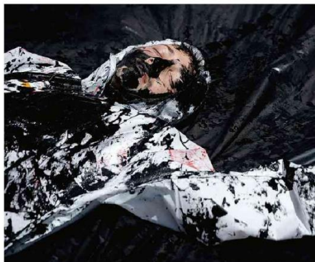
Protesto de indígenas e ambientalistas em frente a hotel no Rio de Janeiro onde acontecia leilão do governo federal para exploração de petróleo no Rio Grande do Sul.

Pressão de países da Opep evitou termo "eliminação" de combustíveis fósseis em documento final