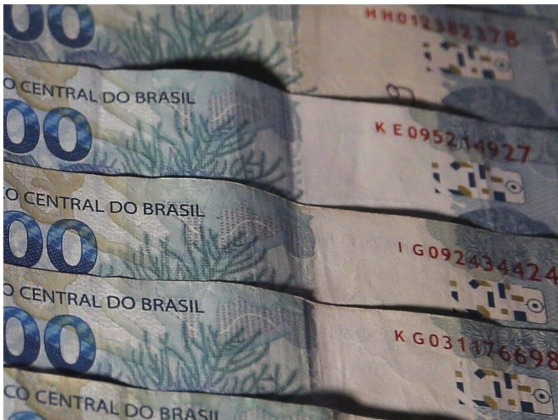
RN teve maior alta do País no número de inadimplentes em novembro, aponta Serasa