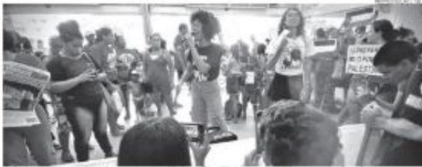
Ação acontece nesta final de semana em unidade da Zona Norte da rede de hipermercados Carrefour