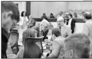
Imagem de dentro da sessão do governo de Fátima de Sousa e a governadora volta a tom com deputados

Deputados da oposição e da oposição reagiram contra as críticas da governadora Fátima de Sousa (PT) por ter votado contra a aprovação da alíquota do ICMS, responsabilizando-a por uma eventual crise fiscal do Rio Grande do Norte em 2024 e pedindo a renúncia da governadora.