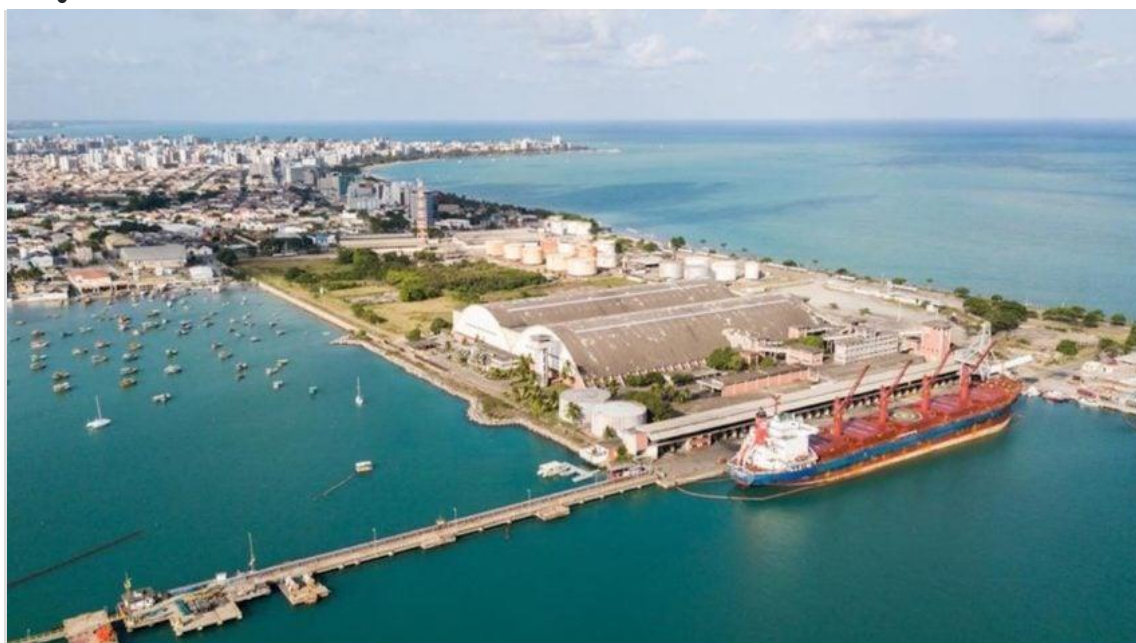
O terminal no Porto de Maceió foi o único a atrair uma disputa no leilão; na foto, Porto de Maceió

Ministério de Portos e Aeroportos leiloou 5 instalações em 4 portos; valor de outorgas foi baixo devido à pouca competitividade