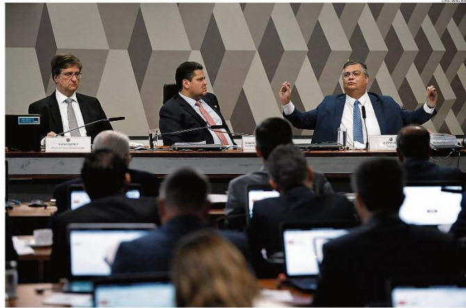
Longa metragem. Gonet, à esquerda, o presidente da CCJ do Senado, Davi Alcolumbre, e Flávio Dino durante a sabatina conjunta que começou pela manhã e só terminou à noite

nado, seu nome foi aprovado com 47 votos. Com os holofotes em Dino, Gonet acabou poupado de inquirições mais duras. Ele afirmou não ser contra a Lei de Cotas, apesar de já ter feito textos críticos à legislação. Em plenário, teve 65 votos a favor. PÁGINAS 4 e 10