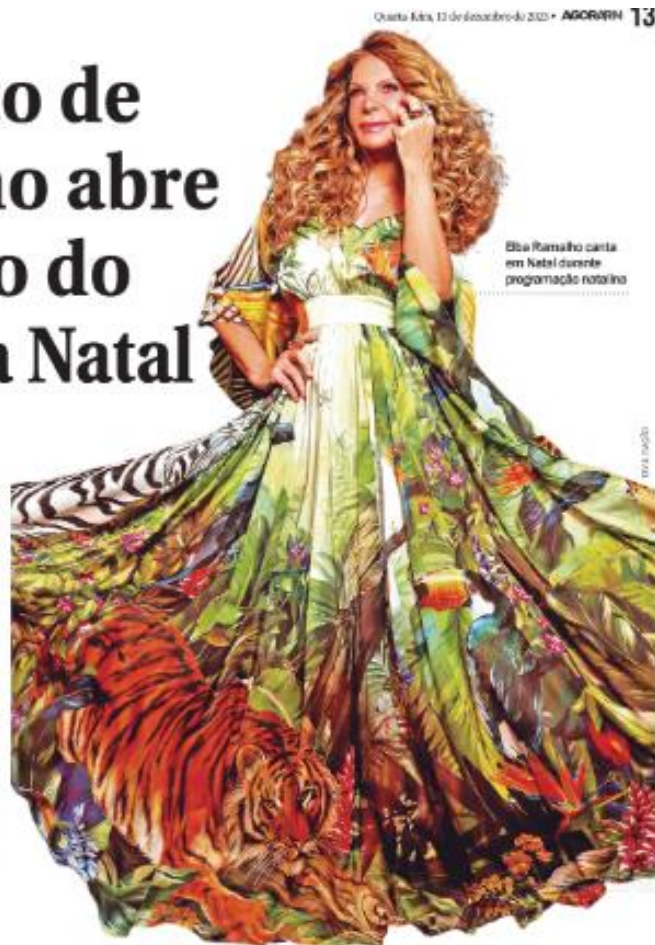
Elba Ramalho canta em Natal durante programação natalina

"Tenho certeza que seremos presenteados com uma belíssima apresentação da Orquestra Sinfônica da UFRN e com a energia contagiante de Elba Ramalho, mas a festa está só começando. Ainda teremos dez dias de cultura, gastronomia, tren-