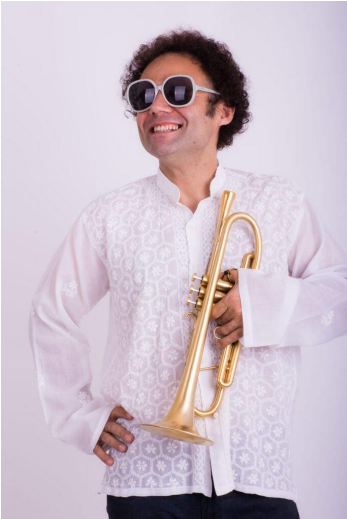
Maestro do Forró