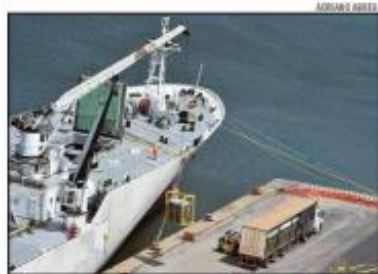
Exportações foram impulsionadas pelas remessas de melão

Ainda integram a lista das importações mais relevantes a gasolina, os painéis e células fotovoltaicas e o óleo de petróleo, que somam um volume de importações da ordem de US$ 55 milhões – volume que é 17,4% superior aos US$ 46,8 milhões importados em novembro do ano passado.