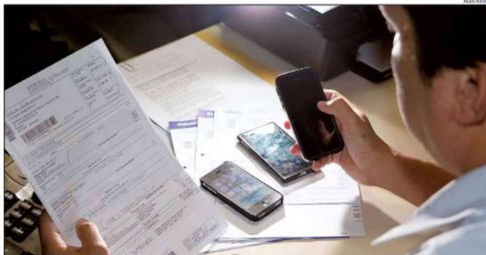
Número de inadimplentes no Rio Grande do Norte cresceu em 35.367 mil pessoas em relação ao mês de outubro deste ano

A maior parte dos débitos é referente a pendências com Bancos e Cartões (34,64%). Em