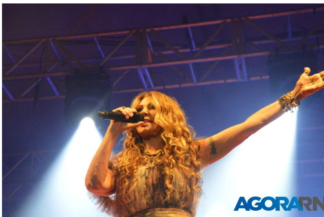
Cantora Elba Ramalho.

Para fomentar o comércio de rua no Alecrim e na Cidade Alta, o projeto Brilha Natal Fecomércio RN promoverá uma extensa programação cultural