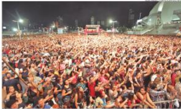
Público aproveita shows de artistas locais e de destaque nacional, com estrutura na área externa da Arena das Dunas

"Com muita alegria, anunciamos esse leque de grandes atrações para o natalense e os turistas celebrarem esse período natalino em grande estilo. Aberto espaço para diversos gostos e estilos musicais, para agradar todos os públicos. O Natal em Natal possui uma importância enorme para a cidade, pois proporciona lazer e entretenimento, bem como traz um impacto muito positivo para a economia local", pontuou o prefeito.