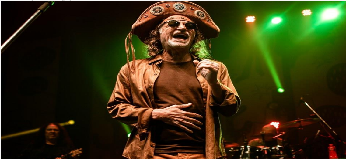
Alceu Valença é um dos atrações do Natal em Natal