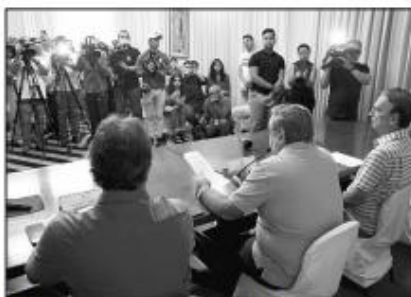
A imprensa foi chamada para conhecer a lista das atrações