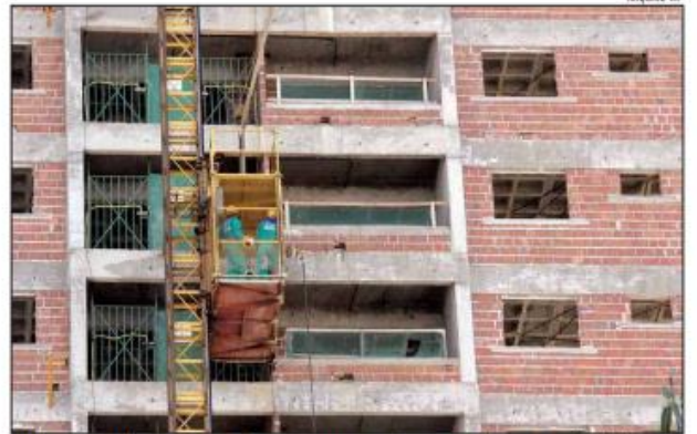
Há uma expectativa de recuperação dos lançamentos de empreendimentos residenciais

Um dos principais pontos é a esperada continuidade na redução da taxa Selic, o que deverá se traduzir em queda nos juros dos financiamentos tanto para a construção quanto para aqui-