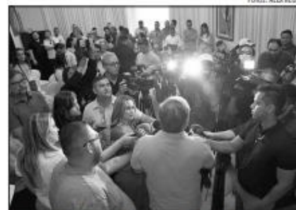
O Prefeito Álvaro Dias explica como a festa será realizada