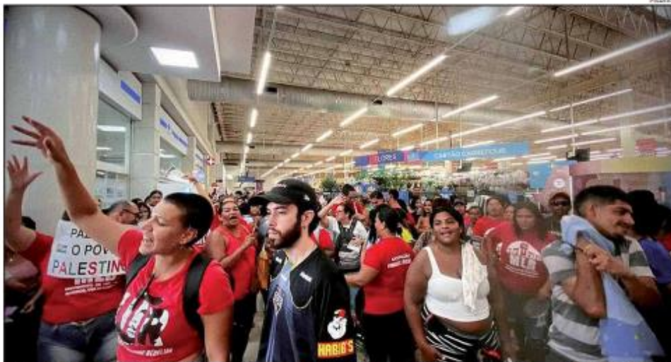
No último sábado, mais de 300 militantes vinculados ao MLB ocuparam loja do Carrefour na zona Norte, reivindicando alimentos

Entidades representativas do setor e do comércio reagiram e repudiaram a ocupação, ocorrida no último sábado e que contou com mais de 300 militantes vinculados ao Movimento de Luta nos Bairros, Vilas e Favelas (MLB), reivindicando doações de alimentos do estabelecimento. A Associação dos Supermercados do Rio Grande do Norte (Assurn) emitiu uma nota repudiando o ato e cobrou mais segurança para o comércio. Para a Associação, o ato é "uma lástima ver que essa ação tem se tornado recorrente no período de fim de ano. A Segurança Pública e demais au-