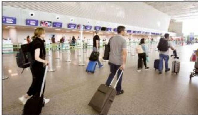
Se o impasse não se resolver logo, a Zurich diz que a previsão é de assumir a gestão do aeroporto somente em fevereiro ou março de 2024