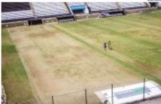
« ESTADO RECONSTRUÍVEL » Será de realizar uma reforma no estádio para 2026, o SCS iniciou a revitalização do gramado do estádio e espera poder usar o local para a Copa do RL. « PÁGINA 12 »