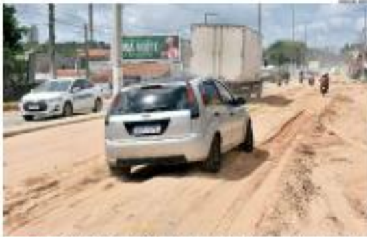
« PERIGO » Tráfego de veículos na Avenida João Manoel de Albuquerque, na zona norte de Natal, foi completamente interditado por um acidente de trânsito ocorrido nesta terça-feira. « PÁGINA 4 »