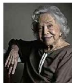
A atriz Nathalia Timberg

Desigualdade atrasa detecção do mal de Alzheimer em negros, diz estudo nos EUA