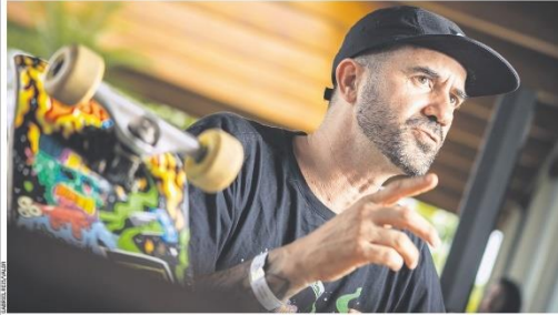
Aos 47 anos, o campeão de skate Bob Bernquist se divide entre o esporte, os negócios e o Instituto Skate Caixa, que atende a jovens carentes. "A molecadinha aprende a andar de skate, tem um direcionamento, comida. Tem o lado da atividade física, mas também é uma mentoria de vida". EU&