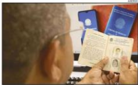
No trimestre encerrado em outubro, setor privado abriu 500 mil vagas com carteira assinada

Segundo Beringer, embora o aumento de carteira assinada tenha ocorrido consistentemente, esse crescimento não são "tan-