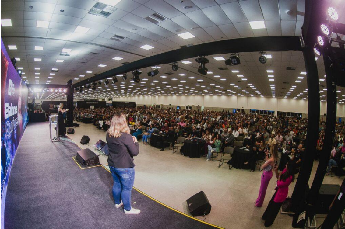
Arena de palestras – Foto: Divulgação

Além do alto nível de qualidade das palestras, todos os espaços foram desenhados para gerarem oportunidades de negócios. A Feira de Negócios e a Feira de Alimentação estarão cheias de empresas potiguares inovadoras, das quais seus serviços ou produtos resolvem a demanda de outras empresas, proporcionando assim uma rede de contatos e potenciais negócios, e impulsionando ainda mais o empreendedorismo e o comércio do Rio Grande do Norte. “Até a forma como dispomos os estandes na Feira de Negócios e Alimentação coopera para a interação dos participantes com todas as marcas expositoras, com conforto e praticidade”, enfatiza Jean.