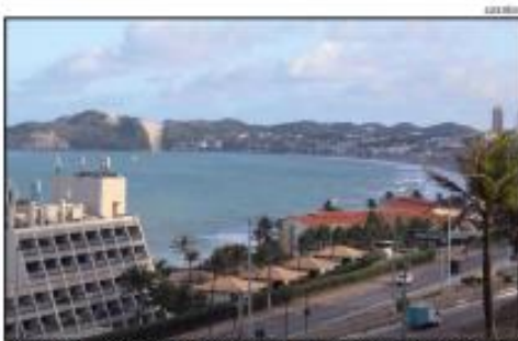
Hotel de RN dispõe de 35 a 40 mil leitos nos destinos de Natal, Pira, São Miguel do Gostoso e Galinhos