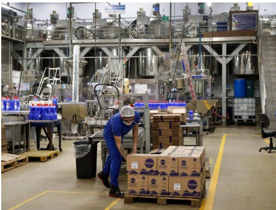
Rio Grande do Norte tem saldo de 2.257 empregos formais em outubro de 2023