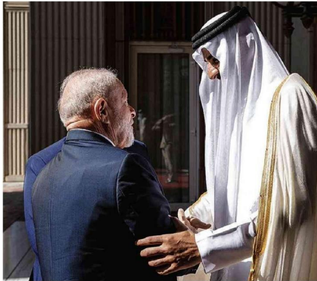
O presidente Lula se reúne com o emir qatari, Tamim bin Hamad al-Thani, em Doha, antes de ir à COP28.