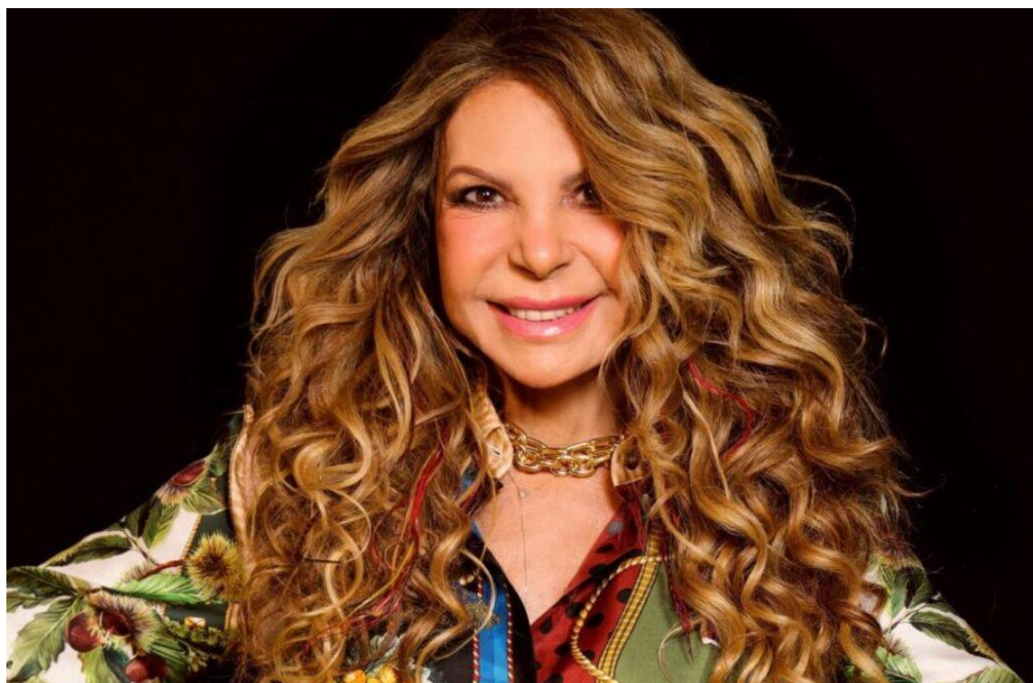
Elba Ramalho se apresenta e trio elétrico no dia 13 de dezembro.