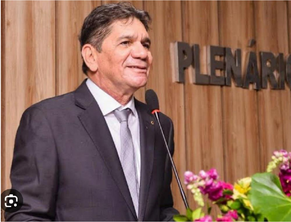
José Antônio Menezes, prefeito de Macau