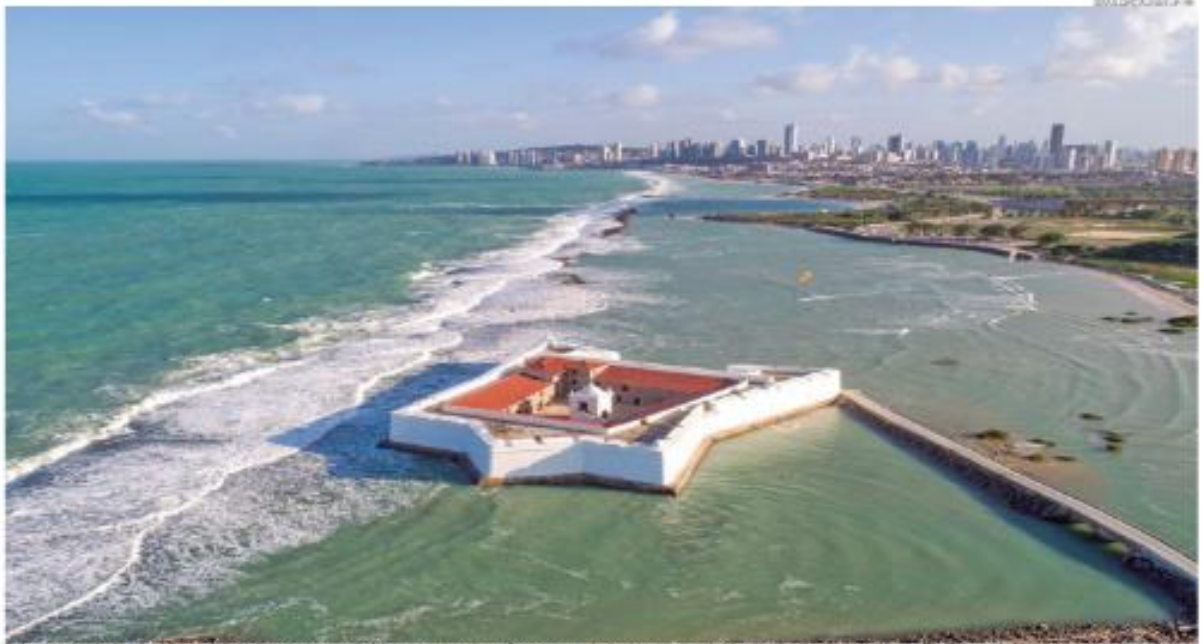
Beleza natural, localização, qualidade dos serviços, cultura e gastronomia estão entre as principais razões pelas quais os visitantes escolhem o Rio Grande do Norte como destino turístico