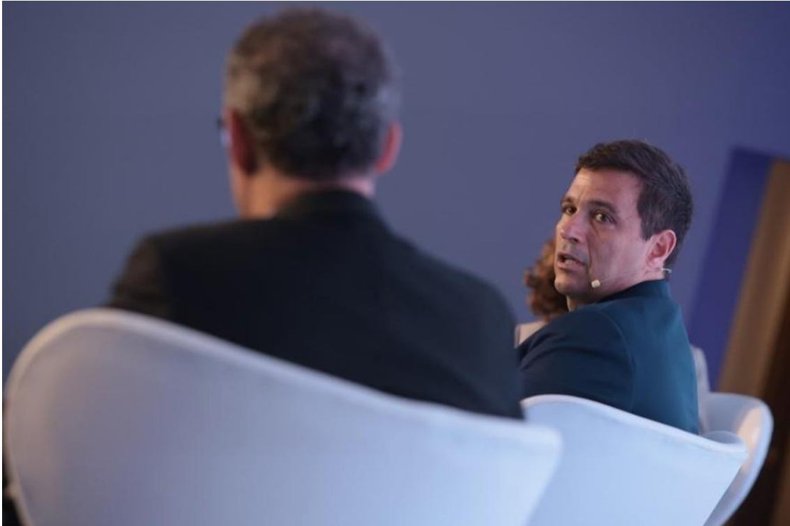
'E agora, Brasil?', Evento promovido pelos jornais O GLOBO e Valor Econômico tem como convidado o presidente do Banco Central, Roberto Campos Neto

Três anos após seu lançamento, já é possível dizer que o Pix superou as melhores das expectativas sobre sua adesão no país. Até agora são contabilizadas 66,1 bilhões de transações já feitas, movimentando R$ 29,5 trilhões. A adesão do meio de pagamento instantâneo surpreendeu até o atual presidente do Banco Central, Roberto Campos Neto. Ele falou sobre o sucesso e os desafios da plataforma, além de outros temas que tocam no desenvolvimento tecnológico do setor financeiro no país, na última sexta-feira ao longo do evento “E Agora, Brasil?”, realizado pelos jornais O GLOBO e “Valor Econômico”, com patrocínio do Sistema Comércio, através da CNC, do Sesc, do Senac e de suas Federações.