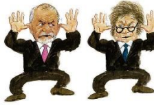
— Búúú pra você também!

Entrevistado entre Brasil e Argentina OH/4