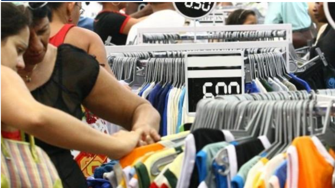
Atividade comercial foi estudada pelo IFC (Foto ilustrativa)

Celebrada sempre na última sexta-feira de novembro, a Black Friday - que em 2023 cai no dia 24 - é marcada pela oferta de grandes descontos e ajuda a impulsionar as vendas do comércio no último trimestre. Neste ano, de acordo com pesquisas conduzidas pelo Instituto Fecomércio RN (IFC), a data deve injetar R$ 332 milhões no varejo de Natal e R$ 71 milhões em Mossoró.