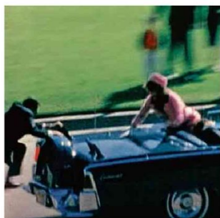
Em Dallas, a primeira-dama Jackie reage ao ataque a tiros contra o presidente Kennedy A.2 Zapruder 22.nov.1963/Reprodução

Ilustrada C1 Flip abre com ode a Pagu e foco em editoras e autores menos conhecidos