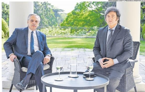
Presidente Alberto Fernández e o presidente eleito, Javier Milei, reúnem-se na residência oficial da Quinta de Olivos para discutir a transição

A dificuldade não é restrita ao Brasil e mesmo nos EUA muitos fundos têm problemas para encontrar uma porta de saída, a valores atrativos, das empresas em que investiram. Segundo a Associação Latino-Americana de Private Equity, de janeiro a setembro o volume financeiro movimentado por esses desinvestimentos foi de US$ 1,78 bilhão, queda de 78% em relação à igual período de 2022. Em todo o ano passado, o total chegou a US$ 16,1 bilhões. Página C1