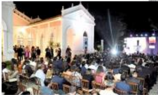
Salão Vila Verde recebeu a edição 2023 do Top Natal, que coronou as marcas mais lembradas.