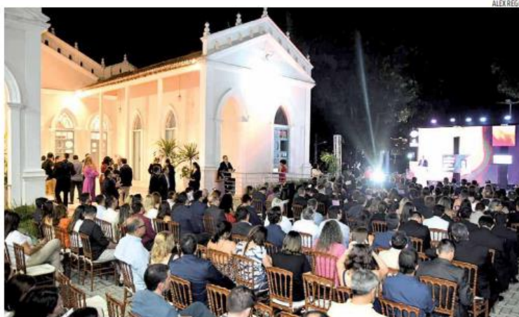
Solar Bela Vista recebeu a edição 2023 do Top Natal, que consagrou as marcas mais lembradas