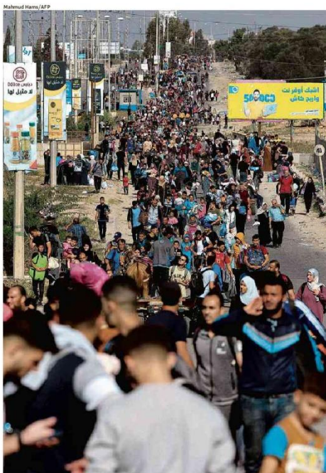
Palestinos fogem para o sul de Gaza; Israel fará pausas diárias nos bombardeios, dizem EUA