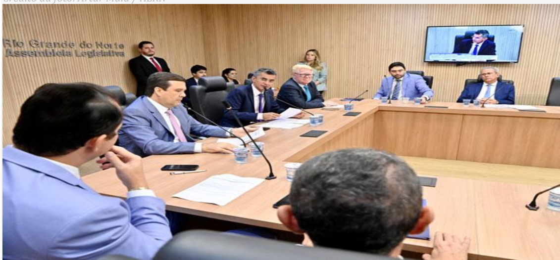
CCJ da Assembleia Legislativa aprovou a admissibilidade do projeto do Executivo estadual