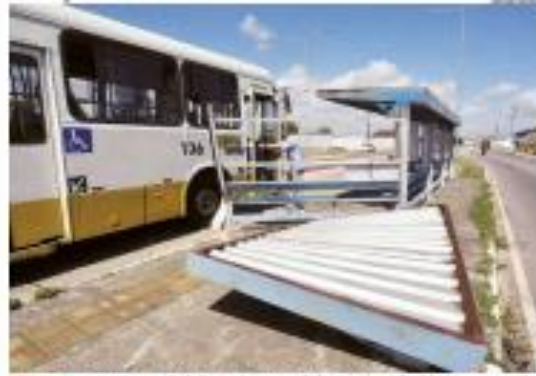
#Tribuna1 - Situação de paradas de ônibus em São Paulo. Provas técnicas mostram que a obra não tem prazo para conclusão. #Tribuna1