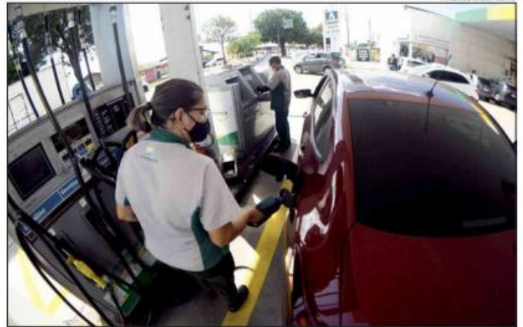
Decisão do Confaz eleva a alíquota de ICMS da gasolina de R$ 1,22 para R$ 1,3721, a partir de fevereiro

"Antes era cobrado 29%, mas com essa mudança, considerando o preço médio que está sendo cobrado em Natal, já vai representar próximo de 25%, ou seja, está se apro-