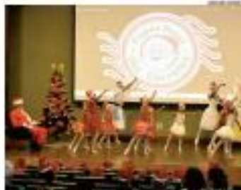
#Tribuna1 - A tradicional companhia Papai Noel dos Carreiros já está aberta. A expectativa é que cerca de 7 mil pedidos de entrega sejam feitos até o fim de ano. #Tribuna1