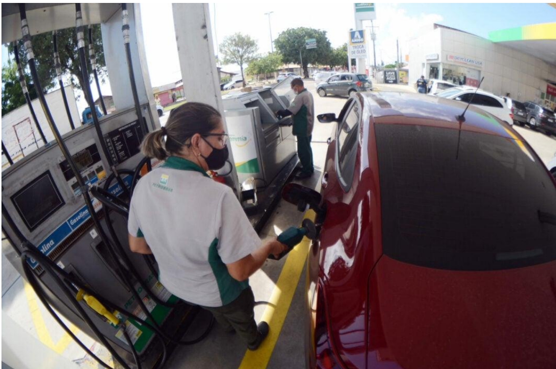
Quinta Feira, 27 de Maio de 2021/Natal/ Posto de Gasolina Repórter Milka Moura