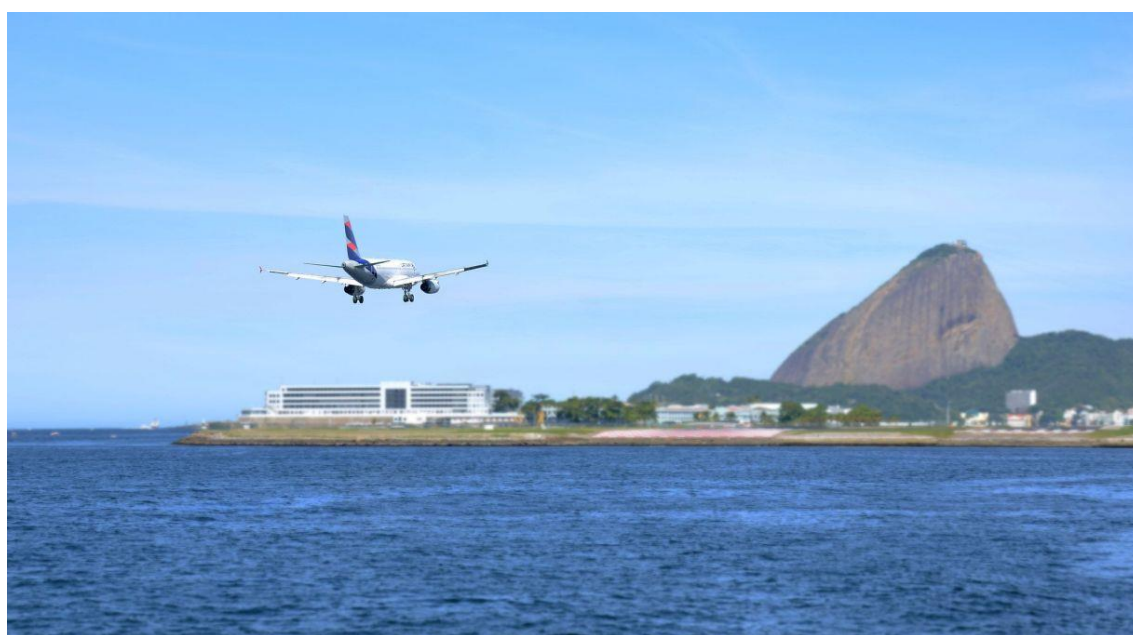
Avião pousa no aeroporto Santos Dumont, no Rio de Janeiro

Entre janeiro e agosto deste ano o faturamento do setor registrou R$ 12 bilhões a mais que o mesmo período de 2022