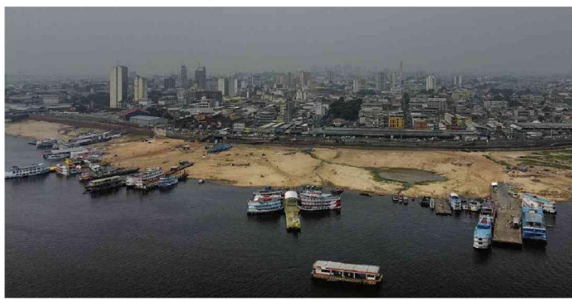
MANAUS VIVE MAIS UMA ONDA DE FUMAÇA, COM AR RUIM E POEIRA

ISSN 1614-7730 3 4 5 5 1 9 97114 13072032