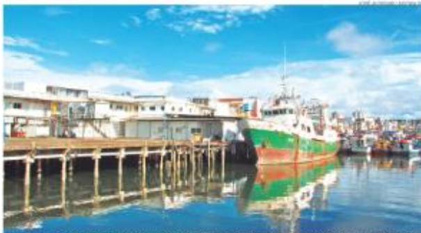
Carregamento de embarcação no Porto de Natal. Terminal não tem infraestrutura adequada, aponta estudo