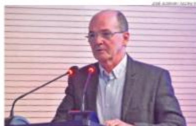
Secretário estadual de Infraestrutura, Gustavo Coelho, durante evento ontem

Em reunião no mês passado com o ministro dos Portos e Aeroportos, Síbio Costa Filho, Fátima ressaltou a prioridade que o projeto tem na política de desenvolvimento econômico do Estado, enfatizando sua relevância tanto a nível regional quanto nacional.