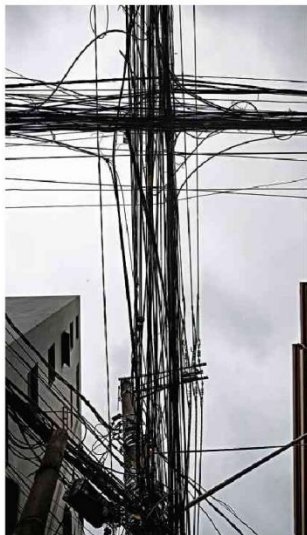
Emaranhado de fios elétricos e de comunicação suspensos na rua Cubatão, que fica na Vila Mariana (SP)

Exposição histórica 'Mão Afro-Brasileira' ganha reedição no MAM após 35 anos