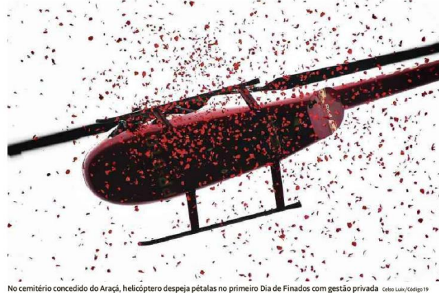
No cemitério concedido do Araçá, helicóptero despeja pétalas no primeiro Dia de Finados com gestão privada