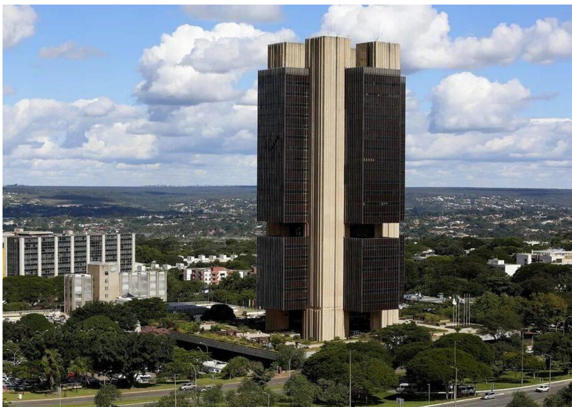
Brasil volta a ter a maior taxa de juros reais do mundo, mesmo após novo corte