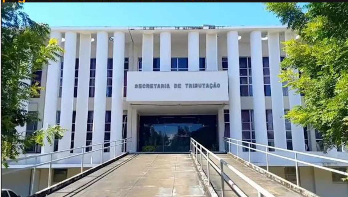
Sede da Secretaria de Fazenda do Rio Grande do Norte

O governo do Rio Grande do Norte prorrogou o prazo de adesão de pessoas e empresas ao Programa de Refinanciamento e Regularização Fiscal do Rio Grande do Norte (Refis), que iria originalmente até a terça-feira (31). O novo