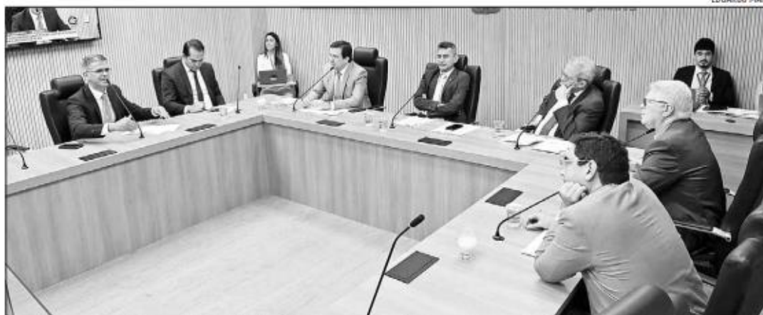
Adiamento na CCJ dará oportunidade às instituições do setor produtivo de participarem das discussões pela relevância da matéria