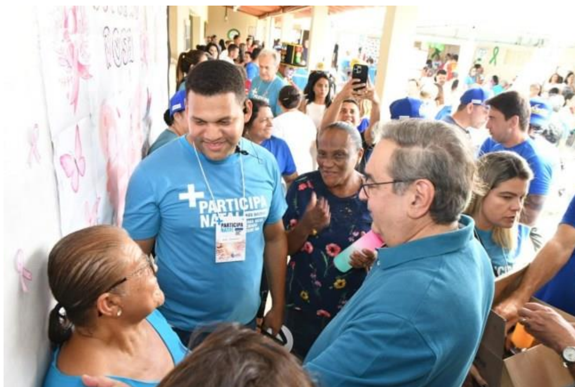
Participa Natal em Nova Natal

A quarta edição do Participa Natal nos Bairros em 2023 ocorreu neste sábado (21), na Escola Municipal Professor Amadeu Araújo, no Conjunto Nova Natal, na Zona Norte da capital. Ao todo, 5.266 pessoas puderam aproveitar os mais de 70 serviços oferecidos gratuitamente pela Prefeitura do Natal e por instituições parceiras. O projeto, que já beneficiou este ano os moradores dos bairros Pajuçara, Planalto e Rocas, está programado para acontecer pelo menos uma vez por mês, em bairros diferentes.