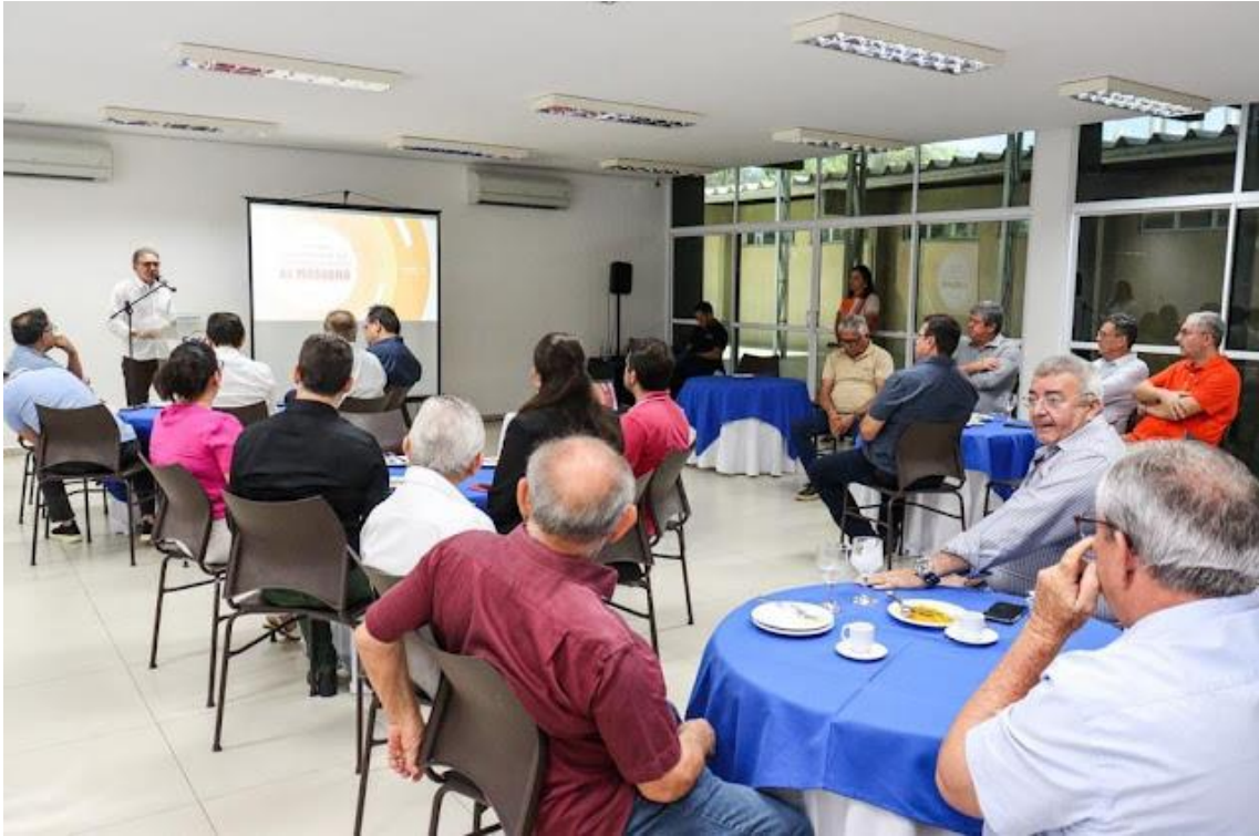
Entidade debate problemas e propostas, visando às eleições 2024