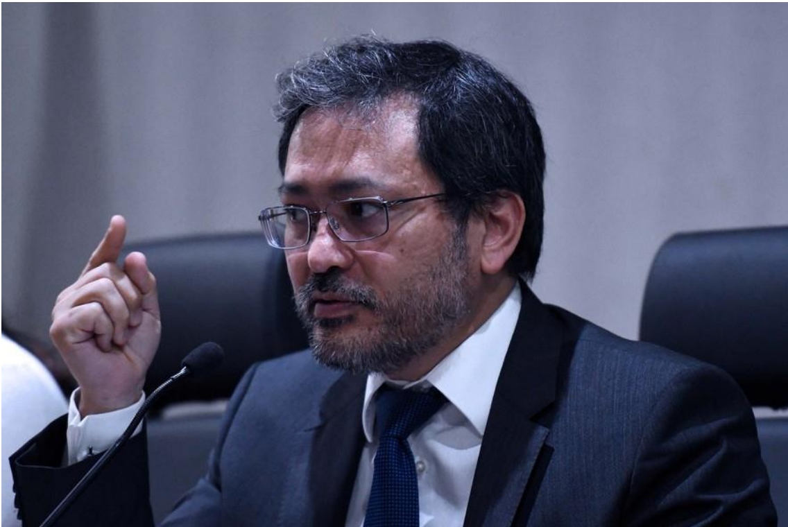
O secretário especial da Receita Federal, Robinson Barreirinhas

A mudança é vista como um dos resultados práticos do programa Remessa Conforme, criado para regularizar as importações de itens e bens no varejo on-line