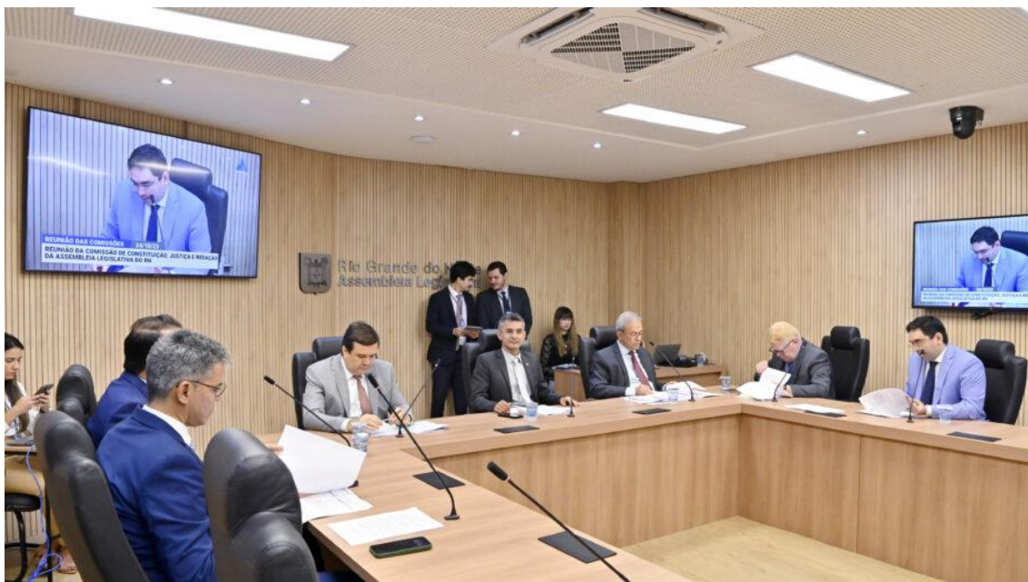
Reunião da CCJ da Assembleia Legislativa ontem - Foto: Eduardo Maia / ALRN

O Governo do Estado começou a enfrentar dificuldades para aprovar a proposta que mantém a alíquota-modal do ICMS em 20% por tempo indeterminado. O projeto começou a tramitar nesta terça-feira 24 na Comissão de Constituição e Justiça (CCJ) da Assembleia Legislativa, mas foi retirado de pauta após sugestão de alguns deputados que formam a comissão.