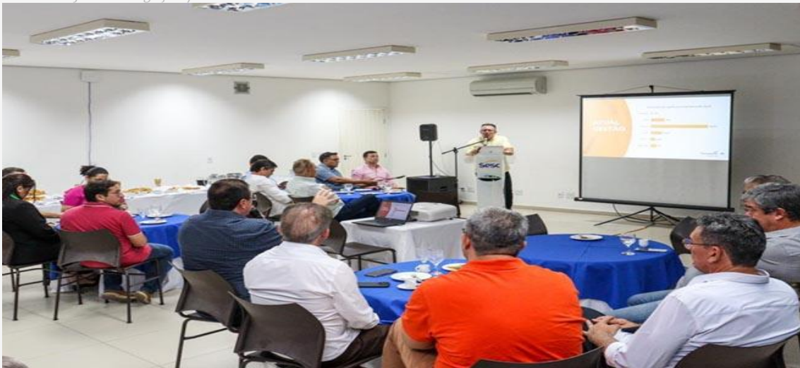
Debate foi realizado em Mossoró