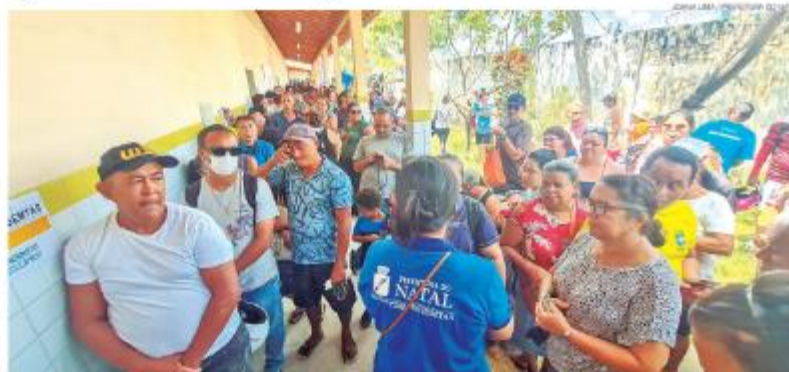
Iniciativa de gestão municipal, “Participa Natal” levou uma série de serviços essenciais para natalenses, e já atingiu a marca de quase 20 mil atendimentos

“O Participa Natal nos Bairros é uma iniciativa da nossa gestão que me enche de orgulho como gestor e a todos os servidores que se dedicam para que o melhor seja feito. As demandas da população estão sendo respondidas positivamente, e com o valioso apoio dos nossos parceiros