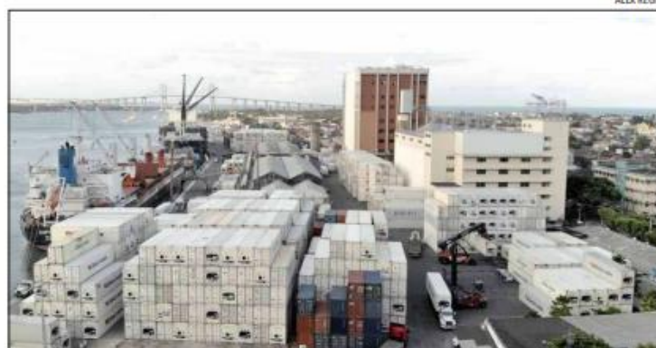
Os melões estão entre as mercadorias mais comercializadas com 252,5 mil toneladas exportadas

Somando os demais itens exportados no ano, o montante acumulado com as remessas internacionais em nove meses é 7,9% inferior ao verificado no mesmo