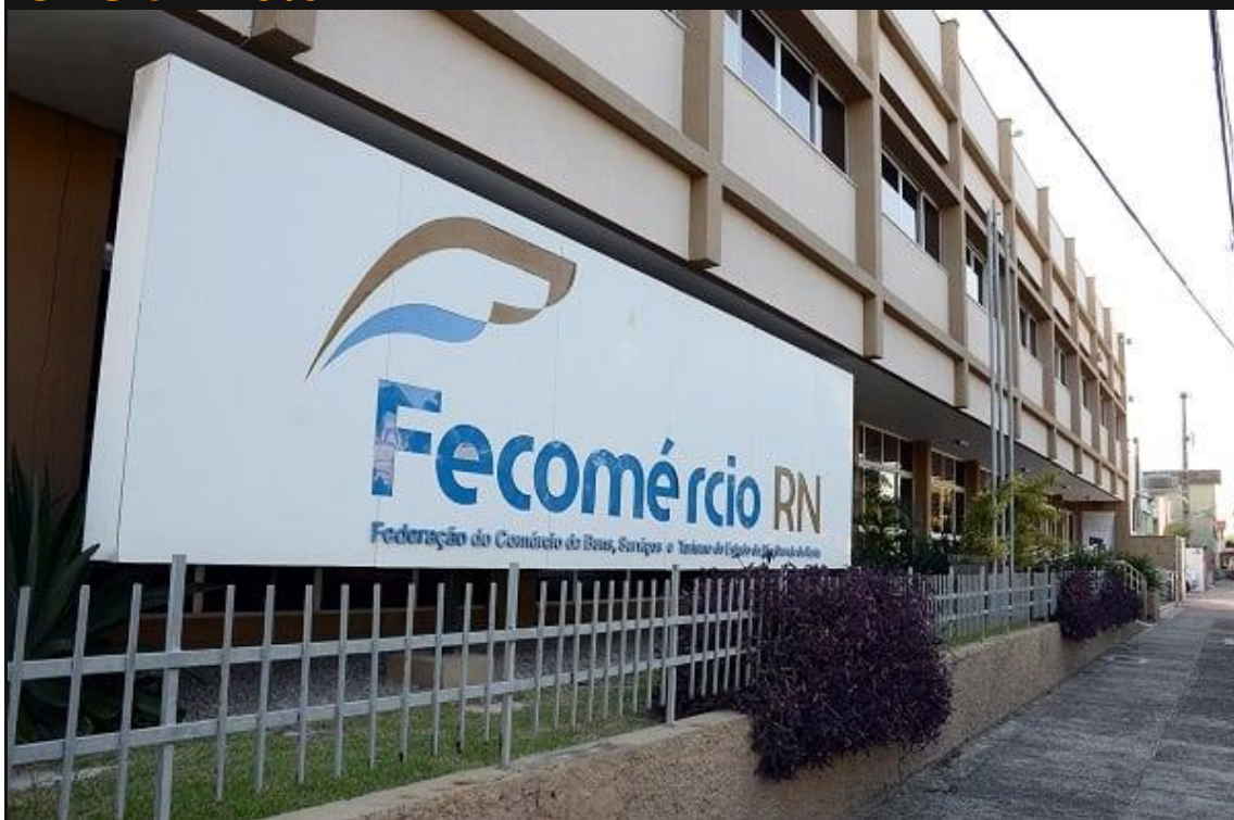
Fecomércio-RN repudia proposta de manutenção do ICMS em 20%

A Federação do Comércio de Bens, Serviços e Turismo do Rio Grande do Norte (Fecomércio-RN) repudiou, por meio de nota, na tarde desta quarta-feira (18), projeto de Lei enviado pelo Governo do Estado que mantém a alíquota do ICMS em 20%.