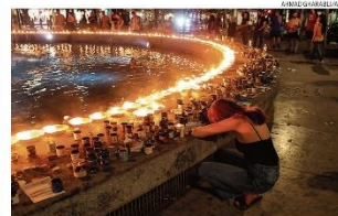
Sem consolo. Angustiadíssimos por reféns, israelenses homenageiam seus mortos

Visita de Biden a Israel é faca de dois gumes PÁGINA 18