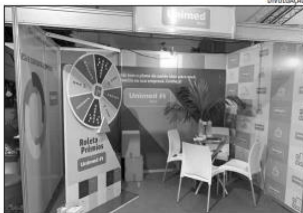
Visitantes poderão conhecer produtos e serviços da Unimed

“A Unimed Natal é hoje a maior cooperativa de médicos