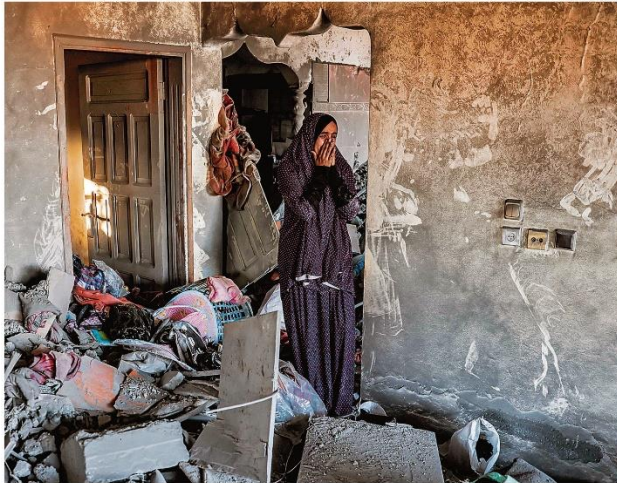
Perda total. O desespero de uma palestina ao constatar os estragos feitos por um bombardeio em Rafah, a cidade na fronteira sul de Gaza com o Egito

RIO DE JANEIRO, SEXTA-FEIRA, 20 DE OUTUBRO DE 2023 ANO XLIX - Nº 32.946 - PREÇO DESTE EXEMPLAR NO RJ - R$ 6,00