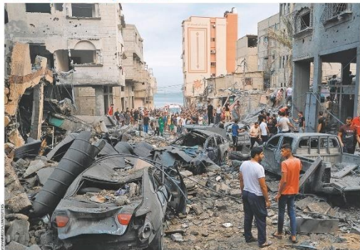
Palestinos observam ruínas no campo de refugiados de Bejai, na Cidade de Gaza, após bombardeio israelense. Em vídeo divulgado pela emissora de TV Al-Jazeera, do Catar, o grupo terrorista Hamas disse que

executaria um refém israelense a cada ataque aéreo realizado sem aviso prévio. Segundo analistas, o eventual assassinato de reféns colocaria em xeque o governo de Benyamin Netanyahu, o mais à