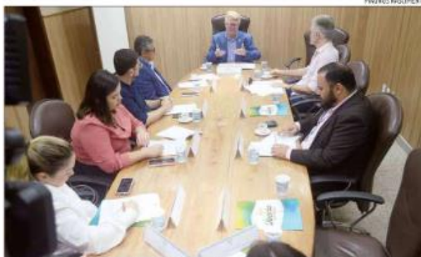
Comissão Multidisciplinar teve primeira reunião para discutir a revitalização do centro de Natal

A reunião iniciou com a leitura de um relatório fruto da audiência pública realizada no último dia 26 de setembro na ALRN, destacando oito eixos prioritários para a Cidade Alta, como a realização de um diagnóstico preciso do estado atual do centro de Natal; criação de programas de incentivos fiscais para o bairro; desenvolvimento de ações promocionais para destacar o Centro como polo turístico e cultural; viabilização de um programa de adensamento populacional; investimento na regis-