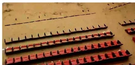
Teatro Municipal de Caieiras (SP) com poltronas submersas em água e lama.

Dois homens morreram na zona sul paulistana após carro capotar e cair em córrego que transbordou. Em oito dias, já choveu 65% mais que a média da capital em outubro. B2