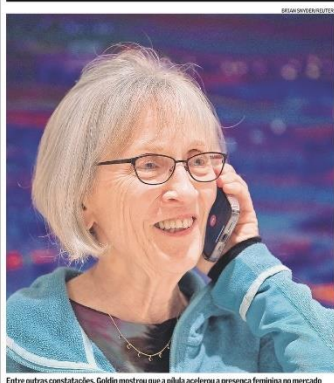
Entre outras constatações, Goldin mostrou que a pilha acelerou a presença feminina no mercado

A Brookfield colocou à venda sua participação de 26,5% na empresa logística VLI — concessionária da Ferrovia Centro Atlântica (FCA), que também tem como sócios a Vale (29,6%), o FI-FCIS (15,9%), o grupo japonês Mitsui (20%) e o BNDES-Par (8%). A falta da gestora canadense — que comprou parte das ações da Vale na empresa há dez anos — é avaliada entre R$ 2,5 bilhões e R$ 3 bilhões. O CRI foi contratado para assessorar a operação. Fontes a par do assunto disseram que a Brookfield busca vender sua parte na companhia por considerar o investimento já maduro. Potenciais compradores seriam outros fundos, como os também canadenses Caisse de Dépôt et Placement du Québec (CDPQ) e Canada Pension Plan (CPP), além de fundos soberanos de outros países. Procuradas, a Brookfield e CRI não fizeram comentários. Página B1