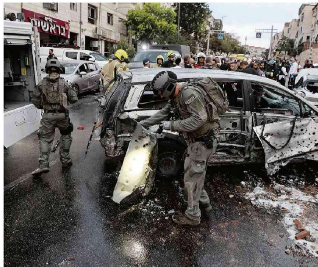
Policial e socorristas israelenses inspecionam local atingido por foguetes do Hamas em Beitur Illit, na Cisjordânia.

O Brasil recebeu licença para remover cerca de 900 cidadãos até sábado. O voo que traz os primeiros resgatados deve pousar em Brasília amanhã. Mundo A11 e A12 'Me esparramei sobre corpos', diz brasileiro que sobreviveu a massacre A12