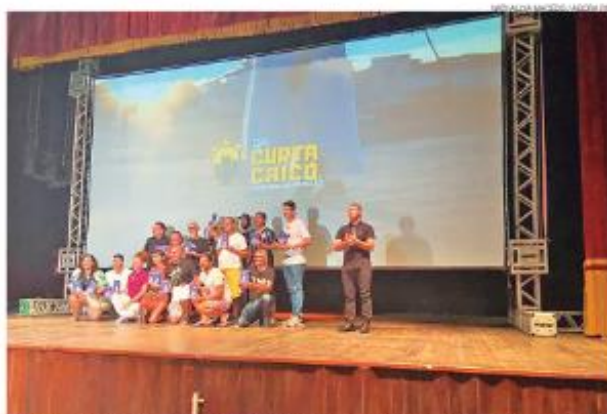
Cerimônia de premiação do 6º edição do Curta Caicó aconteceu no último domingo 8, no Centro Cultural Adolfo Dias