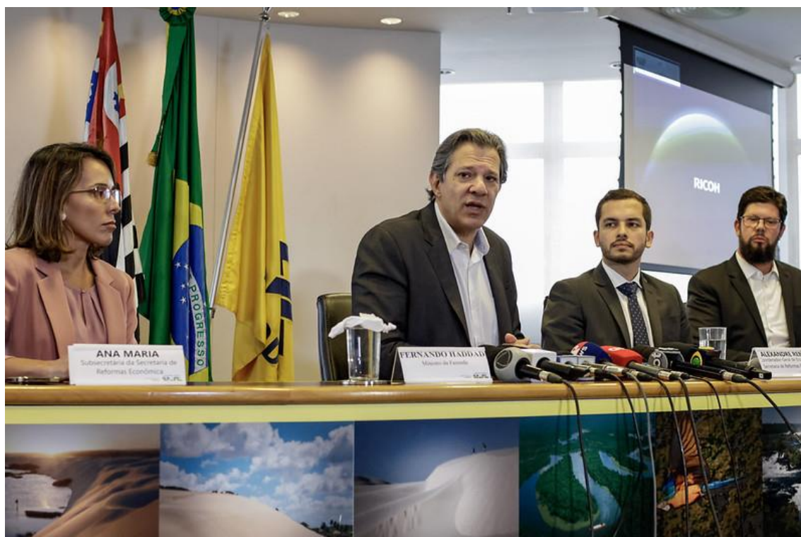
O ministro Haddad dá entrevista coletiva para falar da nova etapa do Desenrola Brasil

Nova etapa do programa começou nesta segunda-feira (9/10) e vai beneficiar pessoas que ganham até dois salários mínimos ou que estejam inscritas no CadÚnico. São R$ 126 bilhões em descontos para cerca de 32 milhões de brasileiros