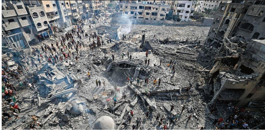
Contraofensiva aérea. A Mesquita de Soussi, no campo de refugiados de Al-Shati, no norte da Faixa de Gaza, foi totalmente destruída em bombardeio de Israel. Mortes do lado palestino já ultrapassaram as 600, incluindo civis

RIO DE JANEIRO, TERÇA-FEIRA, 10 DE OUTUBRO DE 2023 ANO XXXI - Nº 32.936 - PREÇO DESTE EXEMPLAR NO RJ - R$ 6,00