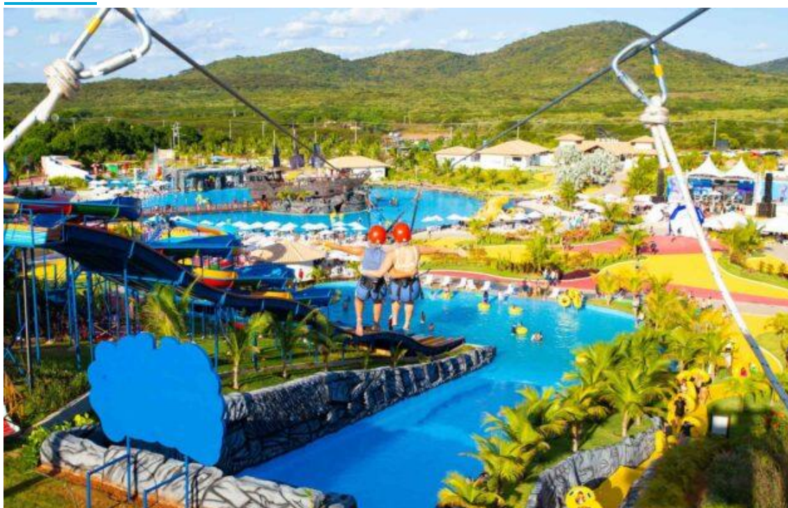
Parque aquático o West Aqua Park localizado em serra de Martins.

Passeios acontecem ainda este mês e as vendas iniciam na quarta-feira, dia 11, com valores diferenciados para credenciados Sesc em todas as categorias.