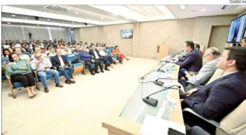
Audiência pública na AL teve o objetivo de levantar a pauta da ZPE de Macaíba junto aos deputados estaduais e à bancada federal do RN

A reportagem da TRIBUNA DO NORTE perguntou se existe uma peça para finalização dos encaminhamentos, mas o parlamentar não especificou uma data fechada e assegurou que o relatório será montado "o mais rápido possível". "Em 15 de dezembro de 2022 a concessão [da ZPE de Macaíba] foi extinta. Então o que queremos é que essa mesma concessão, válida por decreto, seja sancionada pelo presidente Lula (PT). Sendo sancionada, abre-se uma nova etapa para que sejam instaladas empresas na ZPE para gerar emprego e riqueza para o Rio Grande do Norte", esclarece. Ainda, de acordo com ele, serão feitos esforços para buscar recursos por meio de emendas parlamentares para a ZPE.