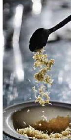
Prova de queijo avaliou dez marcas.

Metade das marcas de queijo ralado é salgada demais, aponta degustação