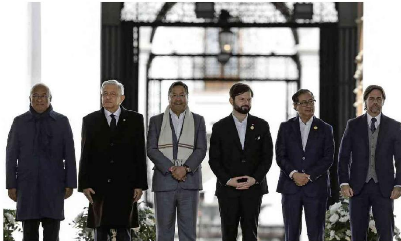
Da esq. para a dir., o premiê António Costa (Portugal) e os presidentes Andrés Manuel Lopez Obrador (México), Luis Arce (Bolívia), Gabriel Boric (Chile), Gustavo Petro (Colômbia) e Luis Lacalle Pou (Uruguai) na cerimônia; Lula enviou os ministros Dino (Justiça) e Sílvia Almeida (Direitos Humanos).

Presidente. Putin deve ser preso se vier ao Brasil. A10