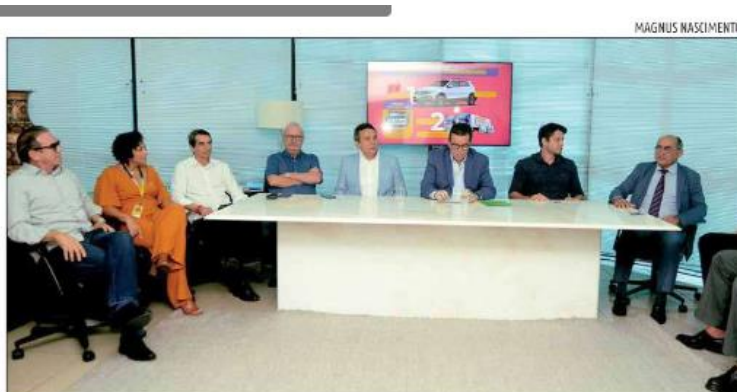
No lançamento do Liquida, dirigentes lojistas destacaram que a iniciativa deve aquecer o comércio