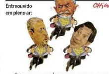
Entrevistado em pleno ar: CH/68

O Congresso receberá hoje a proposta orçamentária de 2024. Com meta de déficit zero, o governo estima que precisará aumentar as receitas em R$ 168 bilhões. PÁGINA 18