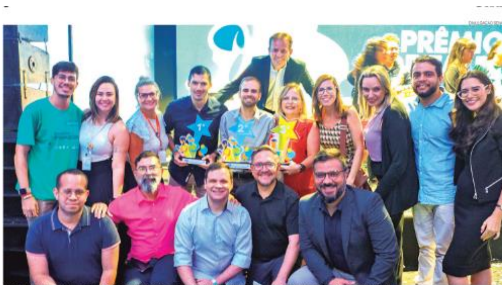
A cerimônia de premiação foi realizada na sexta-feira 25, no HIT - Hub de Inovação e Tecnologia do Senac RN e reconheceu as melhores práticas inovadoras.

Os projetos premiados em 1º lugar de cada categoria da etapa estadual serão submetidos para a avaliação da etapa nacional