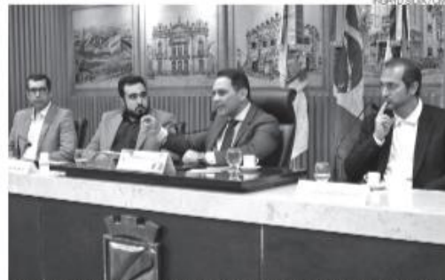
Perfil comum das vítimas e de pessoas que não costumam acessar a internet