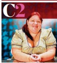
HELVIO ROMERO/ESTADÃO - 24/8/2014

José Pastore ... B14 Os problemas da nova contribuição sindical