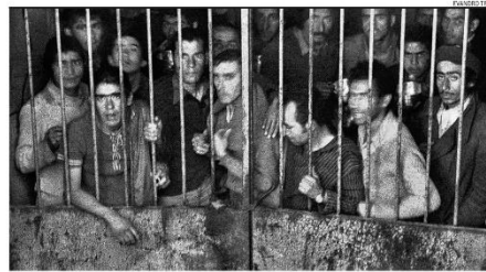
Memória. Presos políticos em estádio de Santiago; tortura e morte de opositores marcaram ditadura militar

Levantamento de entidade agropecuária revela que movimento dos sem-terra fez ao menos 66 ocupações neste ano, contra 62 durante o governo Bolsonaro. CPI do MST adiou entrega do relatório. PÁGINA 6