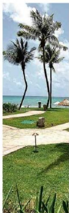
Maroma, hotel mexicano com vista para o mar do Caribe.

Rodeios e sertanejos lucram juntos em fenômeno que tem até alta temporada