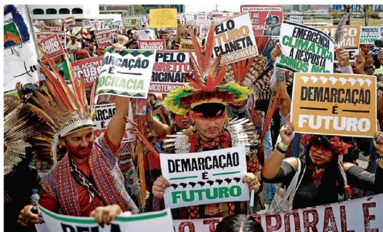
Indígenas de várias etnias marcham na Esplanada dos Ministérios até o Supremo, para acompanhar a sessão do julgamento do marco temporal.

Serão três pilares: recomposição da base fiscal e correção de distorções; isonomia tributária e combate a abusos; e nova relação com o Fisco. Mercado A15