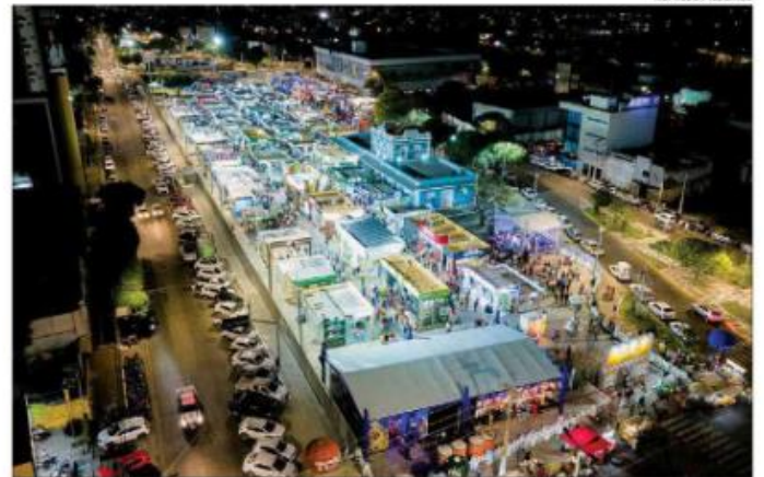
Expofruit encerra hoje com exposições e debates. Previsão é movimentar R$ 80 milhões nos três dias