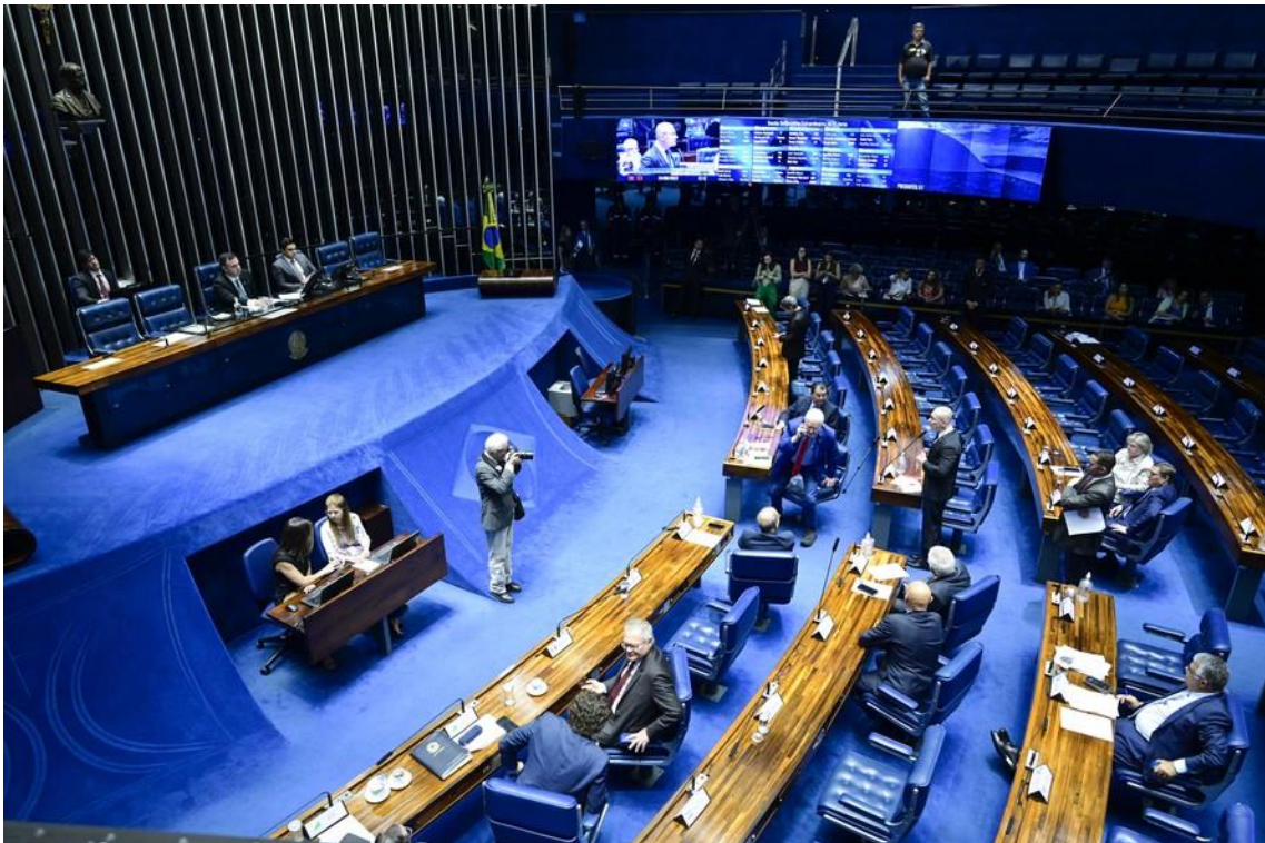
Plenário do Senado vota MP de reajuste do mínimo