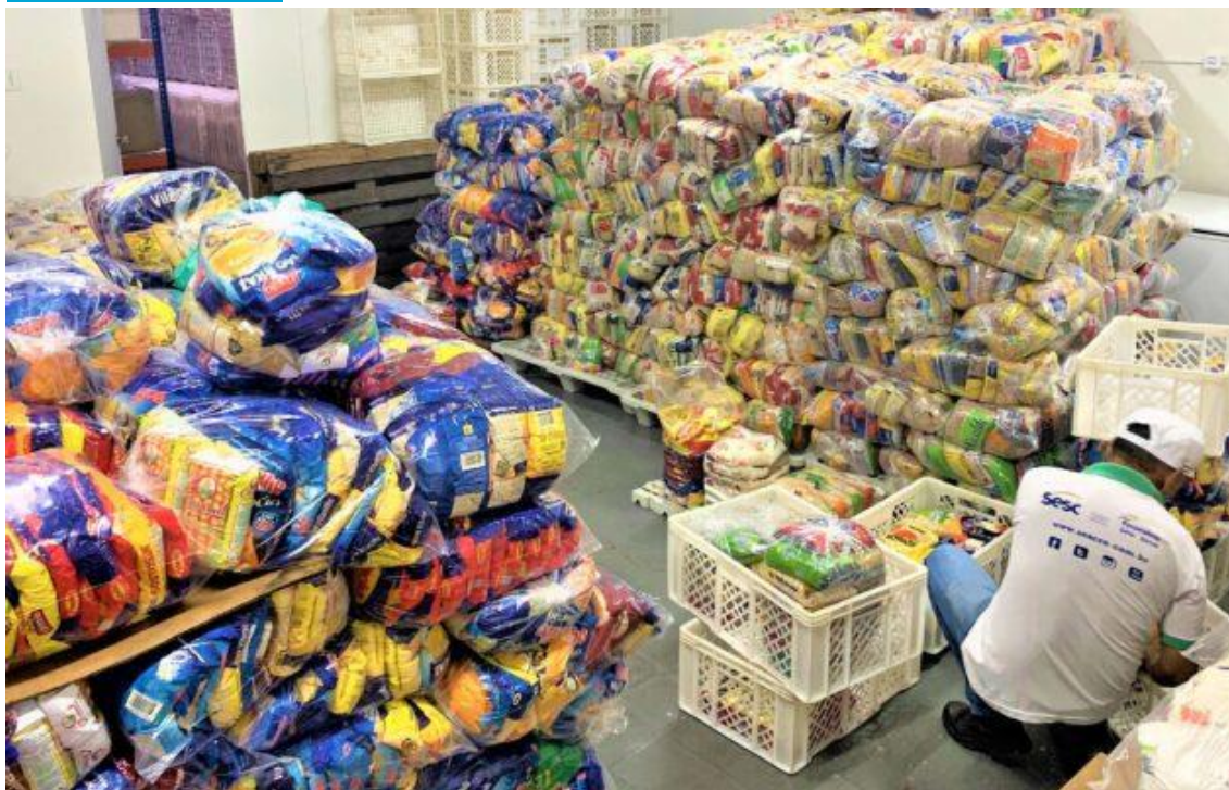
Mesa Brasil Tardezinha.

Alimentos estão sendo catalogados e em breve estarão em rota de doação do programa social do Sesc, podendo chegar a mais de 25 mil potiguares