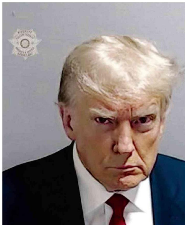
O ex-presidente Donald Trump é fotografado ao ser fichado em unidade prisional da Geórgia (EUA)