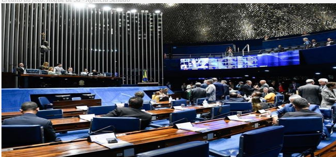
Plenário do Senado da República