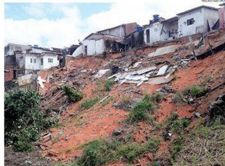
« CADS » Parte de seis casas desabaram no bairro de Neópolis, em Natal. Defesa Civil diz que baixo risco havia sido identificado, e espera identificar o que causou dano em uma semana. « PÁGINA 8 »