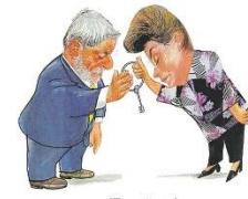
— "Tamo junto!"