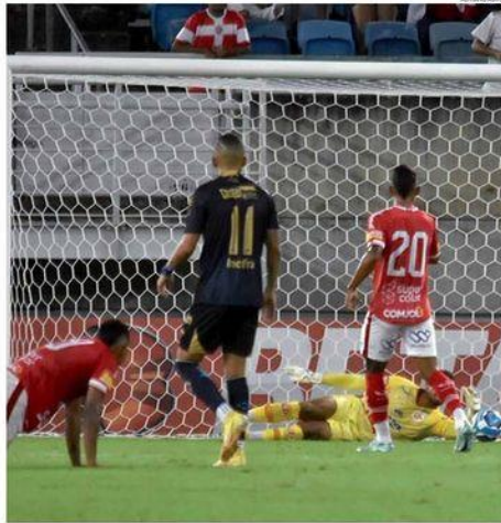
« SÉRIE C » Numa partida bem disputada, os dois goleiros se destacaram e seguraram o 0 a 0 no placar entre América e Aparecidense. Agora, o Alvirubro só se salva se bater o Floresta. « PÁGINA 12 »