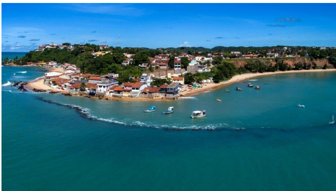
Baia formosa - Foto: Giovanni Dji