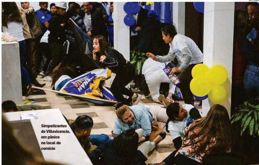
Simpatizantes de Villavicencio, em pânico no local do comício

Quinta-feira 10 de AGOSTO de 2023 • R$ 6,00 • Ano 144 • Nº 47413 estado.com.br