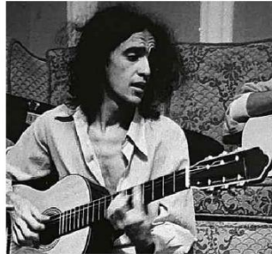
Caetano em 1971 durante gravação de 'Transa' em Londres, onde viveu após ser expulso pela ditadura

Thiago Amparo Para a criança preta periférica, esperança é permanecer viva Opinião A2