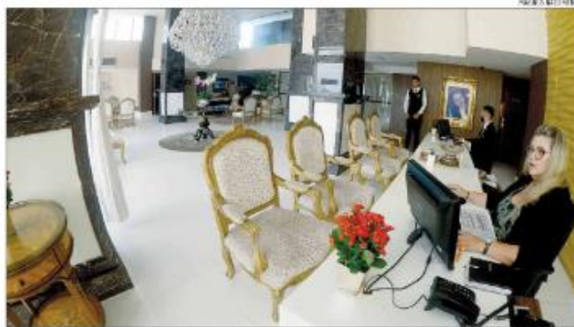
Alguns hotéis, segundo dados da ABIH/RN, registraram "impressionantes 10%" de ocupação durante os dias de baixa estação