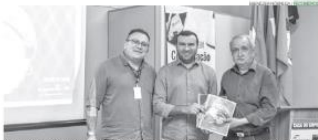
Eventos festivos realizados na cidade de Macaíba se mostram importantes para a impulsionar a economia local