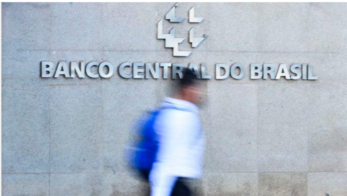
Fachada do edifício-sede do Banco Central, em Brasília

Em julho, 74% dos especialistas consultados pela autarquia avaliaram que o corte da taxa básica de juros seria de 0,25 p.p.