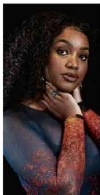
Iza, que lança o álbum 'Afroditi'

Em seu segundo álbum, "Afroditi", que chega às plataformas, a cantora Iza encarna um ser inspirado na divindade grega do amor e entoa com fúria as dores de uma separação.