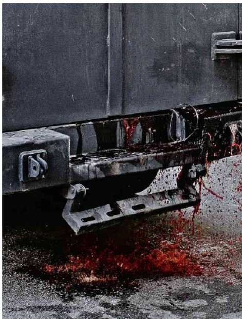
CAVEIRÃO DERRAMA SANGUE DIANTE DE HOSPITAL NO RIO Blindado da PM parado em frente ao hospital Getúlio Vargas traz corpos de dois homens mortos em operação na zona norte do Rio, na quarta (3), que deixou ao menos dez vítimas.