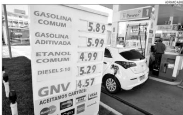
O setor de combustível está entre os que respondem pelo maior impacto no recolhimento do ICMS

A redução na arrecadação de ICMS fez com que vários estados promovessem projetos de lei para aumentar o imposto em outras áreas, como forma de compensar a perda na arrecadação, como foi o caso do RN.