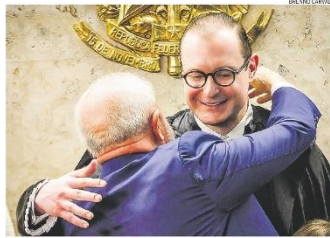
Confiança. Lula cumprimenta seu ex-advogado e novo ministro do STF após a posse

O ministro Cristiano Zanin tomou posse ontem no Supremo Tribunal Federal em cerimônia simples, breve e concorrida, sob a expectativa de se tornar o principal interlocutor do presidente Luiz Inácio Lula da Silva, seu amigo e ex-cliente, com a Corte. Com sua chegada, sete dos 11 ministros do STF foram indicados pelos governos do PT. PÁGINA 6