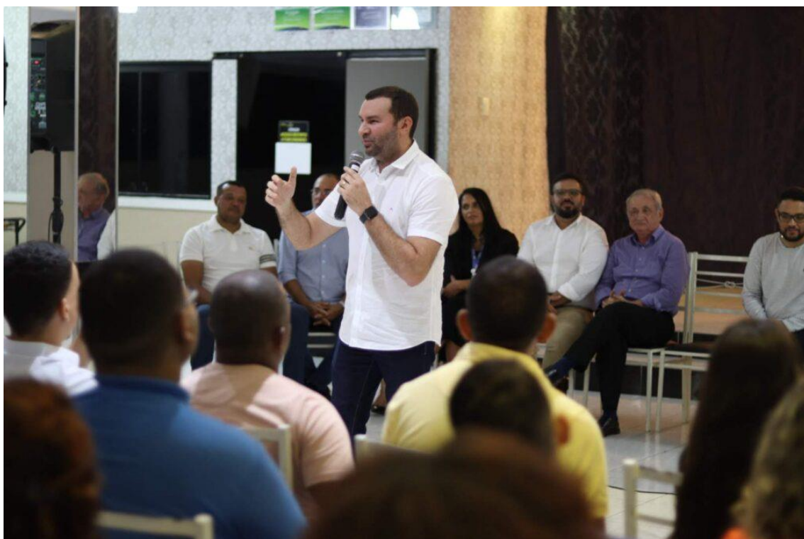
Prefeito de Macaíba Emídio Júnior – Foto: Edeilson Moraes

aprenderam mais um profissão, mais uma arte”, comentou o Prefeito Emídio Jr.