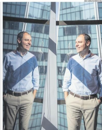
Leichtenberg: "Se eu estivesse lá [no Copom], não cortaria 0,5 ponto de jeto nenhum"

As novas regras de tributação de preços de transferência deverão elevar as receitas em outros R$ 25 bilhões. Aprovadas pelo Congresso, elas ainda precisam ser regulamentadas, determinando mudanças na taxação de transações entre companhias do mesmo grupo em países diferentes, fechando "brechas" para a redução do pagamento de impostos. Outras medidas incluem a tributação das apostas esportivas on-line, dos fundos exclusivos e fundos no exterior.