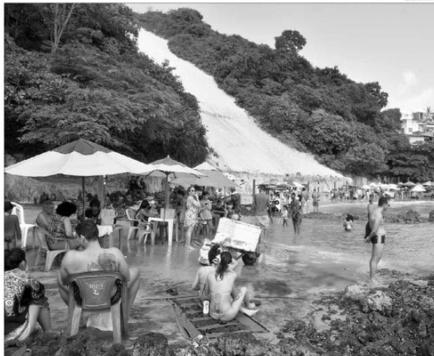
A obra de engorda da praia de Ponta Negra é considerada fundamental para a preservação do Morro do Careca

Mesquita disse estar otimista em relação ao andamento dos processos. Ele acredita que até o final de fevereiro do próximo ano, a LIO será emitida. "Levando em conta essas considerações, nós avaliamos começar a