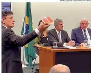
« CPI DO MST » Deputados federais levaram pedaços de melancia em provocação ao ex-ministro do GSI, Gonçalves Dias, que depois ontem, ironia é em alusão aos militares defensores do comunismo. « PÁGINA 5 »

Ano 73 • Número 092 • Quarta-feira, 02 de agosto de 2023