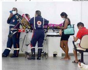
« LOTADO » A Justiça deu um prazo de 72 horas para que a Sesap apresente informações acerca das medidas adotadas para esvaziar os corredores do Hospital Walfredo Gurgel. « PÁGINA 9 »