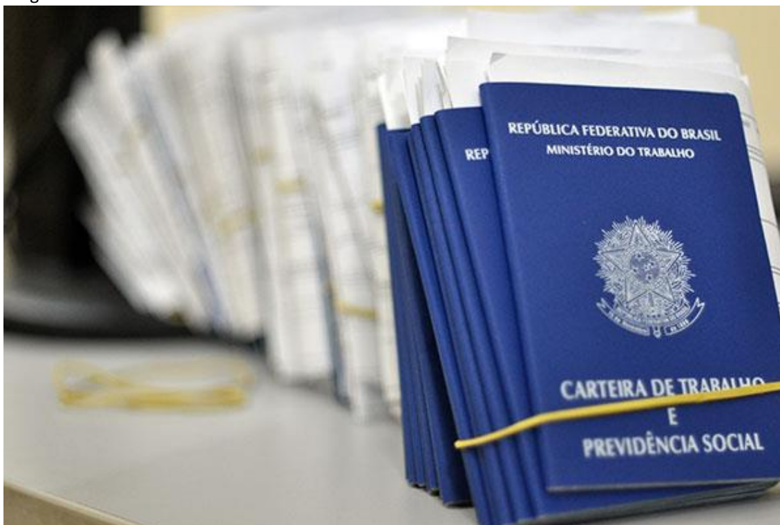
Carteira de Trabalho