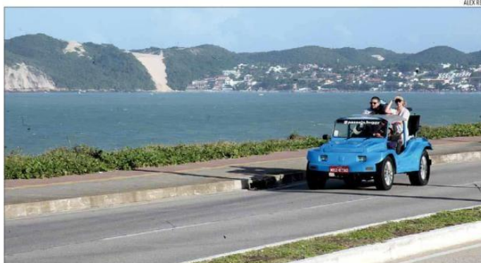
RN foi o terceiro estado do Nordeste que mais recebeu turistas nesse primeiro semestre do ano, abaixo apenas da Bahia e PE