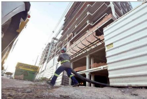
A construção é o segundo setor, no País e no Estado, que mais está abrindo empregos formais