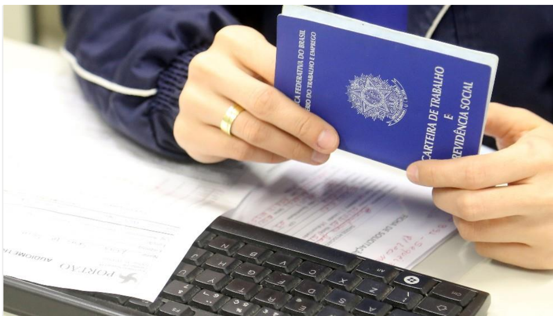
Carteira de Trabalho

Em comparação ao mesmo período de 2022, no entanto, há uma queda de 36% no número de empregos formais criados no período.