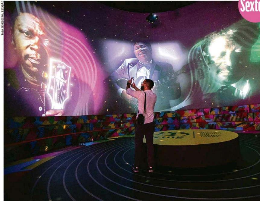
Sobre um enorme disco de vinil, visitante registra imagens do único nome de fato planetário produzido pelo blues desde sua origem

Sexta-feira 28 de JULHO de 2023 • R$ 6,00 • Ano 144 • Nº 47400 estado.com.br