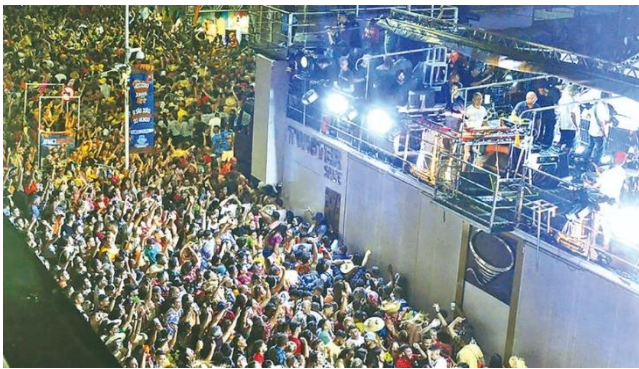
Festas tradicionais no Rio

Grande do Norte, os São João de Assú e Mossoró movimentaram cerca de R$ 375 milhões neste ano, segundo a Federação do Comércio de Bens, Serviços e Turismo do Estado do RN (Fecomércio RN) . Na capital do oeste, o faturamento mais do que dobrou em relação ao ano passado, enquanto em Assu houve crescimento na casa dos 16%. Outro fator que também foi destacado foi o nível de satisfação. Mais de 95% das pessoas que participaram do São João 2023 nos municípios de Assú e Mossoró pretendem voltar para as edições do ano que vem.