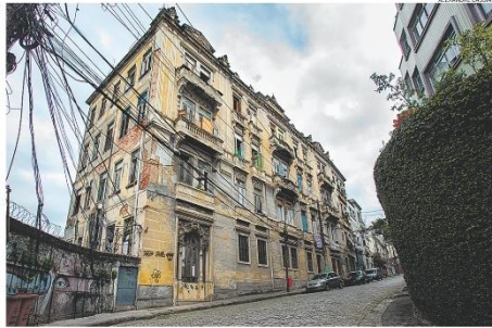
Revitalização. O Hotel dos Ingleses, no Rio, hoje ocupado por 60 famílias, é um dos imóveis mapeados pelo governo.

O governo federal prepara o lançamento do programa Democratização dos Imóveis da União, pelo qual vai destinar prédios, galpões, construções históricas e terrenos, muitas vezes abandonados ou ocupados, ao uso social. De acordo com o Ministério da Gestão, 500 unidades país afora já foram mapeadas para serem utilizadas como moradia popular e equipamentos de saúde pública, educação e atividades culturais e esportivas, até o fim de 2026. A ministra Esther Dweck afirma que os imóveis poderão ser entregues a prefeituras, famílias de baixa renda, movimentos sociais ou mesmo ao setor privado, em esquema de venda ou permuta. A maioria das unidades está localizada em quatro estados: Rio de Janeiro, São Paulo, Pernambuco e Pará. Prefeituras demonstram interesse na iniciativa e fazem planos, muitos atrelados à revitalização de áreas centrais e portuárias. PÁGINA 11