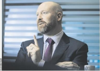
Com o início dos cortes na Selic e a maior estabilidade pública, o Brasil será um dos mercados mais atraentes nos próximos 12 a 18 meses, diz Todd Jablonski, da Principal Asset. Página C3