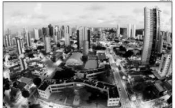
Zona leste da capital tem empreendimentos já licenciados, com construção prevista para este ano