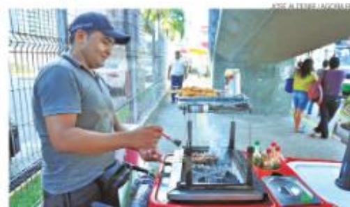
Em 2022, foram mais de 10 mil novos negócios criados, em 2023, número não chegou a 4 mil

O MEI paga apenas um valor fixo mensal, que equivale a cerca de 5% do salário-mínimo vigente, e ainda o empreendedor recebe seguridade social e benefícios, como aposentadoria, auxílio maternidade e auxílio-doença. O registro já garante um número no Cadastro Nacional de Pessoas Jurídicas (CNPJ) e com isso a possibilidade de emitir nota fiscal, participar de licitações públicas e contratar até um empregado com carteira assinada.