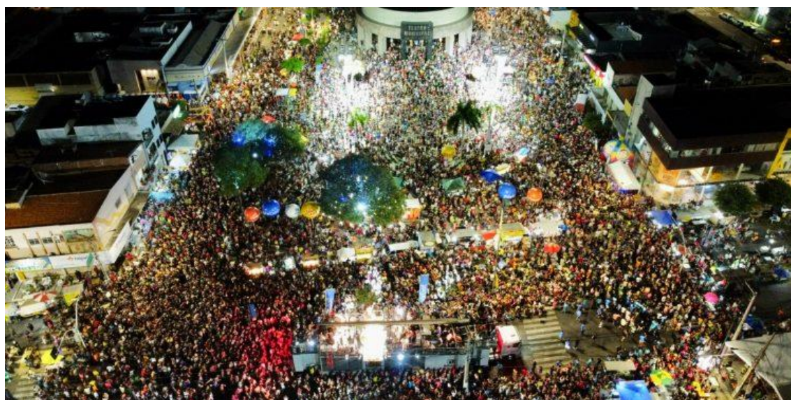
MCJ 2023.

De acordo com pesquisa da Fecomércio, a cada R$ 1 investido pela Prefeitura, R$ 24 voltaram para o município.