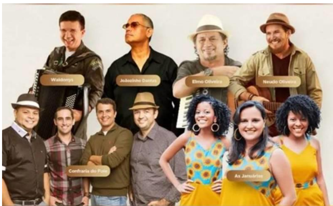
Parte das atrações foram contratadas com os recursos da emenda