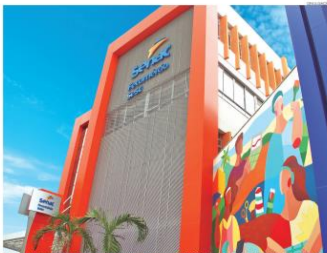
Senac tem opções de capacitação gratuita nas modalidades presencial e EAD, com bolsas para Natal, Mossoró, Caicó e Assu.

O estudo será apresentado no 7º Encontro Mulheres que Marcam, evento que reunirá mais de mil mulheres, no Teatro Blachuelo, no dia 16. O objetivo da pesquisa foi verificar diferentes aspectos relacionados ao empreendedorismo feminino no RN, como perfil das empreendedoras, experiência, desafios enfrentados, acesso a oportunidades, participação em redes de apoio, entre outros.