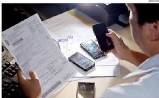
Programa Desenrola estimula a renegociação de débitos e o retorno do crédito para o consumidor

Na avaliação da Federação do Comércio de Bens, Serviços e Turismo (Fecomércio) do Rio Grande do Norte, o programa é positivo para o setor produtivo e apresenta capacidade de amplificação de resultados a nível local. Isso porque, em Natal, os percentuais de endividamento (88,2%) e inadimplência (48,6%) superam as médias na-