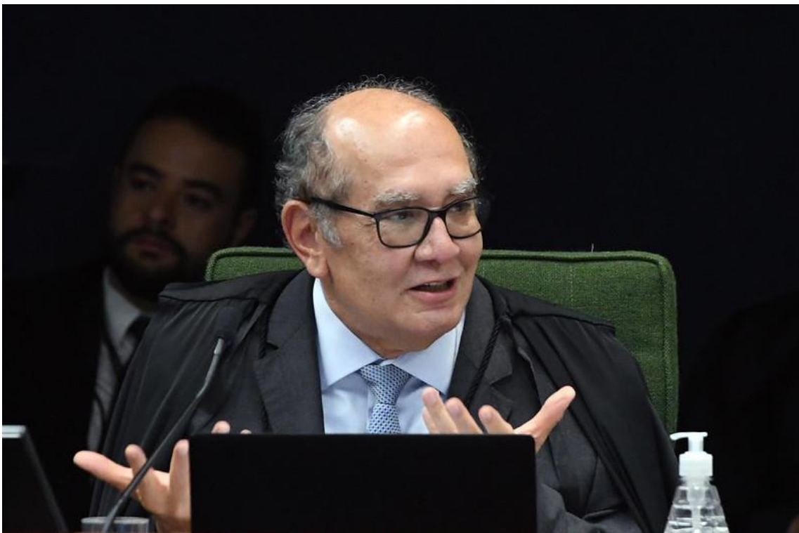
Gilmar reforçou entendimento do STF ao declarar incompetência da Justiça Federal

Para determinar a competência da Justiça Federal em casos que envolvem interesse da União, conforme o estabelecido no artigo 109, V, da Constituição, não é suficiente a alegação de interesse genérico da coletividade.