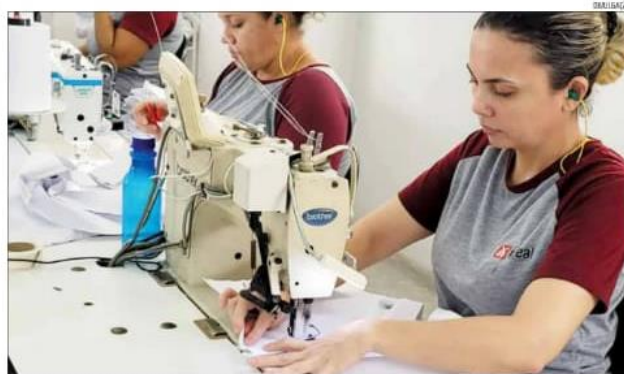
Diariamente, cerca de 48 mil peças de jeans e camisetas são produzidas nas 124 oficinas de costura que integram o Pró-Seridó