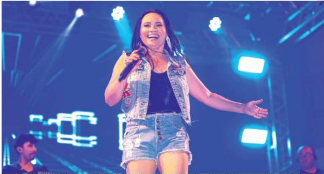
Além das atrações musicais, o São Julhão do Sesc, que será realizado em Zona Norte de Natal, contará com quadrilhas improvisadas, comidas típicas e um serviço de bar, ambos já estão disponíveis.

Evento que celebra a cultura e tradições nordestinas e juninas será aberto a não-associados; senhas estão à venda nas unidades do Sesc Natal