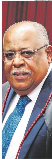
Relator, Ministro Benedito Gonçalves na sessão do TSE

Gravação inédita de reunião feita em julho de 2021 e divulgada pelo CNN revela que ex-presidente conversou com aliados sobre documentos sigilosos mantidos em sua residência, na Flórida, após deixar a Casa Branca. No início do mês, Trump se declarou inocente das 37 acusações por reter ilegalmente os papéis. PÁGINA 17