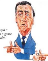
—Daqui a pouco a gente não volta!