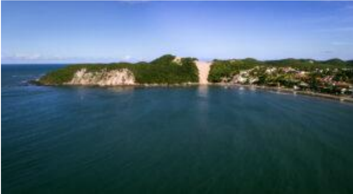
Praia de Ponta Negra, em Natal