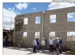
Complexo em construção recebeu cerca de R$ 15 milhões este ano