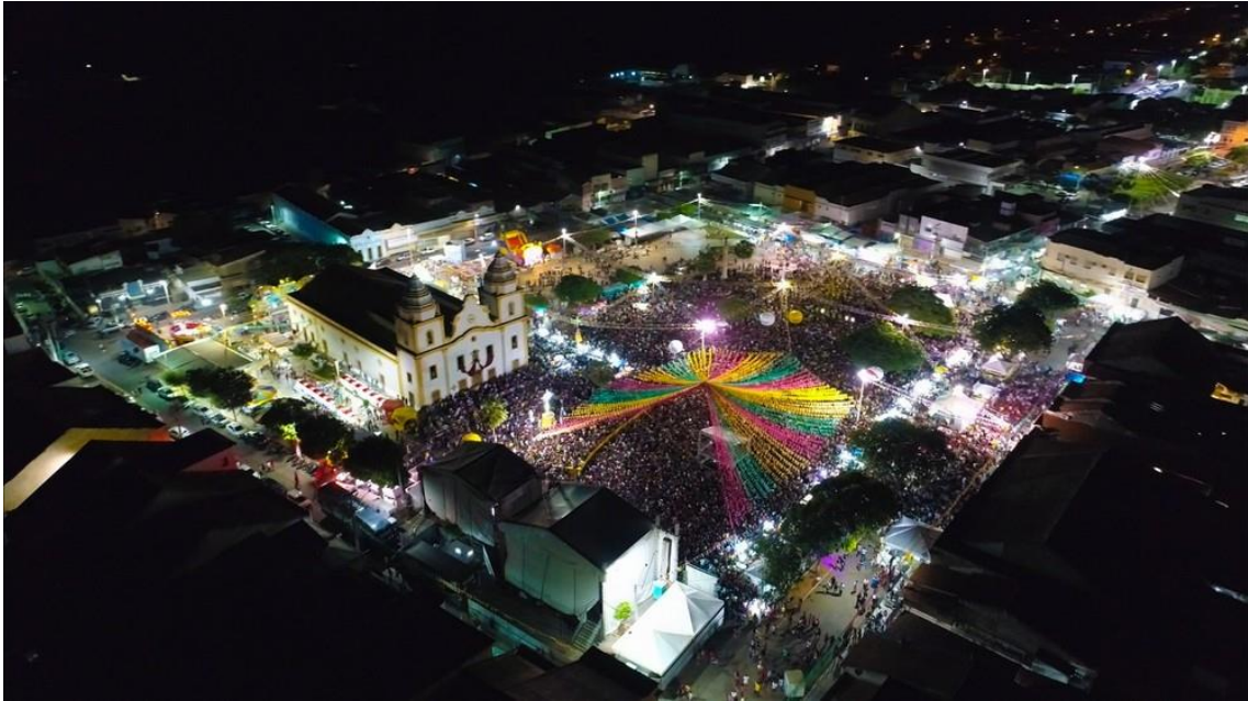
Assu tem São João mais antigo do mundo: quase 300 anos