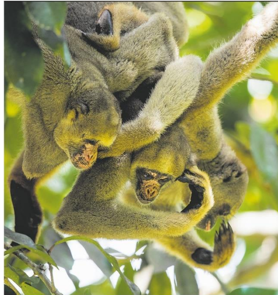
Entre abraços e chamegos. Muriquis-do-norte que vivem em Caratinga (MG); fêmeas trocam de grupo várias vezes até se sentirem satisfeitas O MURIQUI E A MATA ATLÂNTICA

Apesar da ótima fase, público médio é de menos de 20 mil pagantes. Clube e analistas buscam motivos. PÁGINA 24