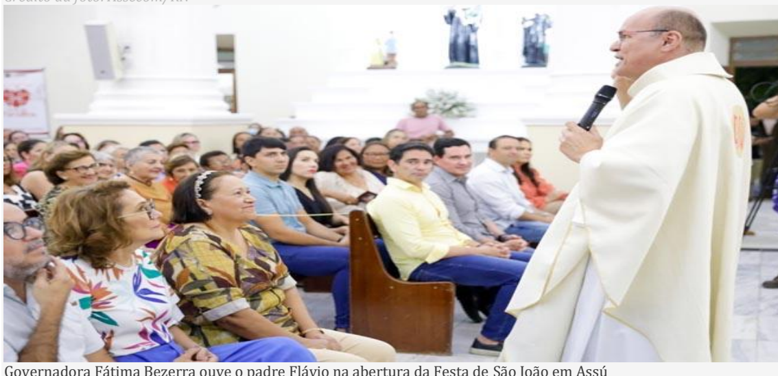
Governadora Fátima Bezerra ouve o padre Flávio na abertura da Festa de São João em Assú

A governadora Fátima Bezerra (PT) anunciou no município de Assú, na noite de quarta-feira, 14, que o governo vai construir o acesso ao Santuário Irmã Lindalva. Trata-se de um sonho antigo da população, que está ganhando forma, inclusive, com projeto pronto e área definida pela Igreja Católica e gestores envolvidos no movimento.