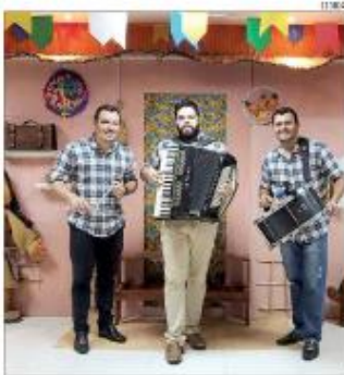
Trio de músicos tem agenda lotada até julho

Costureira ganha demanda de quadrilha junina