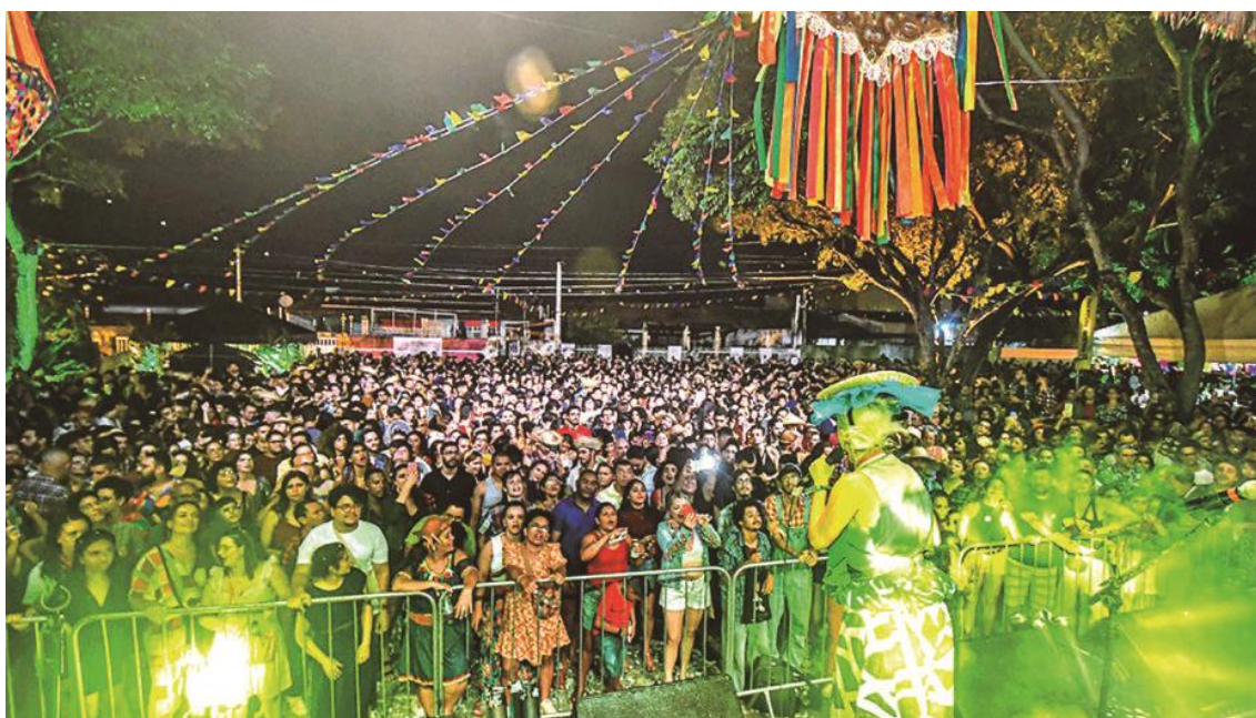
Arraiá de bairro em Potilândia