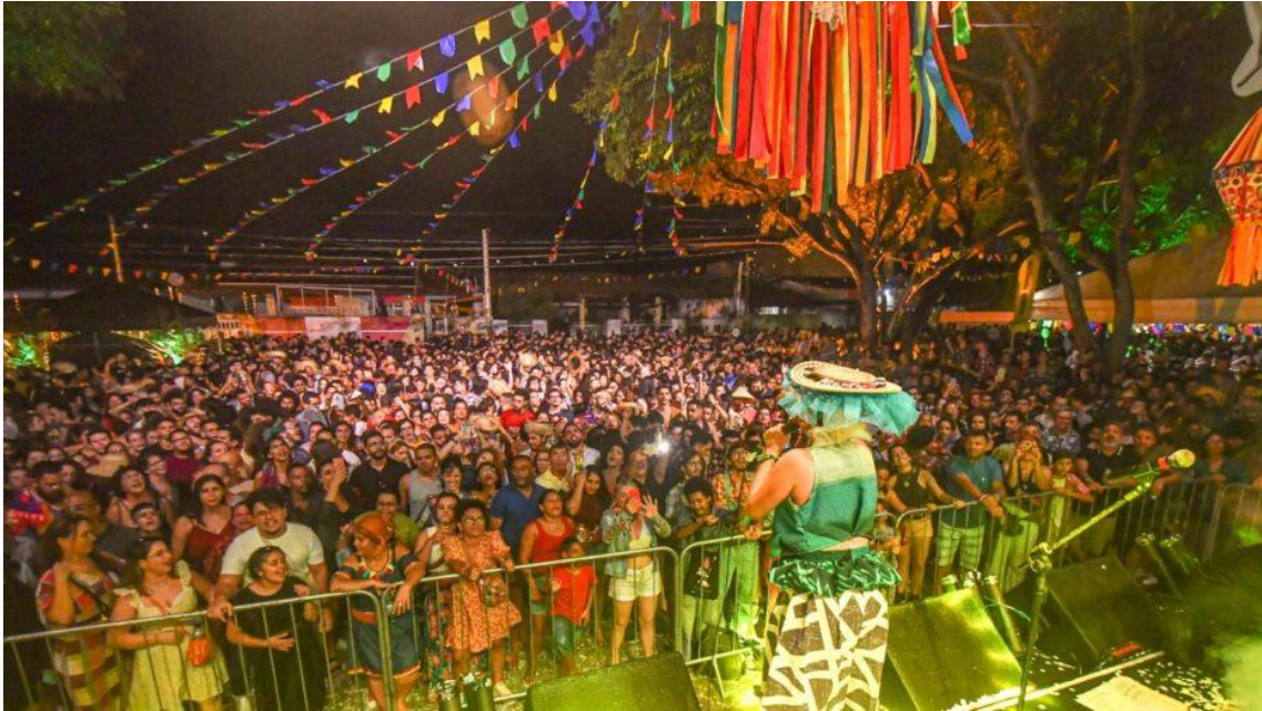
Arraiás de rua e shows de forró movimentam festas juninas no RN.

Antes mesmo de o mês começar, todo Nordeste brasileiro já estava pronto para celebrar uma das tradições mais queridas do país: as festas juninas. Além de ser um momento de grande representatividade para a cultura local, essas festividades também desempenham um papel fundamental no impulsionamento do crescimento econômico regional, movimentando diversas cadeias produtivas relacionadas à cultura.