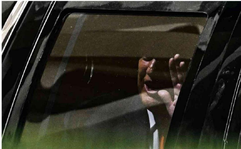
Donald Trump acena dentro de carro após comparecer a tribunal em Miami, onde ficou por cerca de duas horas para ouvir 37 acusações

Morre Treat Williams, ator de 'Hair', aos 71 anos, após sofrer acidente de moto