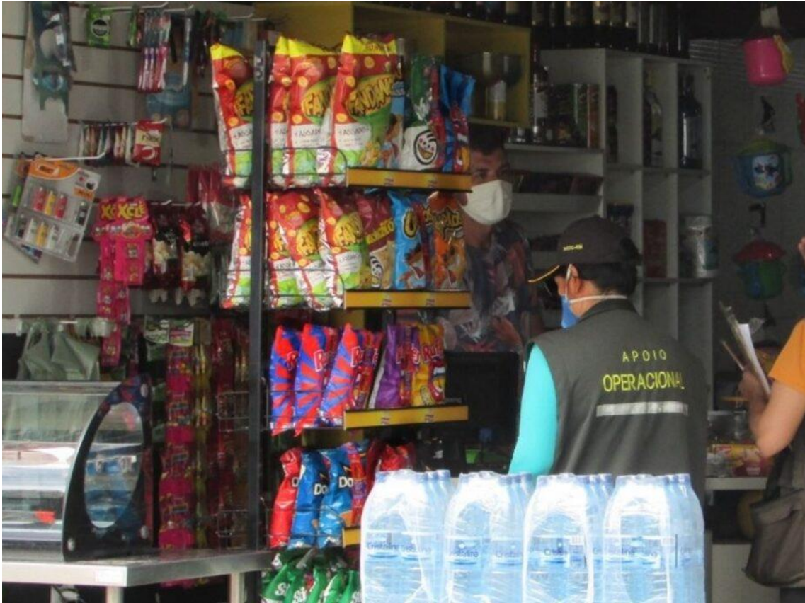
Bombonieres agora são passíveis de dispensa de licença em Natal

A partir do dia 2 de julho deste ano, mercadinhos, bombonieres, costureiras, lojas de ração, lanchonetes, entre outras atividades econômicas de pequeno porte e baixo risco ambiental e sanitário serão passíveis de dispensa de licença.