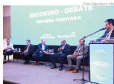
Evento com Bernard Appy foi promovido pelo Lide RN

Um terceiro ponto pelo secretário extraordinário como benefício para o Rio Grande do Norte será a criação de um mecanismo para a devolução de parte do imposto sobre o consumo, uma espécie de cashback. "O cashback é um mecanismo que vai ser financiado pelo país todo para favorecer as populações de menor renda, e elas estão concentradas nos estados com menor grau de desenvolvimento e nesse momento o Rio Grande do Norte vai se beneficiar também", conta Appy.