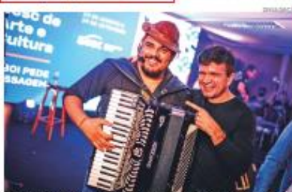
Cultura é tratada como ferramenta de transformação social em todo o RN

de ano – que em 2022 contou com a participação de Geraldo Azevedo –, e o lançamento dos Editais de Cultura, tendo somente este último um investimento total de R$ 489.360,00, um aumento de quase 30% em comparação ao ano passado (R$378.330,00).