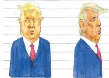
— Oi nós aqui travesti!