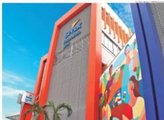
Senac RN oferece formação técnica como modalidade de ensino e qualificação profissional

Natal (RN), 23 de maio de 2023 – As matrículas para o mercado do trabalho vêm sofrendo nos últimos anos, tem demandado profissional com cada vez mais especialização técnica, conhecimento acerca da inovação e tecnologia nas rotinas organizacionais. Além disso, a oferta de formação técnica como uma das modalidades de ensino e qualificação profissional que entrega ao mercado profissionalizações alinhadas com as neces-