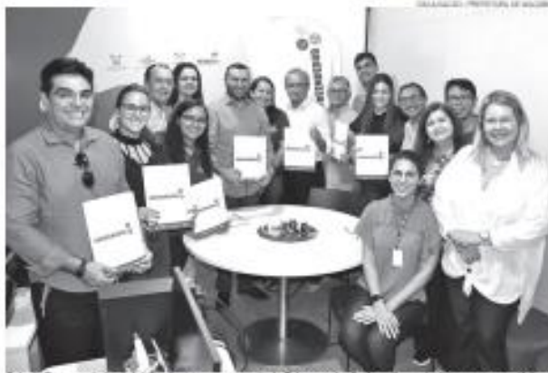
Sala do Empreendedor é viabilizada graças ao suporte do Sebrae, e é voltada ao fomento de pequenos negócios