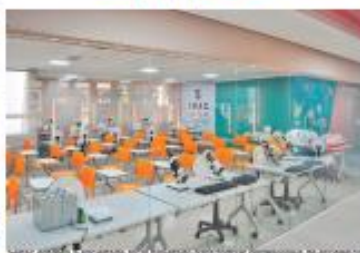
Senac oferece a sociedade local projetado para formar profissionais de excelência