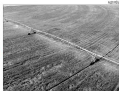
Atividades que dependem da irrigação vão sofrer impacto

mosa, Carlo Porro, não há como fugir da taxação. "O importante é cobrar valores competitivos e justos. A cobrança é inevitável e já acontece em vários estados, inclusive, no Ceará. Não é isso que vai inviabilizar a produção, desde que sejea, como eu disse, cobrado um preço justo", pontuou. A Agrícola Famosa é a principal exportadora de frutas do Rio Grande do Norte. Para a próxima safra, que começa em agosto, a empresa espera, pelo menos, manter os números da safra passada, quando foram exportados 9 mil contêineres, o equivalente a 120 mil toneladas de frutas.