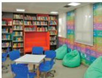
Interessados em se matricular em alguns cursos Senac podem acessar site