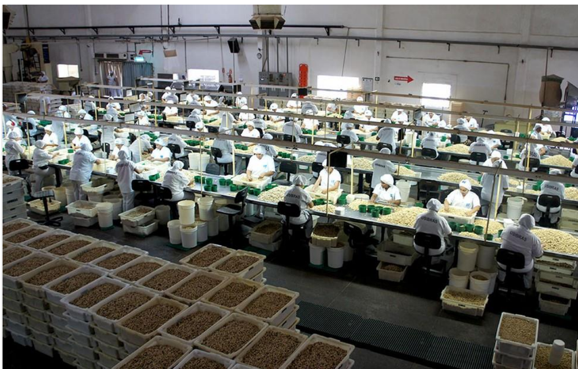
Linha de produção da fábrica de alimentos no RN (Aquivo)

A produção industrial fechou o primeiro trimestre de 2023 com variação negativa de -2,7%, de acordo com dados levantados pela Pesquisa Industrial Mensal de Produção Física (PIM - PF) do IBGE.