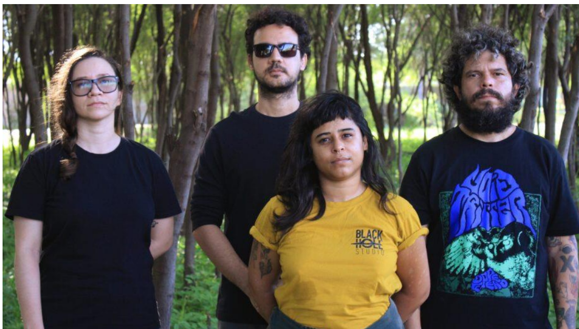
Banda Black Witch

O DoSol Interior – Festival e Incubadora está dando um giro de música e cultura pelo interior do Rio Grande do Norte, a trupe já passou por Currais Novos, Caicó e Santa Cruz e encerra a programação de 2023 nos dias 26 de maio em Assú e 26 e 27 de