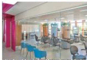
Os cursos técnicos de Saúde e TI estão à disposição do espaço de cada área

Interessados em se matricular em alguns cursos Senac podem acessar no site www.senac.br ou presencialmente no endereço da Escola Técnica (Rua São Manoel, 444, Cidade Alta, Natal). ●