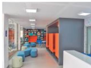
Além mais de 75 cursos que o Senac oferece oportunidades de qualificação profissional