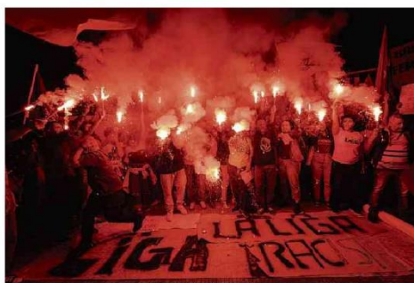
Protesto em frente ao consulado da Espanha em São Paulo contra o racismo.

Turistas no centro histórico da capital baiana, onde a polícia registrou 181 crimes do tipo em apenas quatro meses de 2023; em todo 2022, foram 160. Cotidiano B2