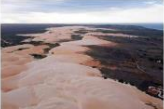
As dunas do Rosado correm o risco de desaparecer devido ao avanço da urbanização. EXPOSIÇÃO