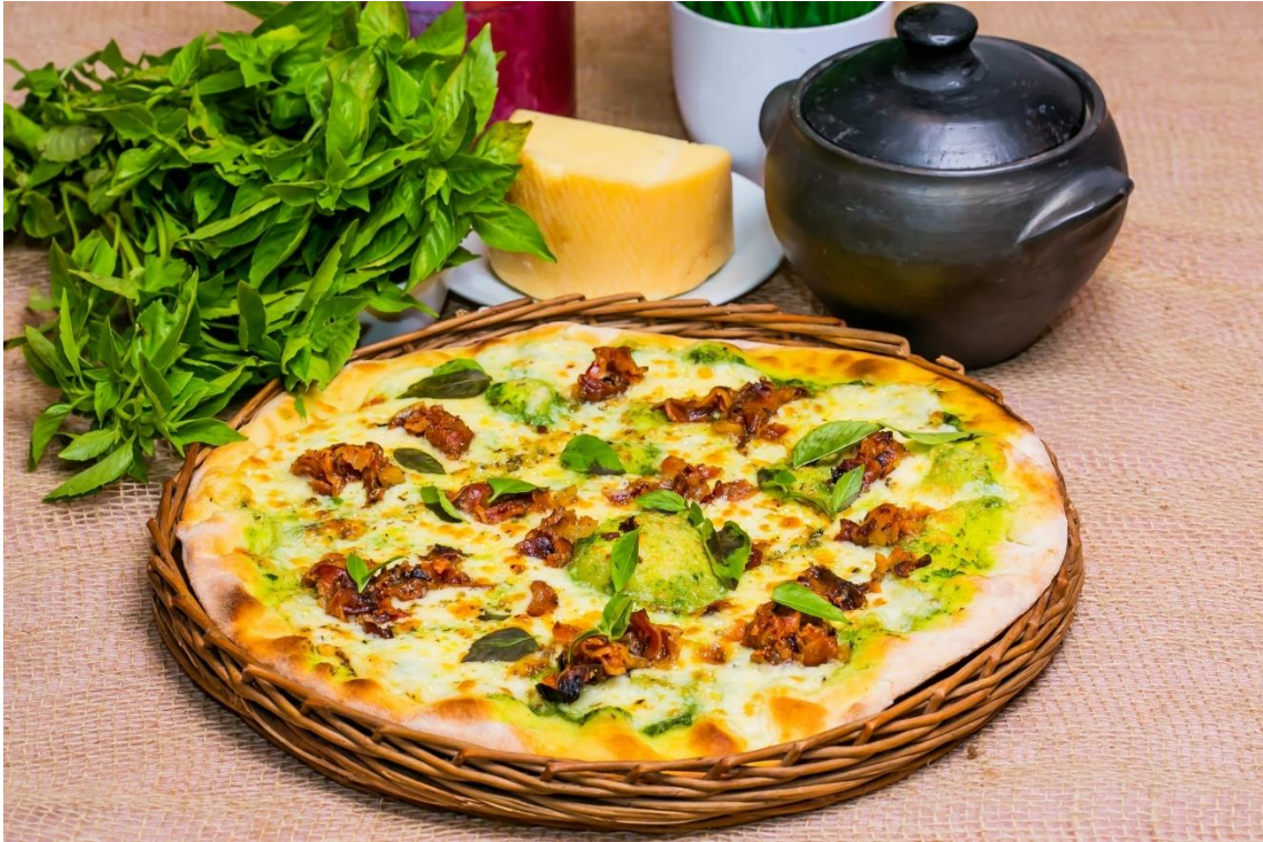
Pizza de bacon e provolone da Only Pizza

Neste ano, os diferenciais são os preços fixos, que oportuniza ao cliente sair de casa sabendo exatamente quanto vai gastar em cada visita, e a homenagem à cozinha Seridoense, que se trata de uma culinária, para muitos potiguares, afetiva, tornando a experiência gastronômica muito além do olfato e visual, indo até o coração.