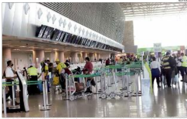
Leilão do Aeroporto Internacional Antônio Alves será realizado na próxima sexta-feira com um lance mínimo de R$ 200,5 milhões.

A previsão, no entanto, já é concretizada. Entre as empresas de capital estrangeiro que se candidataram ao leilão estão a espanhola Aena, a alemã Fraport e a francesa Vinci. A Vinci é a líder em licitação, segundo o ministro. A Fraport controla o aeroporto de Frankfurt, na Alemanha, e o Aeroporto de São Paulo, no Brasil. A Vinci é a líder em licitação, segundo o ministro. A Fraport controla o aeroporto de Frankfurt, na Alemanha, e o Aeroporto de São Paulo, no Brasil. A Vinci é a líder em licitação, segundo o ministro.