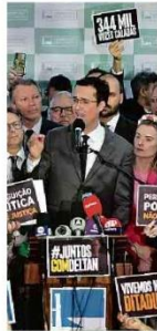
Deltan Dallagnol no salão verde da Câmara dos Deputados.