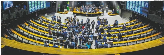
Primeira etapa. Plenário da Câmara aprovou a urgência da proposta de nova regra fiscal. Segundo o presidente da Casa, Arthur Lira, a votação do mérito será na semana que vem

RIO DE JANEIRO, QUINTA-FEIRA, 18 DE MAIO DE 2023 ANO XXIV - Nº 32.750 - PREÇO DESTE EXEMPLAR NO R$ 5,50