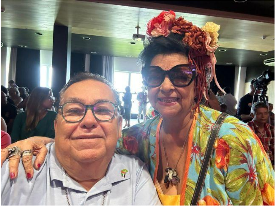
"Com a cantora Dodora. Sou fã!"