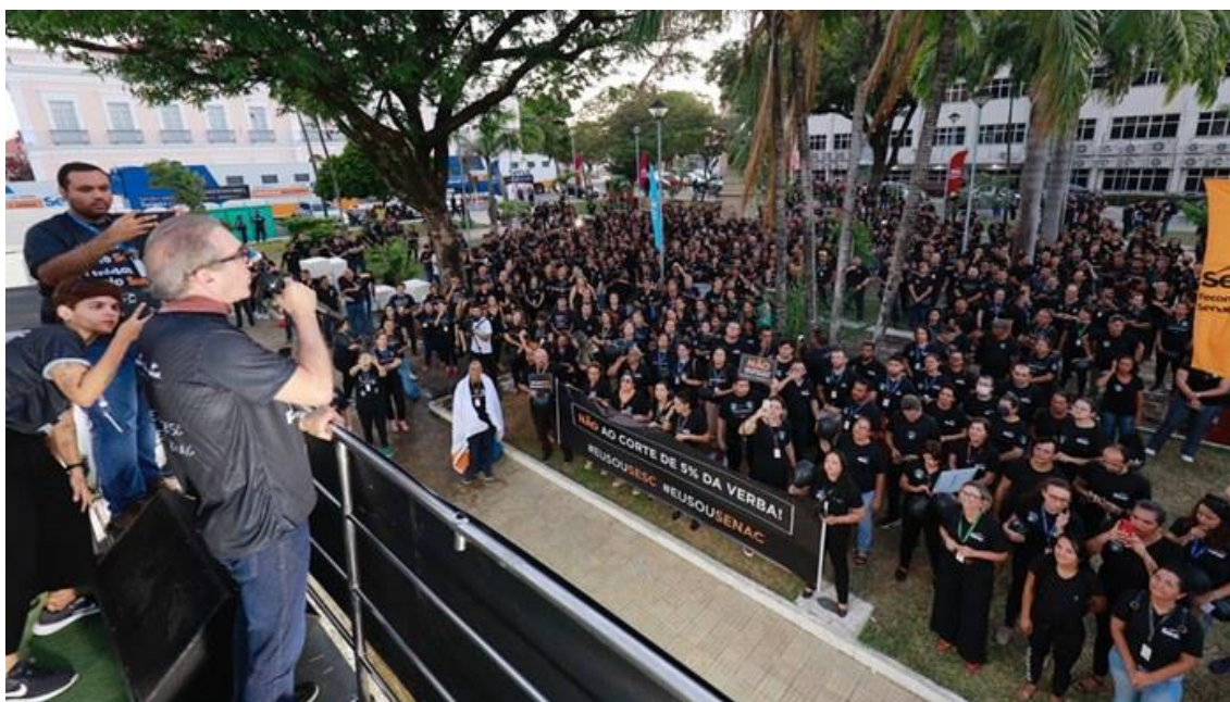
Ato público contra os cortes Sesc e Senac RN

Mais de mil pessoas, entre colaboradores e usuários do Sesc e Senac Rio Grande do Norte, estiveram presentes na Praça 7 de Setembro, no Centro de Natal, para o ato público contra o Projeto de Lei que propõe a transferência de 5% dos recursos destinados ao Sesc e Senac para a Agência Brasileira de Promoção Internacional do Turismo (Embratur). O chamado “Dia S” também reuniu usuários, alunos e professores em apoio às instituições.