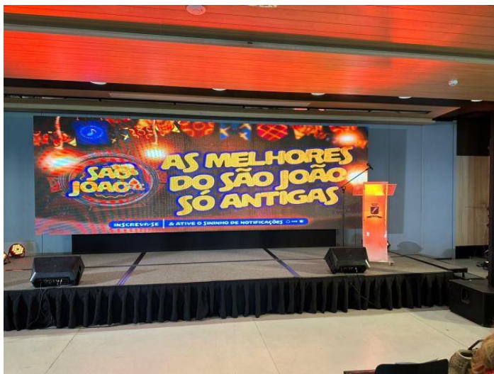
Galeria de fotos do evento