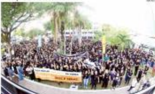
► PRIMEIRA SEÇÃO ► Trabalhadores e alunos da Fec e da Fecem 16 realizam grande mobilização em frente à Assembleia Legislativa para exigir a criação de uma comissão de investigação. ► CONTATO