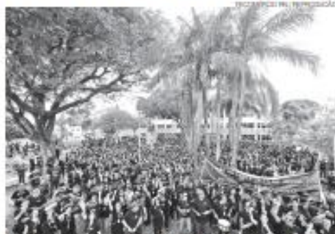
Cerca de 1 mil pessoas se reuniram na praça 7 de Setembro, em Natal

O projeto já foi aprovado na Câmara dos Deputados e deve ir à votação no Senado nesta quarta-