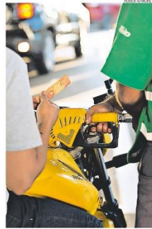
Nas bombas, Gasolina deve cair em média 8% nas ruas

Temendo uma mudança mais radical, o mercado financeiro reagiu bem ontem, com alta nos papéis da empresa. Analistas, porém, avaliam que o novo modelo amplia a possibilidade de maior ingerência do governo na política de preços, risco maior quando as cotações internacionais de petróleo e dólar subirem. PÁGINAS 11 e 12