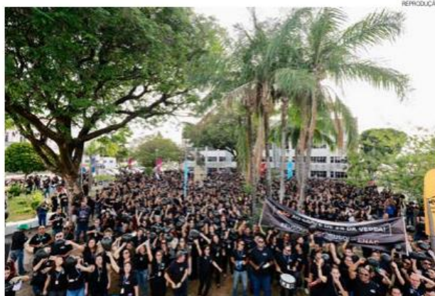
Natalenses não querem PL que propõe transferência de 5% dos recursos do Sesc e Senac para a Embratur

Mesmo sem contribuir, as micro e pequenas empresas também são beneficiadas pela qualificação de funcionários e melhoria das condições de vida da população em geral.