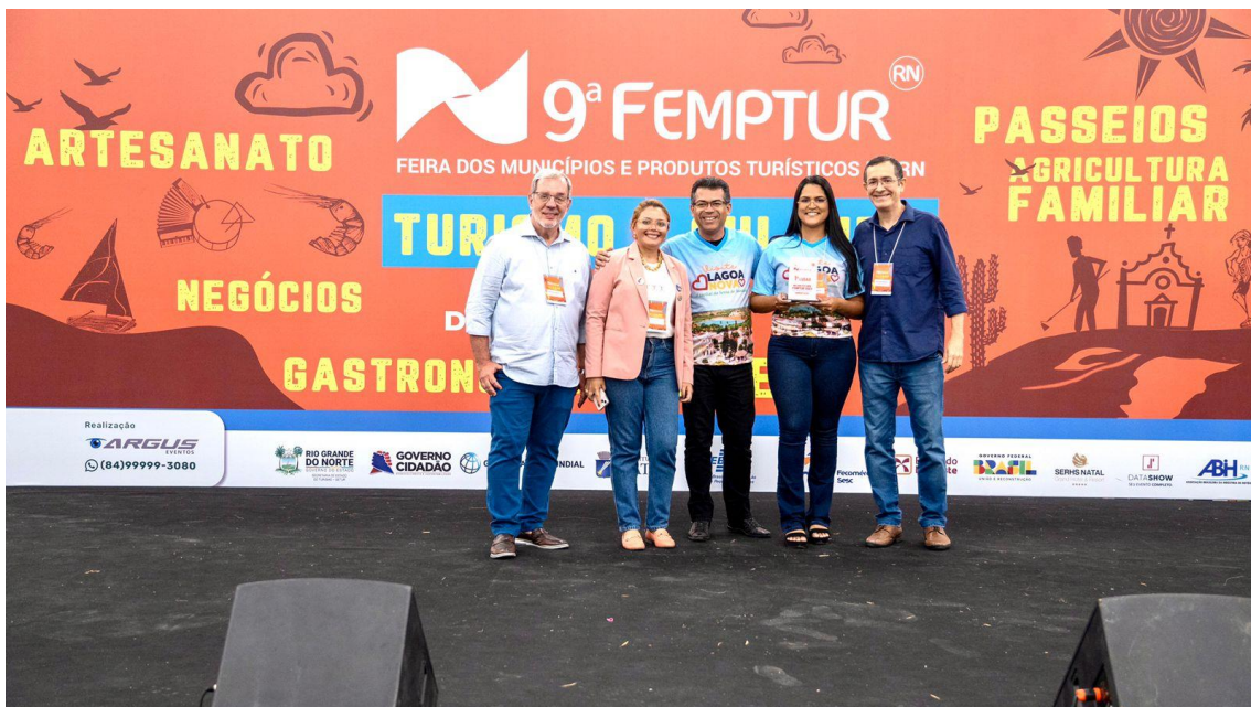
A FEMPTUR foi mais uma oportunidade de mostrar o turismo interno do Rio Grande do Norte.