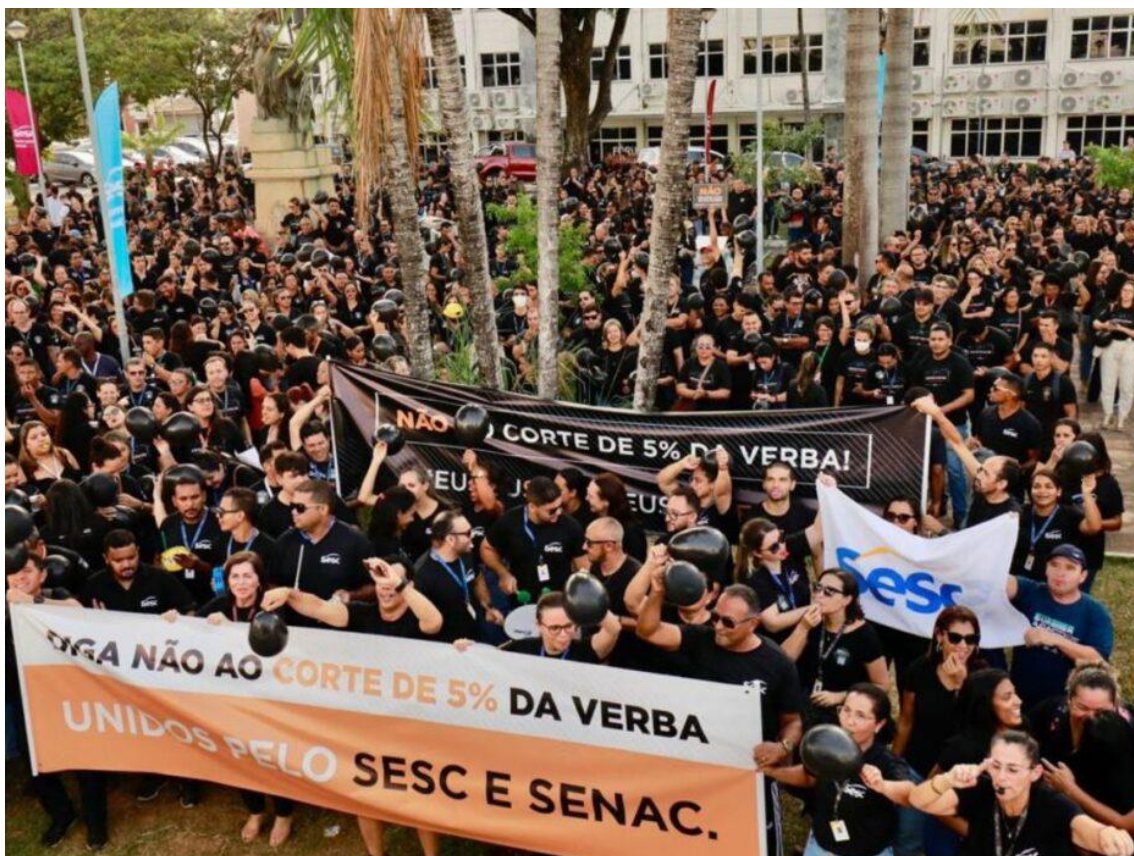
Protesto contra a retirada de recursos do Sesc e Senac, em Natal

Colaboradores, usuários, alunos e professores do Sesc e do Senac realizam na tarde desta terça-feira (16) um ato público em Natal contra um projeto de lei que, se aprovado, pode tirar recursos das instituições. Além de Natal, manifestações são registrados em todo o País.