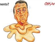
No flagrante, mais um derretimento do ex-presidente Jair Bolsonaro!