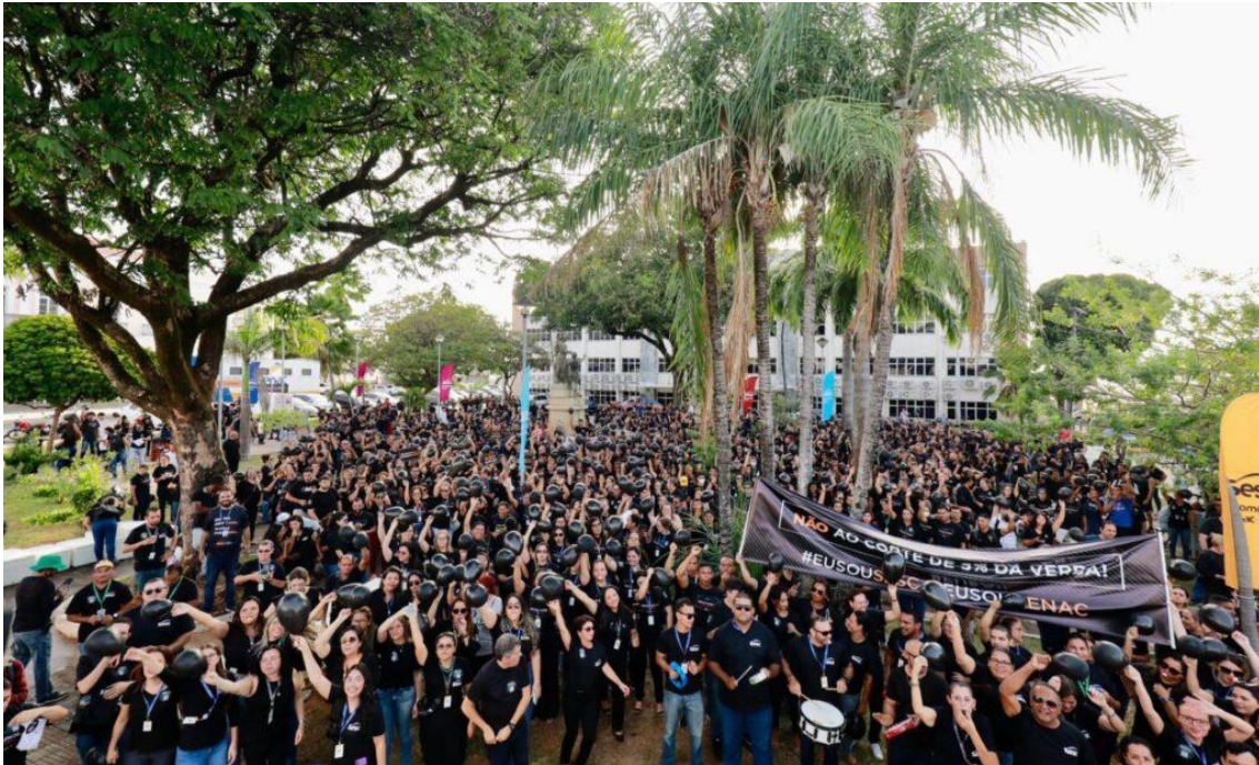
Manifestação contra retirada de recursos do Sesc e do Senac

Atualmente, existem 18 unidades físicas do Sesc e Senac no Estado, além de sete unidades móveis que percorrem vários municípios. No último ano, foram feitos mais de 1 milhão de atendimentos aos comerciários e população em geral.