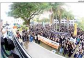
Mobilização contra o PLV 091/2023 em Curitiba. O Dia S mobiliza para evitar o corte de recursos do Sesc e Senac.

ALVARO DE MORAIS Após dezoito dias de mobilização, o Dia S, realizado nesta sexta-feira (17), em Curitiba, teve como objetivo principal pressionar o governo federal a derrubar os artigos 11 e 12 do Projeto de Lei (PLV) 091/2023, que prevê a transferência de 5% dos recursos do Sesc e Senac para custeio da Embratur e promoção do turismo internacional no Brasil. A mobilização contou com a participação de representantes de diversas entidades, incluindo o Sindicato dos Bancários do Paraná (Sibanc) e o Sindicato dos Bancários do Estado do Paraná (Sibanc-PR).