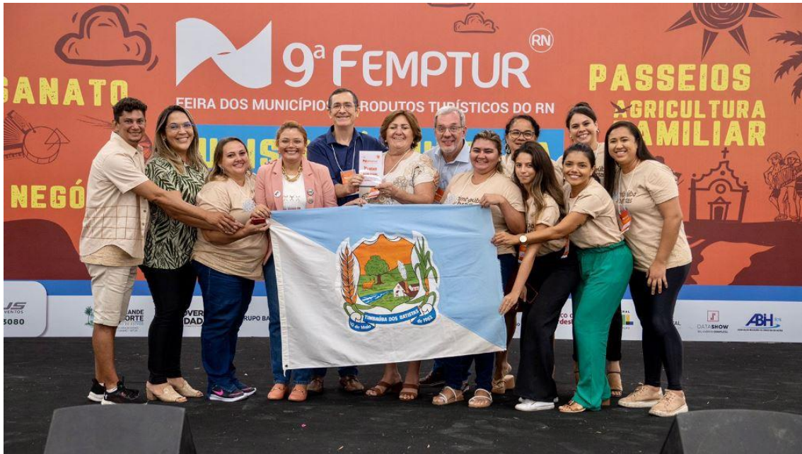
A FEMPTUR foi mais uma oportunidade de mostrar o turismo interno do Rio Grande do Norte.