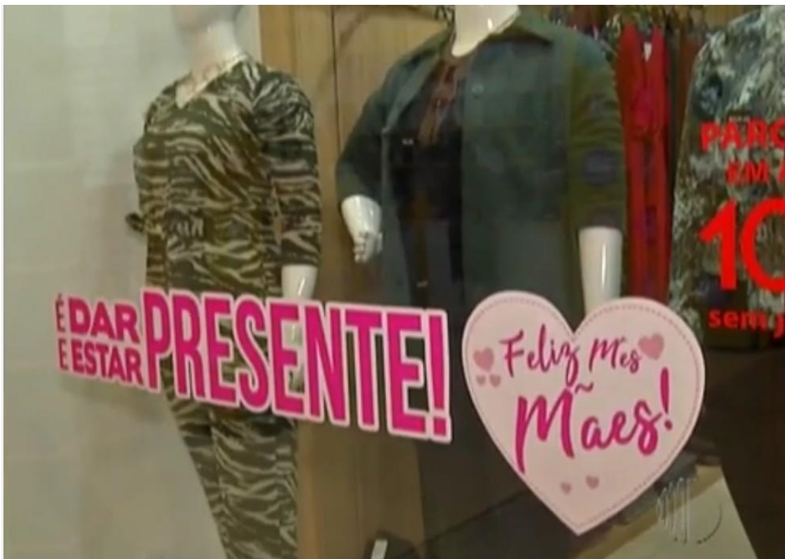
Dia das Mães gera expectativa no comércio do Alto Tietê