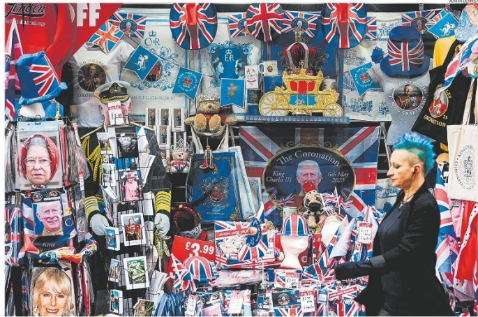
Negócios reais. Loja de souvenirs em Windsor abarrotada de lembranças de figuras da realza: ascensão de Charles III marcará era de transição para uma nova monarquia

RIO DE JANEIRO, SEXTA-FEIRA, 5 DE MAIO DE 2023 ANO XCIV - Nº 52.778 - PREÇO DESTE EXEMPLAR NO RJ - R$ 5,00