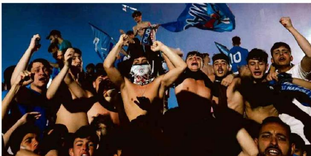
Torcedores celebram conquista do italiano em Nápoles, após empate por 1 a 1 com a Udinese que garantiu troféu.

Prisões foram de CACs que recadastraram armas, exigência cujo prazo acabou na quarta (3), e tinham mandado de prisão aberto. Ausências são só 1% dos armamentos, diz Dino. B1