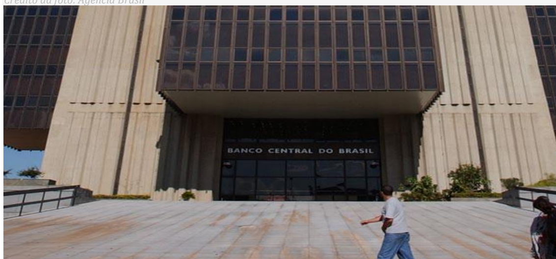
Banco Central do Brasil

Por Heloisa Cristaldo - Repórter da Agência Brasil - Brasília