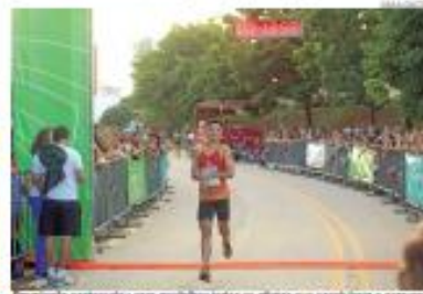
Premiação contou com troféus todos os atletas que concluíram o percurso