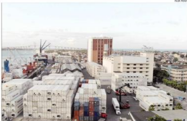
Neste ano, as exportações brasileiras superaram US$ 100 bilhões, segundo os dados do MDIC

Comparado com igual mês do ano anterior, as exportações em abril deste ano apresenta-