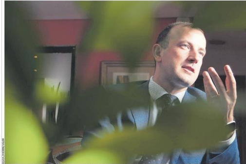
As novas regras para a importação de commodities agrícolas "vão ser uma ferramenta comercial sem um instrumento protecionista, existem para ajudar na proteção do clima", afirma o comissário de Meio Ambiente da Comissão Europeia, Virginijus Sinkevičius. Página A6