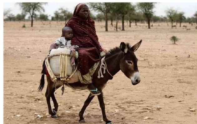
Sudanenses cruzam a fronteira com o Chade para fugir de conflito que deixou 520 mortos desde o último dia 15

São Paulo hoje 29° 18° Hoje Amanhã Rio 20 32 20 34 Brasília 14 29 15 30 Ribeirão 16 31 17 32 Fonte: www.climatempo.com.br