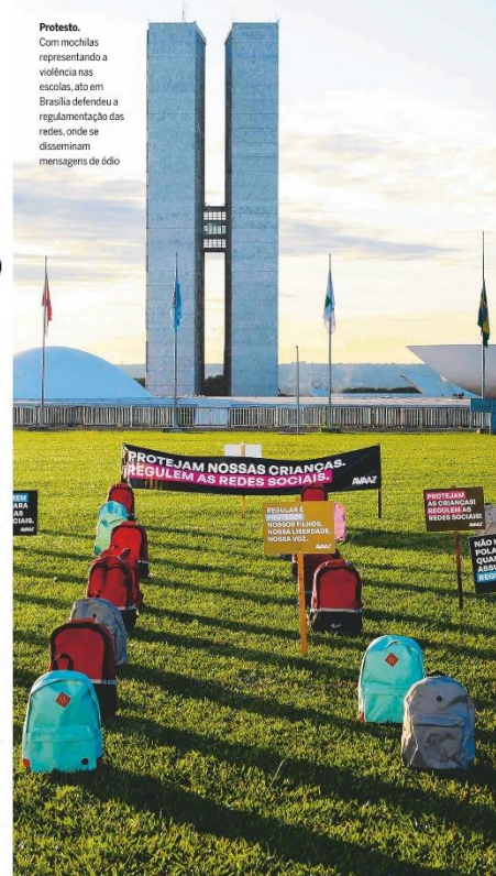
Protesto. Com mochilas representando a violência nas escolas, ato em Brasília defendeu a regulamentação das redes, onde se disseminam mensagens de ódio

Exposição ao sol, má postura e menos cuidados do que os dedicados ao rosto são fatores que aceleram a degradação da pele do pescoço, que já tem estrutura mais frágil. Saiba como conter os danos. PÁGINA 21