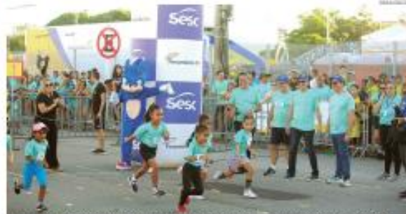
Largada desta edição da corrida foi no largo da Avenida das Dunas, com percurso que passou por pontos da LÍRIS

de chegada e relatou com emoção o orgulho de ter completado a prova e conquistado o primeiro lugar. “É uma sensação inexprimível, estou muito feliz pelo resultado, é por ele que vou estar treinando para essa prova, que estou correndo pela quarta vez seguida. A corrida do Sesc é muito importante para a inclusão da pessoa com deficiência, sempre incluído nas provas, que a cada ano vem crescendo e tratando melhorias”, relatou o atleta.