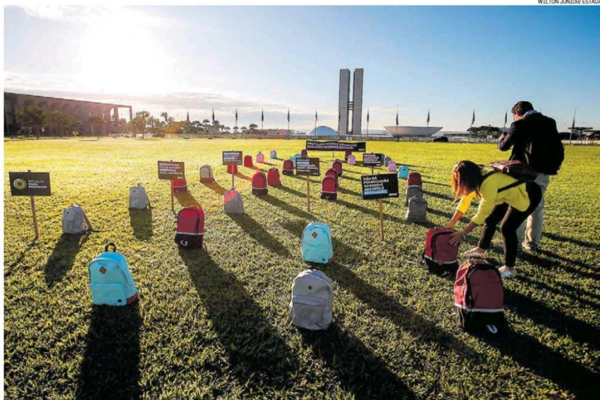
A Avaaz, movimento de mobilização online, colocou 35 mochilas em frente ao Congresso em memória de vítimas da violência nas escolas

Quarta-feira 3 de MAIO de 2023 • R$ 6,00 • Ano 144 • Nº 47314 estadão.com.br