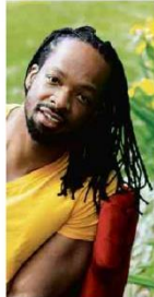
O escritor Jericho Brown vem ao Brasil em junho