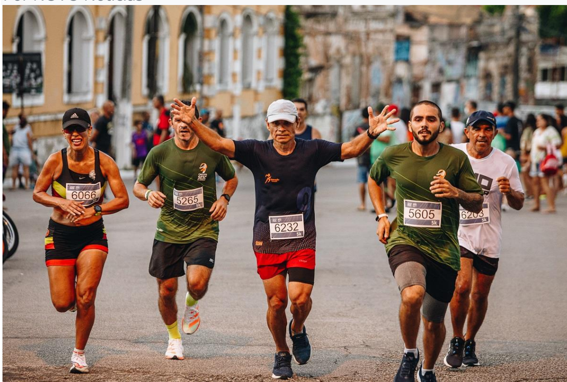
Circuito Sesc de corridas

O período de inscrições para a etapa Natal do Circuito Sesc de Corridas encerra nesta quinta-feira, dia 20. O evento acontece no dia 1º de maio, Feriado do Trabalhador, a partir das 15h30 no largo do Arena das Dunas, com percursos de 5 e 10 quilômetros passando pelo anel viário da Universidade Federal do Rio Grande do Norte (UFRN).