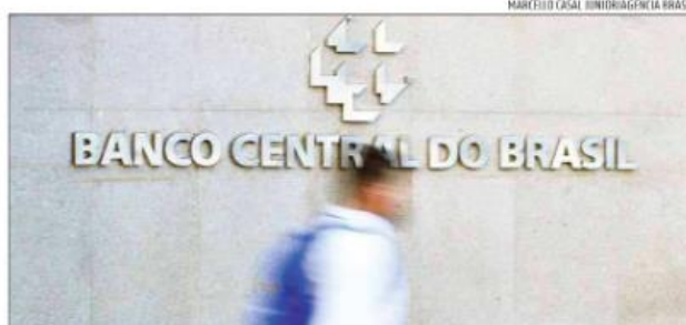
Previsão está na nova edição do Boletim Focus, divulgado semanalmente pelo Banco Central (BC)

Para alcançar a meta de inflação, o Banco Central usa como principal instrumento a taxa básica de juros, a Selic, definida em 13,75% ao ano pelo Comitê de Política Monetária (Copom). A taxa está nesse nível desde agosto