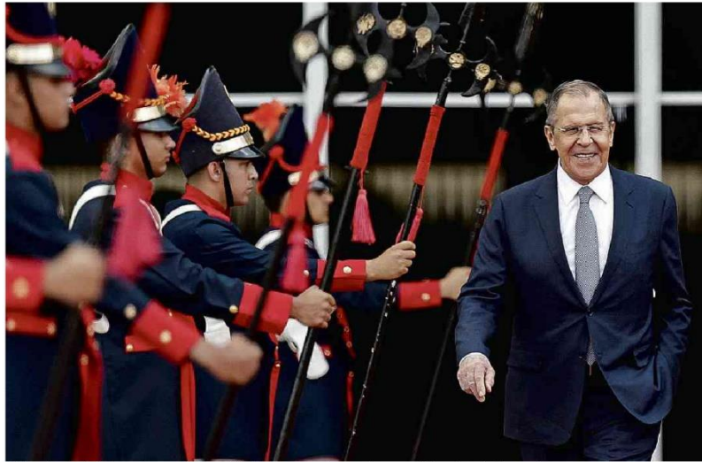
O chanceler da Rússia, Serguei Lavrov, deixa o Palácio do Itamaraty após se reunir com o ministro das Relações Exteriores, Mauro Vieira.

Nos últimos dias, o brasileiro atraiu críticas na Europa e nos EUA por afirmar que a guerra só interessava a Putin e ao ucraniano Volodimir Zelenski e que Kiev não poderia ter tudo, insinuando que o país invadido deveria ceder território para encerrar a crise. Mundo A12 e A13