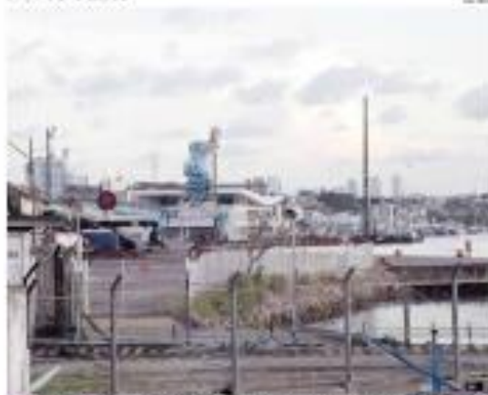
▶ INDÚSTRIA - Empresa Brasileira de Celulose (Bracel) deixou de operar no Porto de Natal, que deve ser quando começar a operar a partir de maio seguinte. Hoje, o porto está fechado. ▶ PÁGINA 10