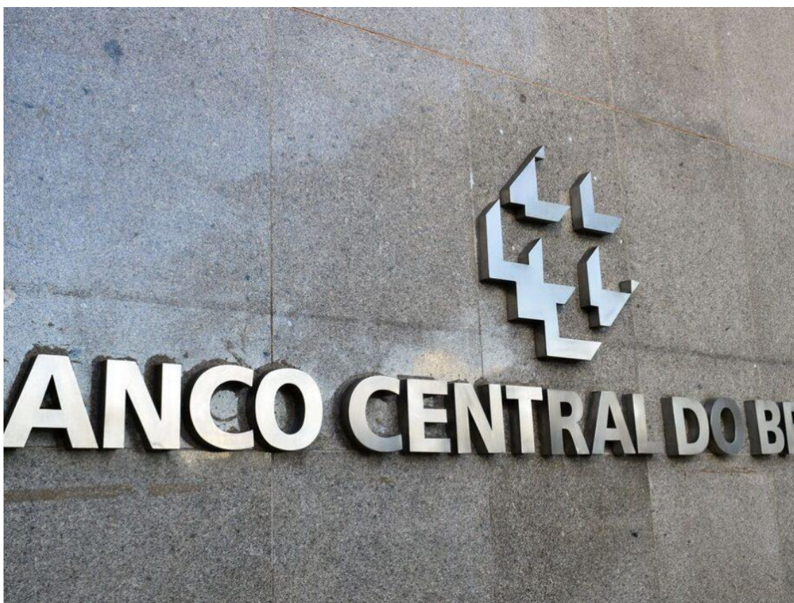
Atividade econômica fica praticamente estável em janeiro deste ano