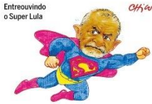
— Depois de encontrar o Xi Jinping na China e o Sergei Lavrov no Brasil, vou coroar o Rei Charles na Inglaterra e já volto!

EDITORIAL 'NEUTRALIDADE' DE LULA REVELA APOIO TÁCITO À RUSSIA PÁGINA 2