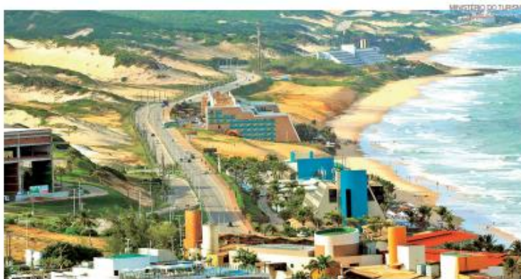
Solenidade de abertura acontece nesta quarta 12, no Hotel Senac Barreira Roxa, na Via Costeira, a partir das 18h30

Ainda segundo Mesquita, o foco do 2º Encontro Regional ICLEI Nordeste será tratar de desafios concretos para responder à emergência climática, com um olhar orientado para a promoção de parcerias efetivas. É que permitam que os governos locais conheçam e acessem instrumentos adequados para agir e responder a suas demandas imediatas.