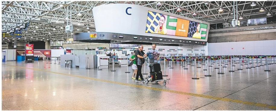
Como consequência da ociosidade do Galeão, que opera muito aquém de sua capacidade, o Rio perdeu conectividade na malha de voos nacional e hoje tem menos destinos domésticos que Belo Horizonte e Recife, por exemplo. Quadro agrava desinteresse de companhias aéreas em retomar rotas internacionais na cidade. PÁGINA 16