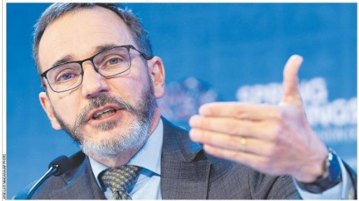
As perspectivas para a economia mundial pioraram e o risco de um "pouso forçado" voltou a crescer diante de uma inflação crescentemente alta, juros em elevação e turbulência bancária. "A situação continua frágil", afirma Pierre-Olivier Gourinchon, economista-chefe do FMI. Pág. A20