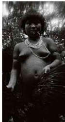
Yanomami fotografada por Claudia Andujar. Divulgação

Artista que registrou yanomamis desde os anos 1960 conta se sentir familiar dos indígenas, critica Bolsonaro e vai doar seu acervo ao Instituto Moreira Salles.