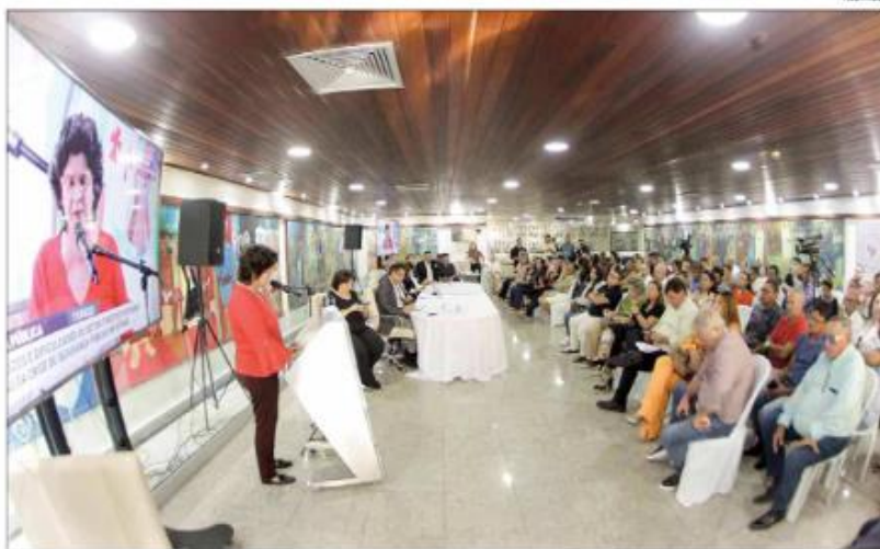
Ocupação na semana santa ficou em 52%. Deputados receberam representantes do Turismo e do Governo e debateram crise no setor

Na quinta-feira da semana passada, às vésperas do feriado, a Associação havia divulgado que a projeção para o período seria de uma ocupação de