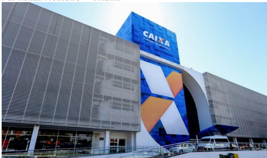
Caixa Econômica Federal