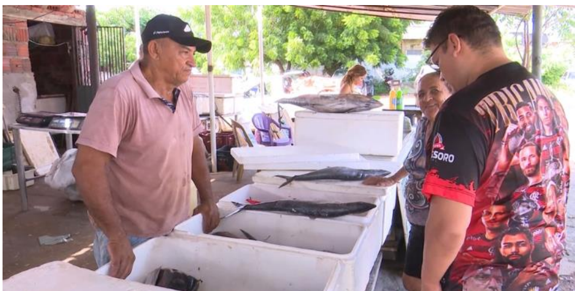
Venda de peixes em Mossoró.

De acordo com pesquisa da Fecomércio, Mossoró registrou aumento na intenção de compras de Páscoa.