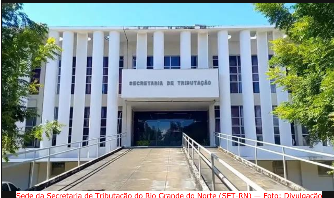
Sede da Secretaria de Tributação do Rio Grande do Norte (SET-RN)

Pelo menos nove entidades que representam diferentes segmentos do setor produtivo do Rio Grande do Norte, entraram com uma ação civil pública na Justiça, em caráter de urgência, contra o aumento da alíquota básica do ICMS, de 18% para 20%, que começou a valer neste sábado (1º).