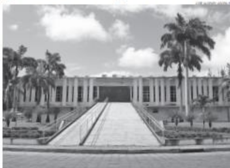
Aumento do imposto fará Estado compensar perda de arrecadação provocada por redução do ICMS em 2022

Sancionada nos últimos dias do ano passado pela governadora Fátima Bezerra (PT), a lei que trata sobre o aumento do ICMS estabelece que o reajuste seria anulado caso o Governo Federal se passasse ao Governo do Estado uma compensação pelas perdas de arrecadação provocadas pela redução do imposto no 2º semestre de 2022.