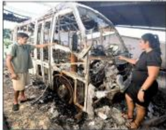
► TRÁGICA ► Uma jovem de 18 anos, em sua primeira viagem para o trabalho, sofreu um acidente com um caminhão. Ela estava feliz e estava com o marido. Agora, seu sonho de ser mãe acabou. ► 19/08/2023

RN aumenta ICMS, mas PB negocia para ser mais atrativa