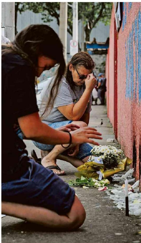
Mãe e filha, ambas ex-alunas da Escola Estadual Thomazia Montoro, prestam homenagem a vítima de ataque na segunda (27); agressor tentou comprar arma de fogo.

Deirdre McCloskey Banco central dos EUA não tem poder de definir taxas de juros mundiais Opinião A2