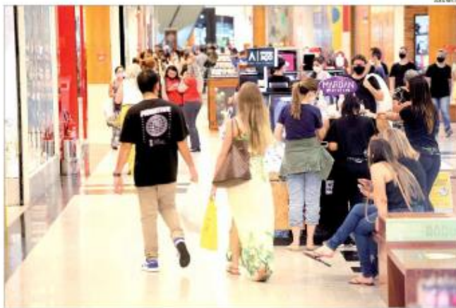
Segmentos do comércio, serviços e turismo temem impacto direto no desempenho das atividades e na geração de emprego e renda