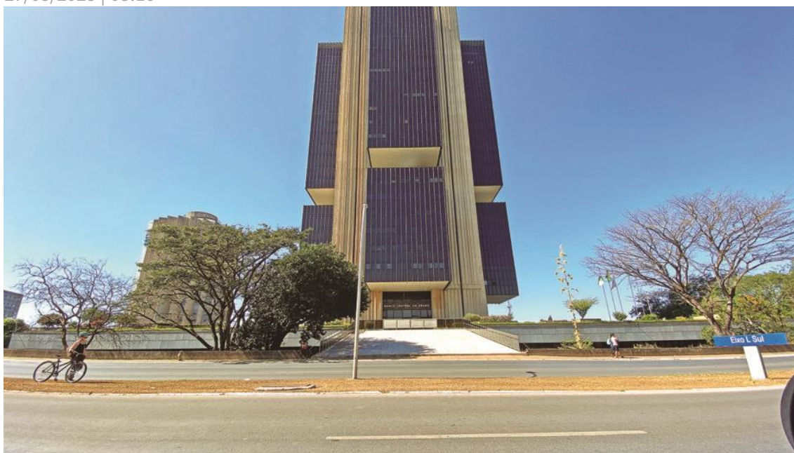
Sede do Banco Central em Brasília

A taxa real de juros, que é a diferença entre as expectativas para a taxa básica e as projeções de inflação, caiu nos últimos meses, mas continua em níveis historicamente elevados e exercendo