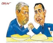
A luta continua!

mento das famílias e reduzindo seu poder de compra. De março de 2020 até o mês passado, o aumento médio nesse segmento foi de 45,35%. PÁGINA 13