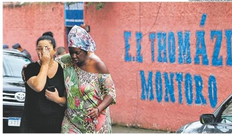
Terror. Pais de professores e alunos correram até escola após saber dos ataques à faca, na manhã de ontem

das racistas contra outro aluno. Há um mês, o colégio anterior do infrator registrou queixa na polícia por sua conduta violenta, alertando para possível ataque. Antes do crime, ele publicou em redes sociais que atacaria. A nova tragédia, a 23ª do tipo no Brasil em duas décadas, fez reviver o debate sobre prevenção de crimes de ódio cometidos por menores e como proteger espaços escolares. PÁGINAS 10 e 11