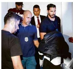
Adolescente deixa o 34º Distrito Policial após depoimento para ser levado à Fundação Casa.