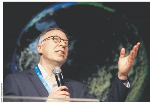
Qua a economia global se move na direção da baixa emissão de carbono ou não conseguirá lidar com o aumento da pobreza, as pressões inflacionárias e a crise climática, diz o economista Jeremy Oppenheit, que participou ontem do Fórum América 2030, em São Paulo. Página 37