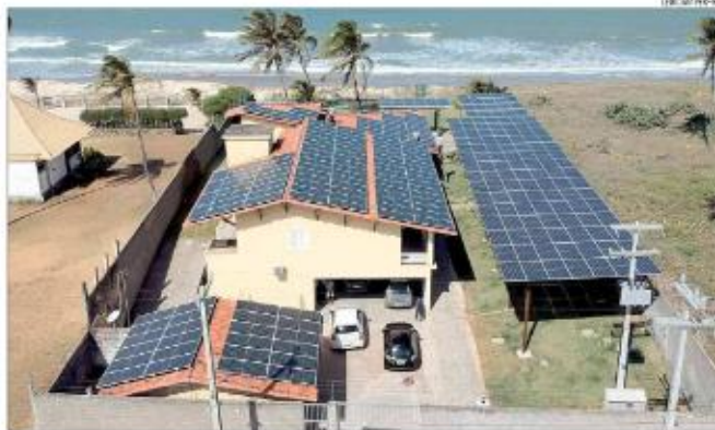
Estado fechou o ano com 37.820 sistemas conectados à rede, sendo 83% residenciais. Potência conectada é de 396.033,34 MW

De acordo com os números, o crescimento na atividade ficou acima do registrado na indústria potiguar, de 8,3%, e no conjunto de setores da economia, de 5,2%, no mesmo período. Ainda, 304 mil empregos são gerados pelo setor. Desse total, 8.880 correspondem a ocupações ligadas ao setor de energia, incluindo energia elétrica, solar, eólica e outros segmentos. O levantamento mostra também que a participação desse setor no emprego no total do emprego do setor industrial passou de 7% em 2021, para 8,2% no ano seguinte.