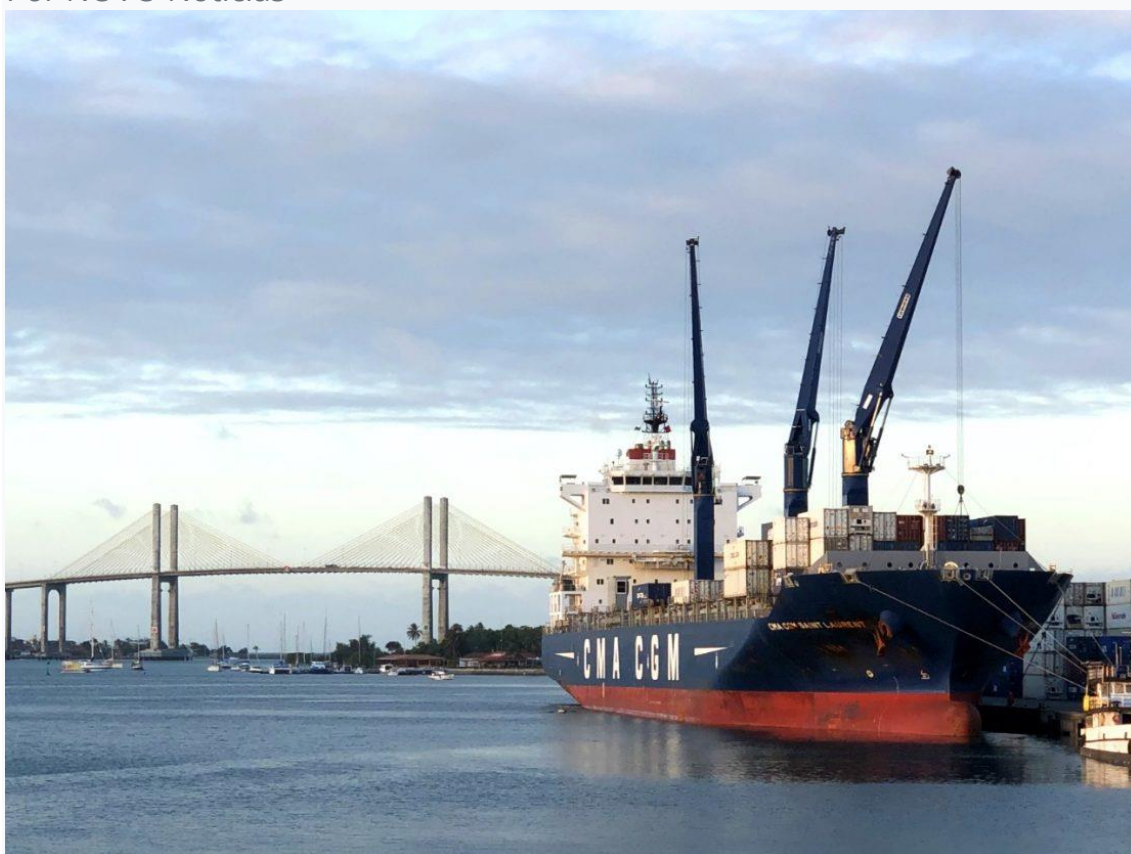
Porto de Natal

A Confederação Nacional dos Transportes (CNT) contratou uma empresa para realizar um Estudo de Viabilidade Técnica, Econômica e Ambiental (EVTEA), do chamado Porto Potengi, que ficaria na margem oposta ao atual porto de Natal.