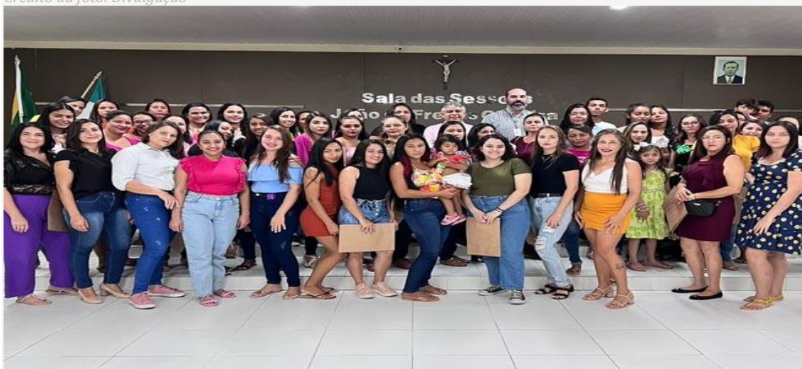
Turma de 100 profissionais da área de Beleza

Governador Dix-sept Rosado – Uma parceria da Prefeitura com o Serviço Nacional do Comércio (SENAC) , do Rio Grande do Norte, formou 100 profissionais na área de beleza. Os certificados aos concluintes dos cursos, ofertados gratuitamente, foram entregues esta semana.