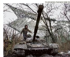
Efeito-surpresa. Blindado ucraniano toma posição na mata

Atirando de esconderijos, tropas ucranianas têm feito estrago nos tanques russos, que avançam em fileiras. Estima-se que 130 veículos blindados dos invasores foram destruídos em três semanas. PÁGINA 19