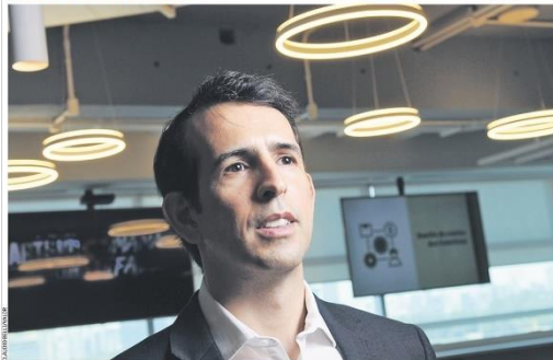
O bom desempenho das operações da Gerdaul na América do Norte compôs um grande parte os seus resultados obtidos no Brasil em 2022, principalmente no quarto trimestre. É a perspectiva de "mais um ano espetacular" no região, diz o presidente do grupo, Gustavo Werneck. Plq. B3