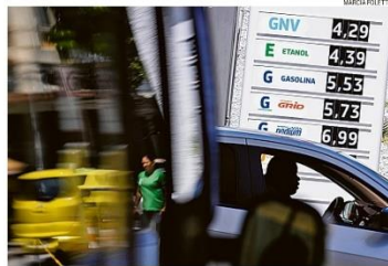
Preço em alta. Reeneração dos combustíveis provocou aumento imediato nas bombas

Enquanto a Petrobras anunciou na noite de ontem que registrou, em 2022, seu recorde histórico com um lucro líquido de R$ 188 bilhões, o governo Lula tem implementado medidas que interferem na companhia com o objetivo de atenuar o impacto, nos preços nas bombas, da volta da cobrança dos impostos federais sobre combustíveis. A diretoria da estatal avançou no plano de mudar sua política de preços, pondo fim à paridade internacional que baseia na cotação do petróleo e do dólar o valor cobrado nas refinarias. O peso das cotações internacionais, hoje de 100%, pode cair a até 15% no cál-