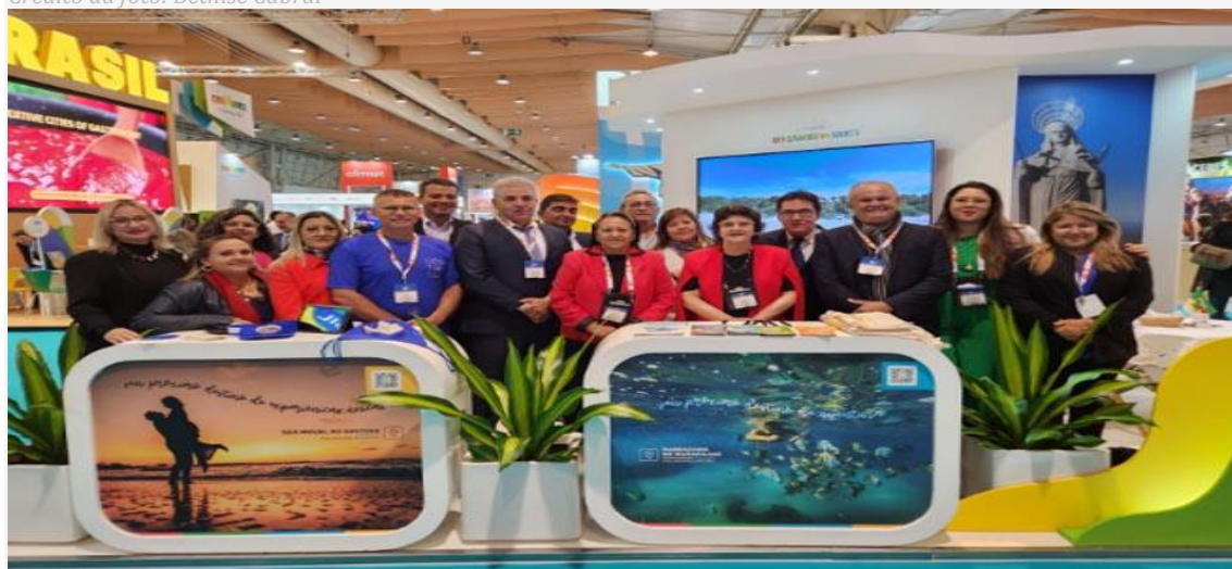
Comitiva do RN na Feira de Turismo de Lisboa

Cumprindo agenda na Feira de Turismo de Lisboa - BTL, o governo do Estado do Rio Grande do Norte, por meio da Empresa Potiguar de Promoção Turística (Emprotur), lançou nova proposta de roteiro com foco na diversificação da oferta turística do estado e fomento a novos destinos. O roteiro exclusivo é uma parceria com a operadora Logitravel, empresa integrante do Grupo Viajes El Corte Inglés - líder no mercado europeu -, e contempla o Litoral Norte, envolvendo os municípios de Natal, Extremoz, Maxaranguape, São Miguel do Gostoso, Galinhos e Guamaré.