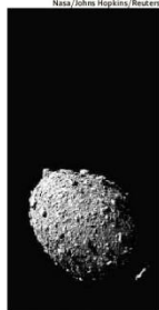
O asteroide antes de ser atingido pela sonda da Nasa

Parque da Nintendo na Califórnia recria universo do Mario Bros em atrações