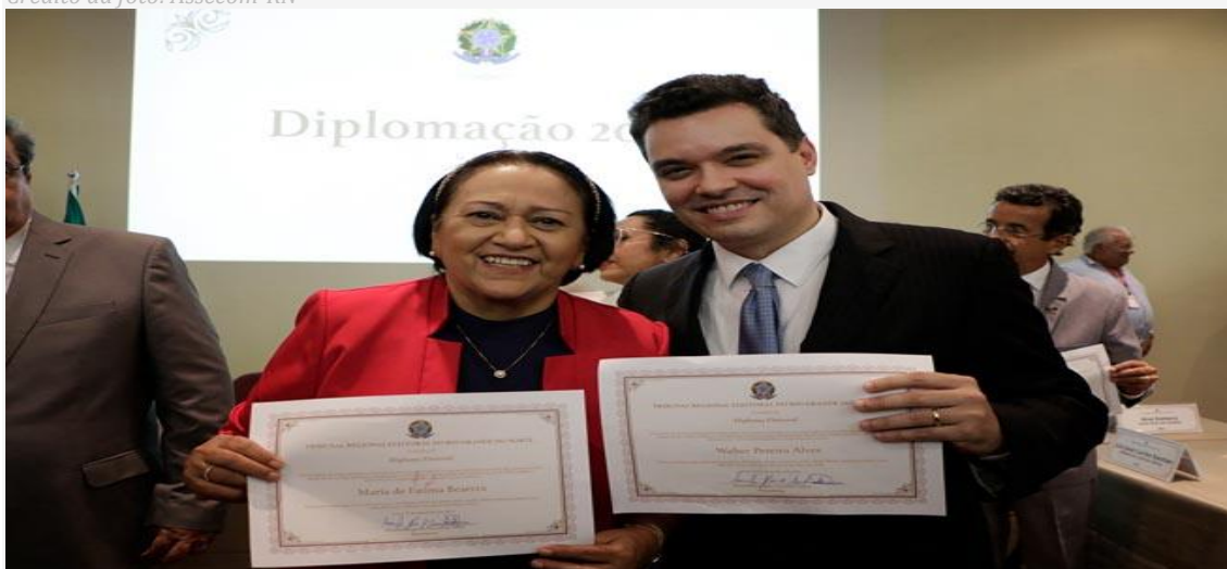
Governadora Fátima Bezerra transmitirá cargo para o vice-governador Walter Alves

Com agendas nas áreas do desenvolvimento econômico, setor de energias renováveis, e da promoção do turismo no estado, a governadora Fátima Bezerra (PT) cumpre agendas administrativas a partir desta segunda-feira (27), em Portugal. O vice-governador Walter Alves (MDB) assumirá o governo por uma semana.