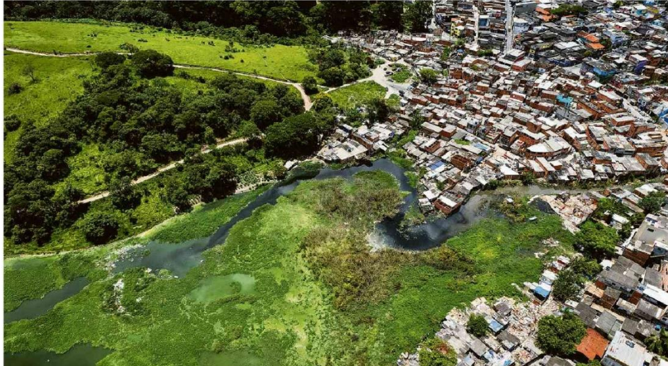
Construções na favela da Fumaça invadem área do parque dos Búfalos, às margens da represa Billings, no Jardim Apurá, extremo sul da capital paulista.