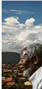
O antropólogo Kabengele Munanga em Itanhaém (SP).

Para o professor aposentado da USP, o país trata a questão como "crime perfeito". "O mito da democracia racial, por muito tempo, impediu que se falasse da existência", diz. A12