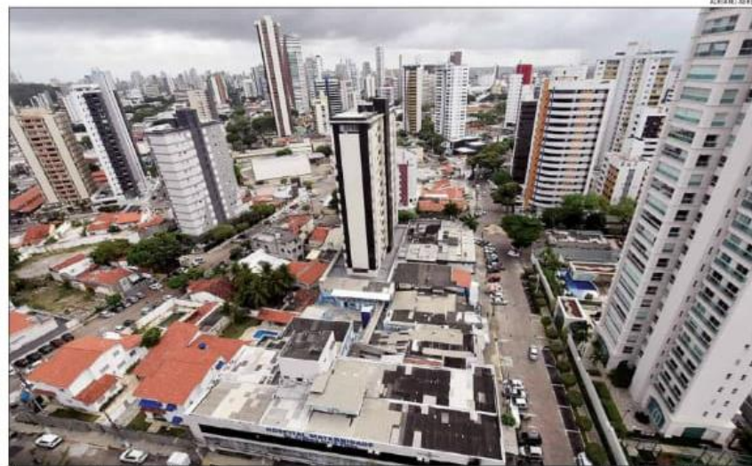
Na zona Leste, o bairro de Petrópolis é um dos que registra maior número de projetos para novos empreendimentos, a maioria deles de uso multifamiliar

Segundo a Secretaria, a consulta prévia é uma abertura de processo interno, mas que não significa, ainda, uma autorização para construções. A pasta esclarece que a consulta é uma análise preliminar do projeto arquitetônico ou de terrenos, a partir da busca do interessado por orientação do corpo técnico do órgão municipal acerca dos requisitos legais para a execução do empreendimento. Durante a avaliação, disse a Secretaria, é analisado se há ou não potencial construtivo pa-