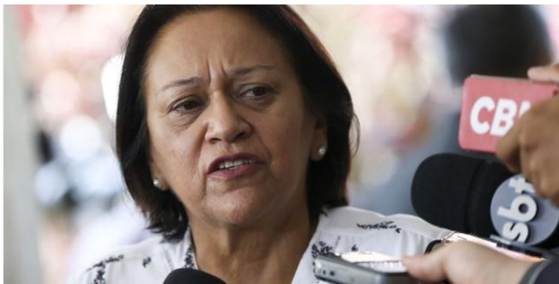
Fátima terá reuniões de trabalho ao lado de auxiliares

Com agendas nas áreas do desenvolvimento econômico, setor de energias renováveis, e da promoção do turismo no estado, a governadora Fátima Bezerra (PT) cumpre compromissos administrativos a partir desta segunda-feira (27), em Portugal. A governadora terá uma série de reuniões e audiências até o dia 4 de março.