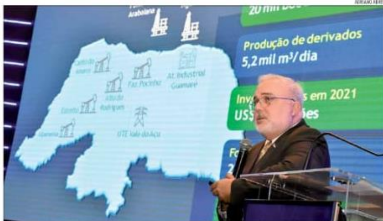
Durante palestra em Natal, presidente da Petrobras apontou perspectivas para produção de energia e frentes de investimentos no RN

Na sua última visita ao Rio Grande do Norte, que contou com um encontro com lideranças políticas e representantes de trabalhadores da Petrobras, o presidente anunciou que estavam suspensas as transferências programadas e engatilhadas à