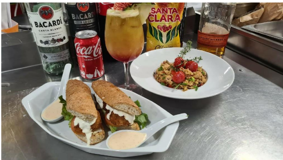
Sanduíche e prato feitos no workshop 2