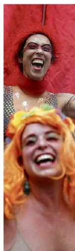
Pré-Carnaval do bloco Bastardo na zona oeste Danilo Verpa - 11.fev.23/Folhapress