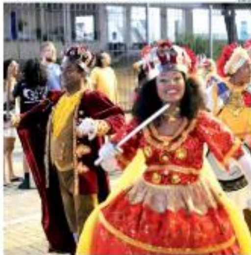
» É 100% « O tradicional Ballet Folclórico da Prefeitura de Natal comemora o Carnaval de Natal 2014. Ser mais a ser feliz, prefeito Álvaro Dias entregou a chave do cidade aos reis de Natal. » PÁGINA 10 «