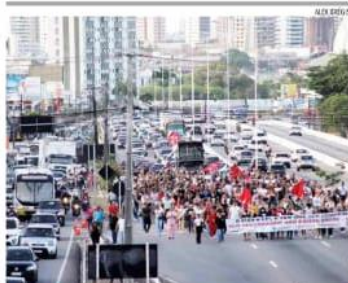
« SAÚDE » Profissionais de enfermagem realizaram um protesto em Natal nesta terça-feira (14) na defesa do piso nacional da categoria. O grupo saiu em passeata e causou grande engarrafamento. « PÁGINA 9 »