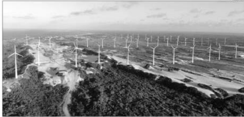
Em janeiro passado, o RN foi responsável por uma expansão de 579,6 megawatts de operação, alcançando a liderança nacional

Segundo a Aneel, nove estados tiveram empreendimentos liberados no mês passado. Além do Rio Grande do Norte, Minas Gerais (319,4 MW) e Bahia (163,80 MW) foram destaques. Em todo o ano passado, a matriz elétrica geral do Estado expandiu 800,3 MW, o quarto maior desempenho no País. Ainda segundo a Aneel, além dos 7,43 de potência fiscalizada, o RN possui 5,01 GW que estão em construção ou ainda não foram construídos – totalizando 12,44 GW de potência outorgada para o Estado (em fevereiro de 2022, eram 11 GW). São 240 empreendimentos em operação, 51 empreendimentos em construção e