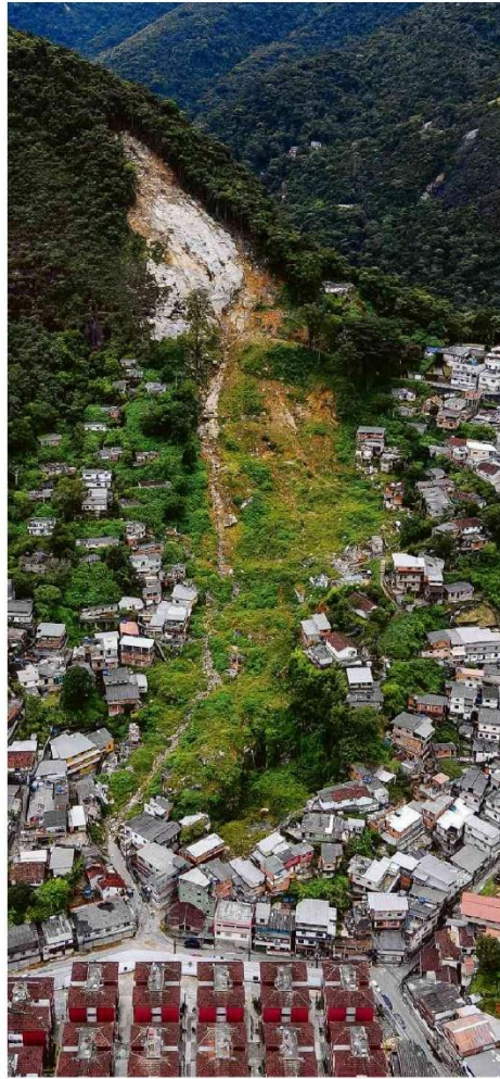
Morro da Oficina, em Petrópolis, ainda com escombros de 1 ano atrás.