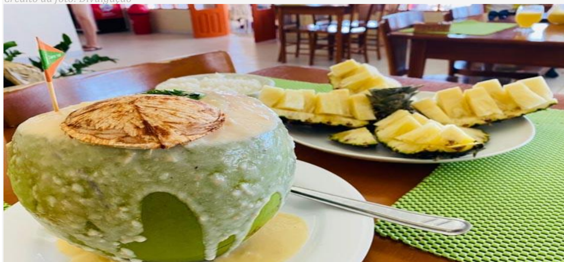
Gastronomia de Baía Formosa é um dos atrativos

Aventura, mar azul, lagoas e rios, ondas perfeitas, comida regional, belezas naturais e hospedagem aconchegante é o que te espera em Baía Formosa – a 100 quilômetros de Natal.