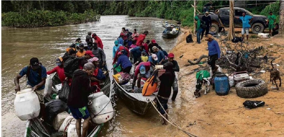
Garimpeiros desembarcam no porto do Arame, no rio Uricóera, município de Alto Alegre (RR), após deixarem os garimpos ilegais na Terra Indígena Yanomami.