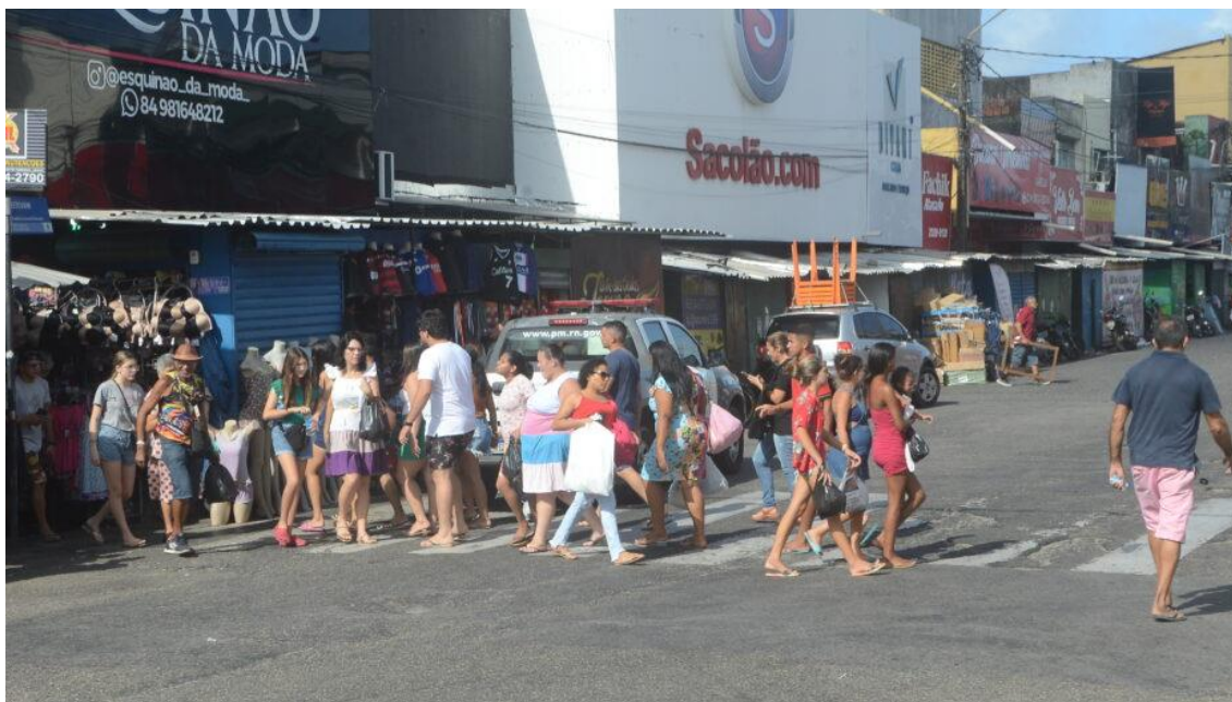
Comércio de rua e supermercados fecham na segunda-feira de folia