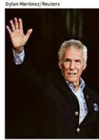
Burt Bacharach no festival Glastonbury em 2015

Marcos Lisboa Homicídio subiu em área de garimpo ilegal A16