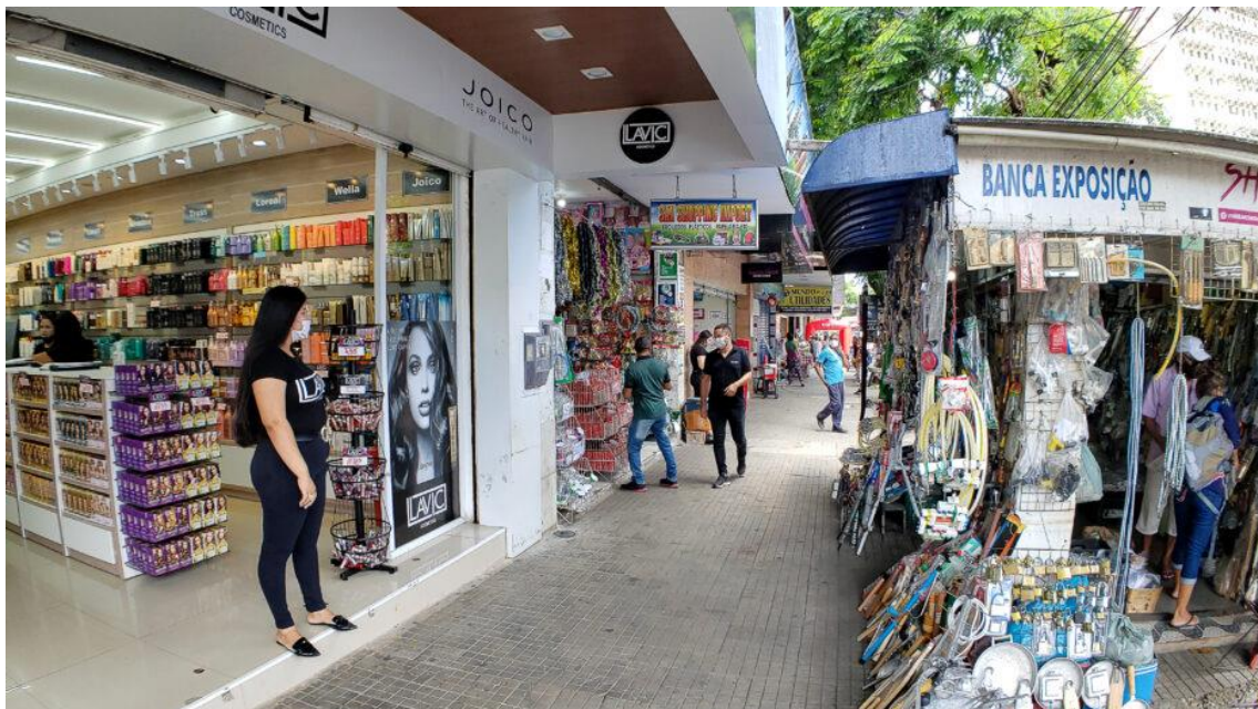
Comércio potiguar funcionará em horário diferenciado