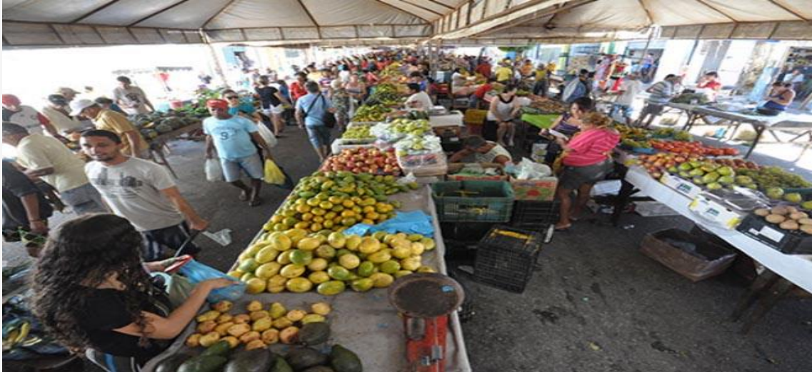
Feira do Alecrim, uma das mais movimentadas de Natal

Durante os dias de Carnaval, o comércio potiguar funcionará em horário diferenciado. Conforme a Convenção Coletiva de Trabalho (CCT) firmada pelo Sindicato do Comércio Varejista no Estado do RN (Sindilojas RN) e o sindicato laboral, a Fecomércio RN informa o horário de funcionamento entre os dias 18 e 22 de fevereiro.