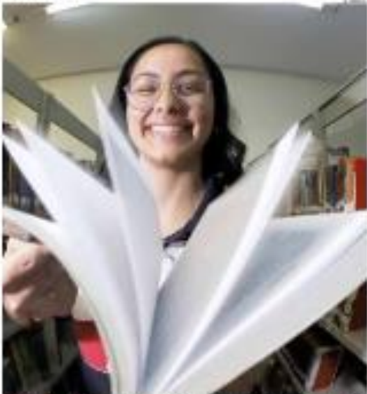
» CONTABILIDADE - Na Segunda-feira, os contabilistas começaram a entregar as notas mil (ou "nota") de 2016, documento que compõe uma nota fiscal para o ano de 2016, das atividades, sendo emitida de forma retroativa. » Página 7 «