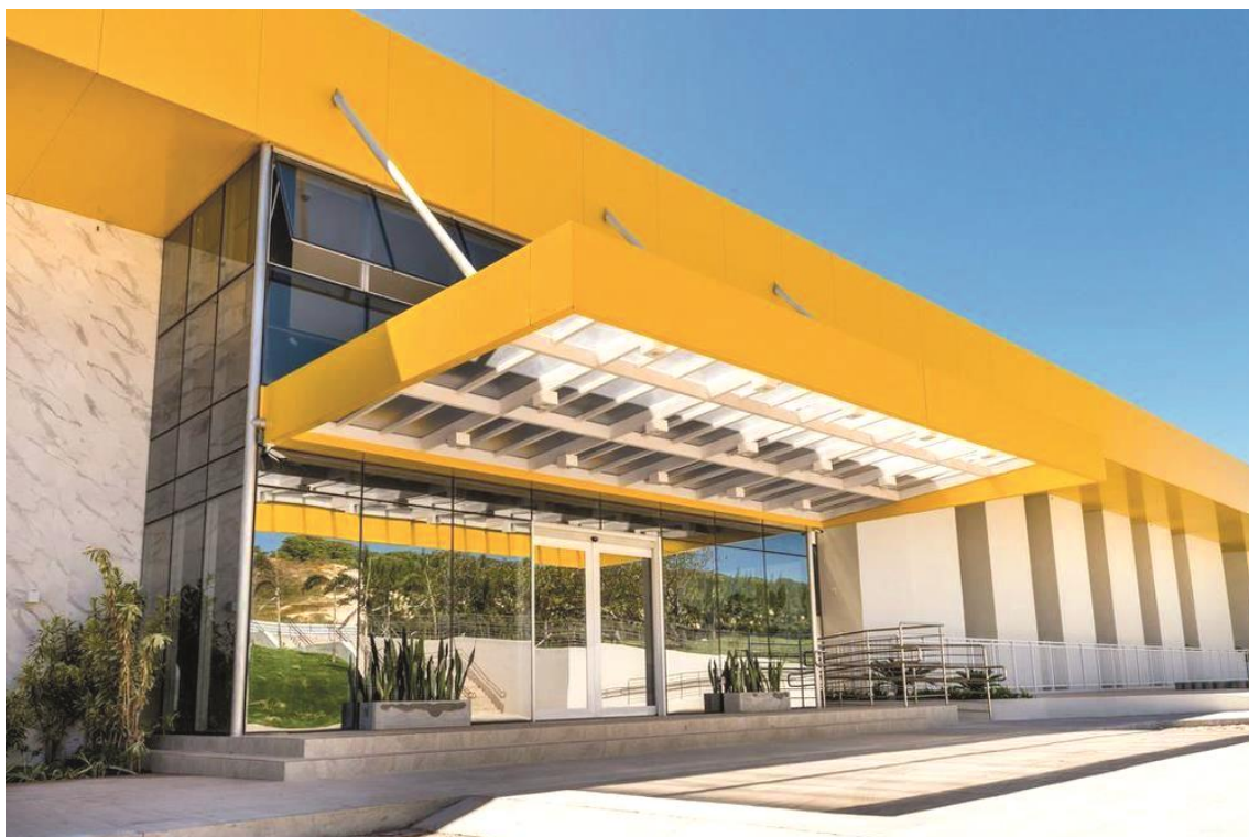
Hotel-Escola Senac Barreira Roxa

Atualmente, o Hotel-Escola Senac Barreira Roxa possui 150 leitos e dispõe de salão de jogos, academia de ginástica, espaço infantil, baby copa e área de lazer. A estrutura ainda oferece o Restaurante Navarro, Bar Teófilo e Café Dorian Gray, espaços abertos ao público e que privilegiam a cultura local desde o cardápio até arquitetura e decoração.