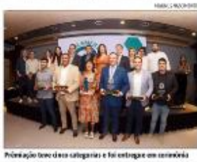
Prêmiação aos vereadores e foi entregue em cerimônia