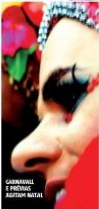
CARNIVAL E PRÉVIAS AGITAM NATAL

SECURANÇA - O comandante-geral da Polícia Militar do Rio Grande do Norte, coronel Alcirio Assunção, garante a presença de efetivo policial para a Operação Carnaval, mesmo com o pagamento das diárias operacionais atrasado. Segundo ele, o Governo fará parte do pagamento até a próxima segunda-feira (19) e o restante dos valores será quitado com a entrada do orçamento estadual de 2017, em março. Operação visa garantir segurança nos polos de folga do Estado. » Página 6 «