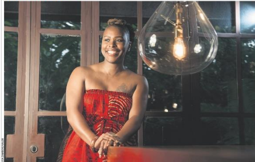
A AKA, agência ligada ao grupo de publicidade e relações públicas WPP, vai abrir mil vagas em seu programa Soma+, plataforma para capacitação de jovens negros e indígenas para ingressar no mercado publicitário, diz Stacie Graham, diretora global de equidade racial da WPP. Página F7