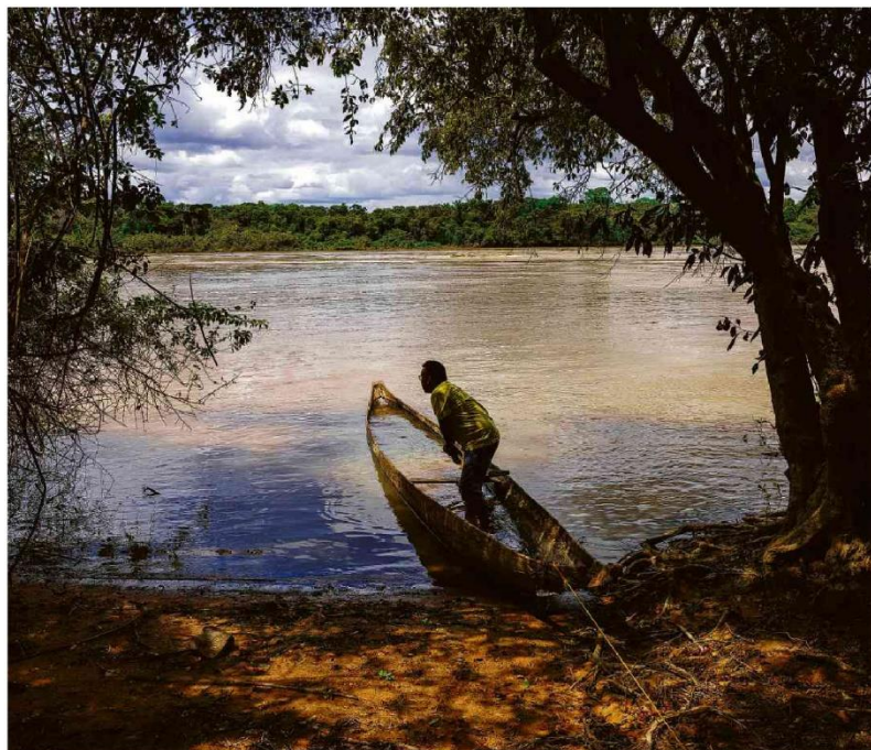
Lula de Almeida/Folhapress

O deputado disse também que o Congresso vai analisar a medida provisória de Lula que transferiu o Coaf (Conselho de Controle de Atividades Financeiras) do BC para o Ministério da Fazenda —na gestão Bolsonaro, ele lembrou, a Câmara se opôs a transferir o órgão ao Ministério da Justiça. Mercado A19