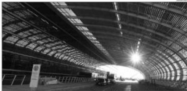
O vencedor do certame irá administrar o terminal para passageiros, 10 anos e terá a obrigação de investir pelo menos R$ 200,1 milhões em obras no longo do período

A Agência Nacional de Aviação Civil (Anac) publicou ontem o edital para a relicitação do Aeroporto Aluizio Alves, no dia 19 de maio, às 14h. Interessados têm até a sexta (10) para pedir esclarecimentos sobre o certame. O edital detalha as regras para a relicitação do aeroporto, que será realizado em caráter de urgência. O processo de licitação será aberto em 19 de maio, às 14h, e o prazo para a entrega das propostas é de 10 dias, terminando em 29 de maio, às 14h. O edital também estabelece as regras para a contratação de uma empresa para a construção e a operação do aeroporto. O valor mínimo para o lance é de R$ 226,9 milhões, incluindo o custo de construção e o custo de operação. O edital também estabelece as regras para a contratação de uma empresa para a construção e a operação do aeroporto. O valor mínimo para o lance é de R$ 226,9 milhões, incluindo o custo de construção e o custo de operação.