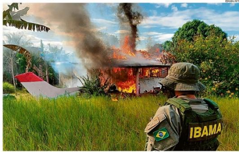
Agente do Ibama acompanha destruição de aeronave usada por garimpeiros. Ações são prévias da operação da PF e das Forças Armadas a partir de amanhã na área aeronômica. PÁGINA 9