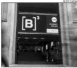
Sinal de B no terminal do Aeroporto Aluizio Alves

O edital de licitação para a relicitação do Aeroporto Aluizio Alves, no dia 19 de maio, às 14h, estabelece as regras para a contratação de uma empresa para a construção e a operação do aeroporto. O edital também estabelece as regras para a contratação de uma empresa para a construção e a operação do aeroporto. O valor mínimo para o lance é de R$ 226,9 milhões, incluindo o custo de construção e o custo de operação.