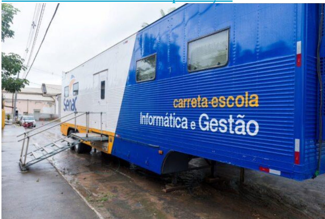
Unidade Móvel Senac Informática e Gestão (2).

Unidades móveis do Sesc e Senac estarão atuando por quase dois meses, com cursos, realização de exames e ações educativas