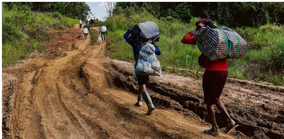
Após deixarem Terra Indígena Yanomami, garimpeiros levam seus pertences por estrada que liga o porto do Arame, no rio Uraricoera, à vila Reislândia, em Alto Alegre (RR)