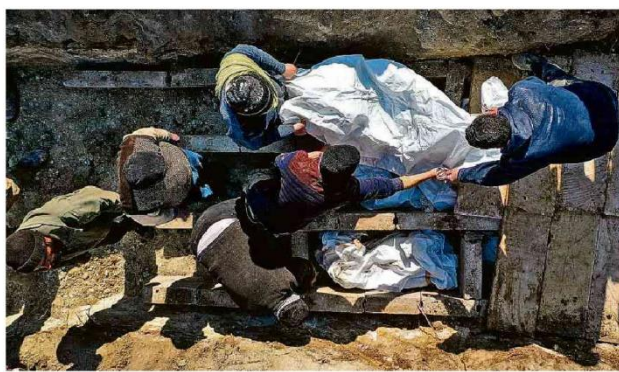
Corpos de vítimas do terremoto na Síria são colocados em sepultura coletiva em Jandaris, norte de Aleppo