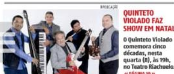
« QUINTETO VIOLADO FAZ SHOW EM NATAL » O Quinteto Violado comemora cinco décadas, nesta quarta (8), às 19h, no Teatro Riachuelo. « PÁGINA 10 »

O preço do diesel vendido pela Petrobras às distribuidoras terá uma queda de R$ 0,40. Em termos percentuais, redução é de 8,8%. « PÁGINA 7 »