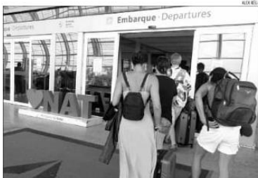
Prevê-se que o Aeroporto Aluísio Alves reciba investimentos de R$ 288 milhões ao longo de 30 anos

valor exato a ser alocado no aeroporto, o que vai depender da necessidade de melhorias, complexidade dos equipamentos, mas as estimativas realizadas nos Estudos de Viabilidade Técnica, Econômica e Ambiental (EIVTEA) de São Gonçalo do Amarante, atualizadas em valores de maio de 2021, sugerem investimentos totais de R$ 288 milhões ao longo da concessão de 30 anos. O ganhador da nova licitação deverá assumir o pagamento de outorga e finalmente será iniciada a obra de construção. A partir da assinatura, o edital será publicado no Diário Oficial da União em 19 de maio de 2023, observado a disponibilidade da organização do leilão, de acordo com a Anac. «Este processo, na última quinta-feira (02), no road show promovido pelo ministério de Portos e Aeroportos, Márcio França