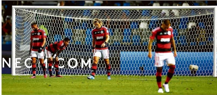
Desânimo. Com um a menos em campo no segundo tempo, jogadores rubro-negros se abatem após o terceiro gol do time árabe em Tânger. Fla disputa o terceiro lugar no sábado

RIO DE JANEIRO, QUARTA-FEIRA, 8 DE FEVEREIRO DE 2023 ANO XXVIII - Nº 32.690 • PREÇO DESTE EXEMPLAR NO RJ - R$ 5,00 2ª EDIÇÃO