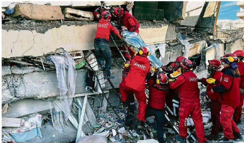
Socorristas tiram mulher dos escombros de um edifício destruído em Kahramanmaraş, Turquia; frio, novos tremores e crises atrapalham buscas.

Uma ala do governo busca vincular o executivo ao bolsonarismo — ele foi nomeado por Jair Bolsonaro (PL). Em sua promessa de desmontar o legado econômico da gestão anterior, Lula também sugeriu rever a privatização da Eletrobras, a qual chamou de "bandi-dagem". Mercado A13, A14 e A18