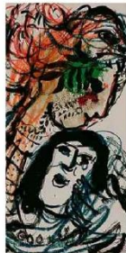
'Duas Cabeças' (1966), de Marc Chagall reprodução

Mostra em SP traz quase 200 obras de Chagall ao longo de 60 anos de carreira