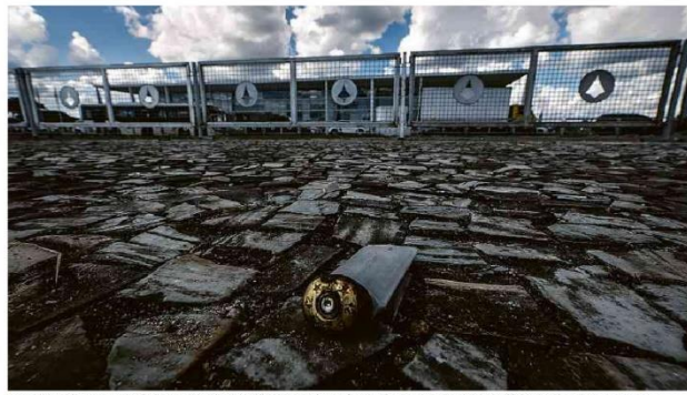
Um mês após ataques golpistas, cápsula de calibre 12 ainda está em calçamento diante do Palácio do Planalto.

Rio concreta faixa na praia e gera protestos Obra para reduzir impacto das ressacas em calçadão e quiosques de sete pontos da praia da Barra da Tijuca é suspensa após estudos apontarem riscos. B4