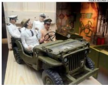
« HISTÓRIA » O Museu da Rampa está com exposição aberta ao público. Oportunidade para natalenses e turistas entenderem como se deu a participação do Brasil na Segunda Guerra Mundial. « PÁGINA 9 »