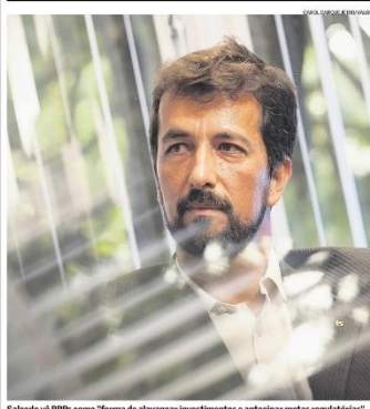
Salcedo vê PPPs como "forma de avançar investimentos e antecipar metas regulatórias"

Com dívida líquida de R$ 8,7 bilhões e problemas operacionais, a Light está em um momento decisivo. A partir de maio, a distribuidora de energia terá que informar ao governo se pretende renovar a concessão, que vence em maio de 2026. Além disso, a preocupação do mercado com a situação financeira da empresa aumentou na semana passada, com a notícia da contratação da consultoria Laplace — conhecida por assessorar companhias em dificuldades. Desde então, agências de classificação de risco rebaixaram a nota da empresa e suas ações (ONV) caíram 30,18%. Impossibilitado de recorrer à recuperação judicial, por ser concessionária de serviço de energia, a empresa quer cortar custos e reduzir investimentos, enquanto busca "melhorias em sua estrutura de capital". Página B1