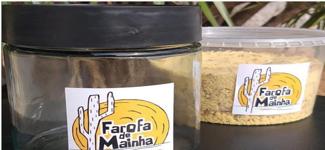
Farofa da Mainha