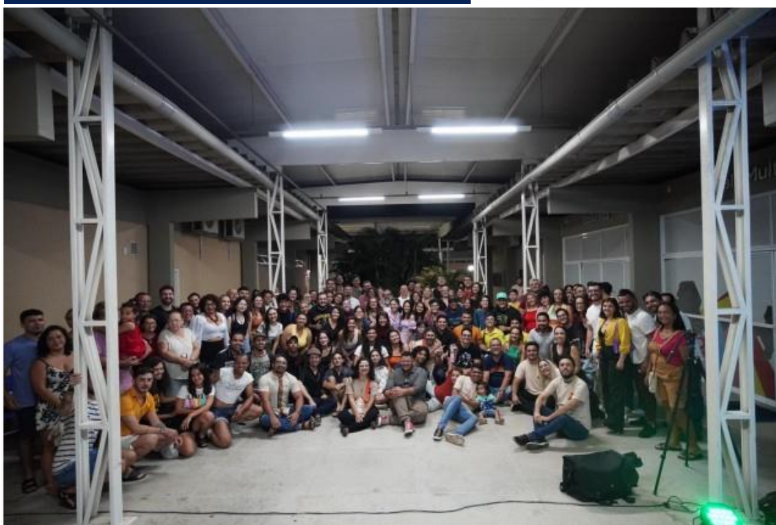
Movimento mobiliza inúmeras pessoas focadas na produção audiovisual

Há alguns anos, o cenário da produção audiovisual vem apontando um crescimento em Mossoró, com produtores e coletivos independentes apresentando novos trabalhos nos campos da ficção e documentário. Para somar forças e colaborar com a consolidação da cena audiovisual mossoroense, um novo coletivo se apresentou à cidade na semana passada.