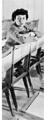
Lina Bo Bardi em cadeira desenhada por ela, em 1947