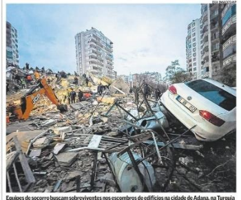
Equipes de socorro buscam sobreviventes nos escombros de edifícios na cidade de Adana, na Turquia

Com a concorrência do Pix, o setor financeiro tenta modernizar os boletos, com mudanças para que a liquidação ocorra no dia do pagamento. Além disso, estuda a criação de um padrão para o chamado "bolepix" (inciso do QR Code do Pix nos boletos), o que agilizará os processos. Hoje, a liquidação de um boleto de uma instituição pago em outra acontece no dia seguinte. Em 2022, foram emitidos 7,7 bilhões de boletos no país, mesmo número do ano anterior e 10% mais que em 2020. Página C1