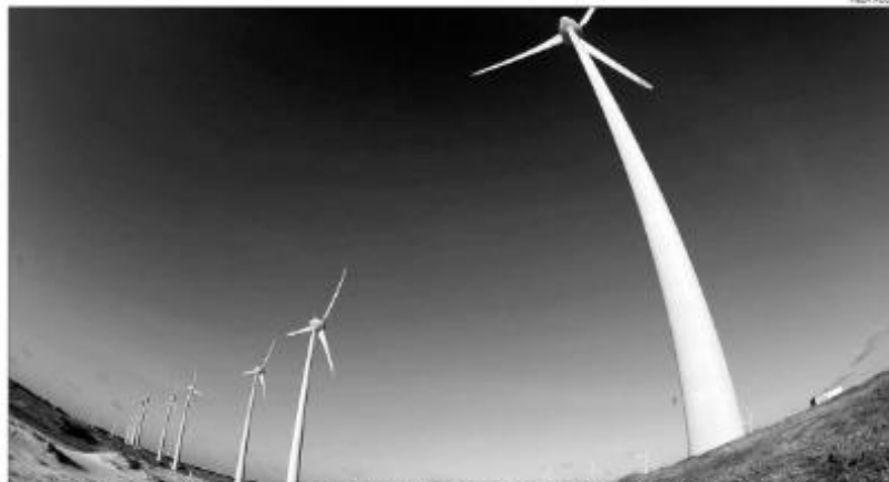
A geração eólica cresceu 12,6% no comparativo anual, fornecendo à rede elétrica mais de 9 mil MW médios. País tem 891 parques eólicos

*A reversão do cenário crítico de 2021 deixa o país em uma situação muito mais confortável para 2023. Hoje a capacidade