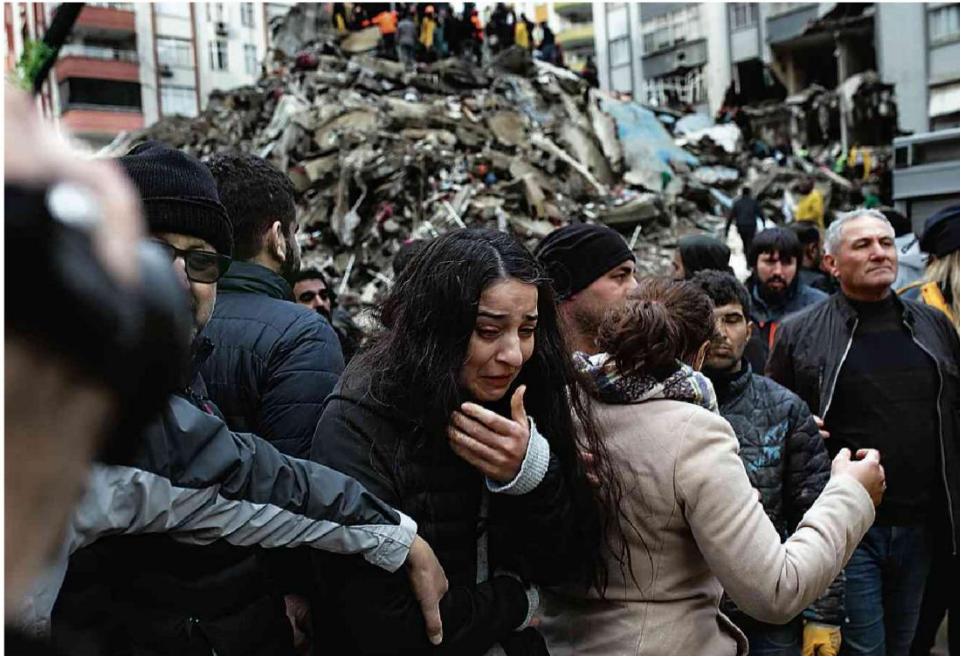
Passantes aguardam o trabalho das equipes de resgate que trabalham em um dos prédios destruídos na cidade turca de Adana pelo terremoto de magnitude 7,8 que atingiu a Turquia e a Síria.