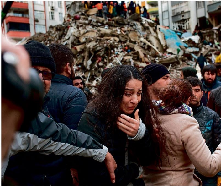
Ruinias. Em Adana, na Turquia (cima), mulher chora durante busca por sobreviventes. Em Jandarís, na Síria (no alto), moradores de um prédio que desabou salvam uma menina