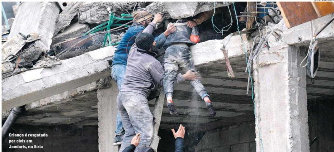
Criança é resgatada por civis em Jandaris, na Síria