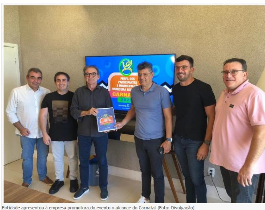
Entidade apresentou à empresa promotora do evento o alcance do Carnatal

O Carnatal faz parte do calendário dos grandes eventos do país. Há 31 anos, a micareta atrai foliões e turistas de todos os lugares do Brasil. Para aferir os impactos do evento na área produtiva, o Instituto Fecomércio RN da Federação do Comércio de Bens, Serviços e Turismo do RN (FECOMÉRCIO/RN) realizou uma pesquisa para traçar o perfil dos participantes da festa e apresentou aos diretores do Carnatal, nesta terça-feira (27).