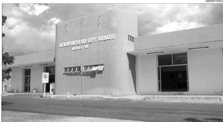
Terminal, que tem a capacidade de operar voos regionais e nacionais com aviões de médio porte, era gerido pelo Governo do Estado

Hoje, o aeroporto tem a capacidade de operar voos regionais e nacionais com aviões de médio porte, como Boeings 737