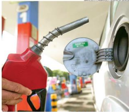
Novo governo tem sinalizado com retomada da cobrança de impostos