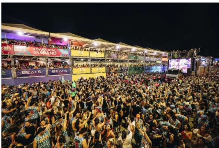
Nesse ano, um terço do público do Carnatal era de outros estados.

Quase 2 milhões de passageiros já passaram pelo principal aeroporto do Rio Grande do Norte. A capital potiguar é um dos principais destinos no Brasil e recebe turistas de todo o país e, também, do exterior. Para analisar o perfil do turista de eventos no RN e as impressões que os visitantes compartilham nas mídias sociais, a Empresa Potiguar de Promoção Turística (Emprotur) lançou duas novas bases de dados para consulta do trade turístico e da sociedade em geral.