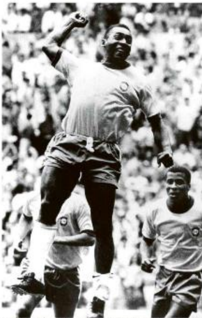
Com o filho mais velho, Pelé comemora gol contra a Tchecoslováquia no jogo que o levou ao título de Brasil de 1970.

★ O ÚNICO JOGADOR TRICAMPEÃO DA COPA ★ O ATLETA À FRENTE DA CONSOLIDAÇÃO DO ESPORTE MAIS POPULAR DO PLANETA ★ O NOME DE QUATRO LETRAS MAIS CONHECIDO MUNDIALMENTE