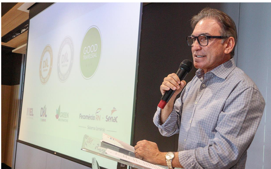
Presidente do Sistema Fecomercio, Marcelo Queiroz

SEQUA, da Alemanha, a fim de promover treinamentos focados na promoção do turismo sustentável e governança municipal de destinos turísticos.