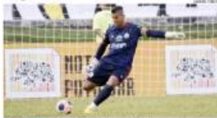
« DEBUTO » Tem sabor e que é decisivo na temporada de 2020 e com uma angústia que já está sob o comando, o técnico entra em campo hoje para encarar a tarefa mais, no estádio José Rocha. Para o vencer e recuperar a liderança do grupo. « 2020.12.17 »