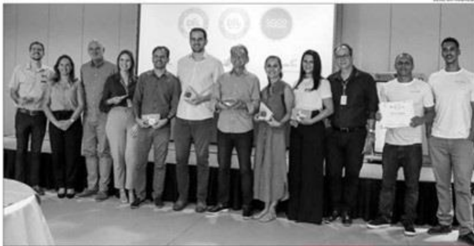
Certificação foi entregue, ontem, a representantes do Camarões e da Toca da Coruja no Hotel Barreira Roxa, em parceria com a Fecomércio

"Essa comunidade foi a comunidade que nos acolheu, então a gente retribui dessa forma porque o trabalho da Toca é pautado em três pilares de sustentabilidade: o ambiental, o social e o econômico", complementa a proprietária. De acordo com ela,