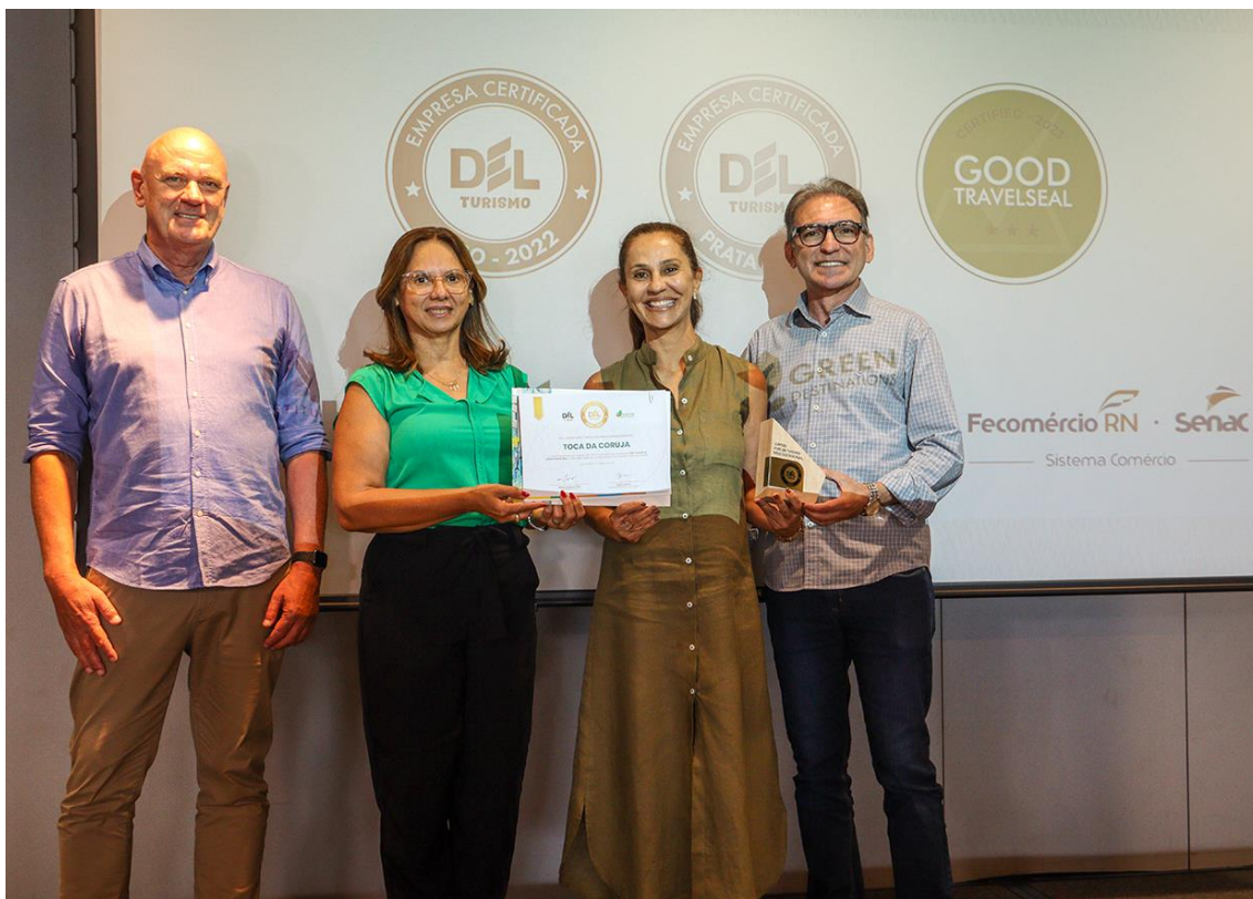
Pousada Toca da Coruja