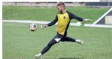
« CONSENTADO » Em a vitória na Copa do Nordeste, marcado para sábado. Diante do Sport, com tudo, ainda assim o ABC mantém o foco com o título, sobretudo de hoje pela liderança. Além disso, os três pontos para abrir na liderança. « 2020.12.17 »