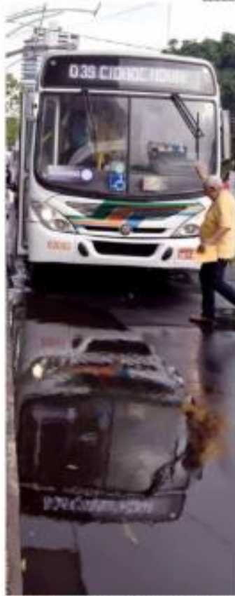
« PROBLEMAS » Causados em agosto por R$ 128 mil para desviar e transporte público de Natal, o estudo de AET deverá ser entregue até o fim do mês. « 2020.12.17 »

ALERGIAS Diagnóstico pela prescrição do Senado ganha importância. « 2020.12.17 »